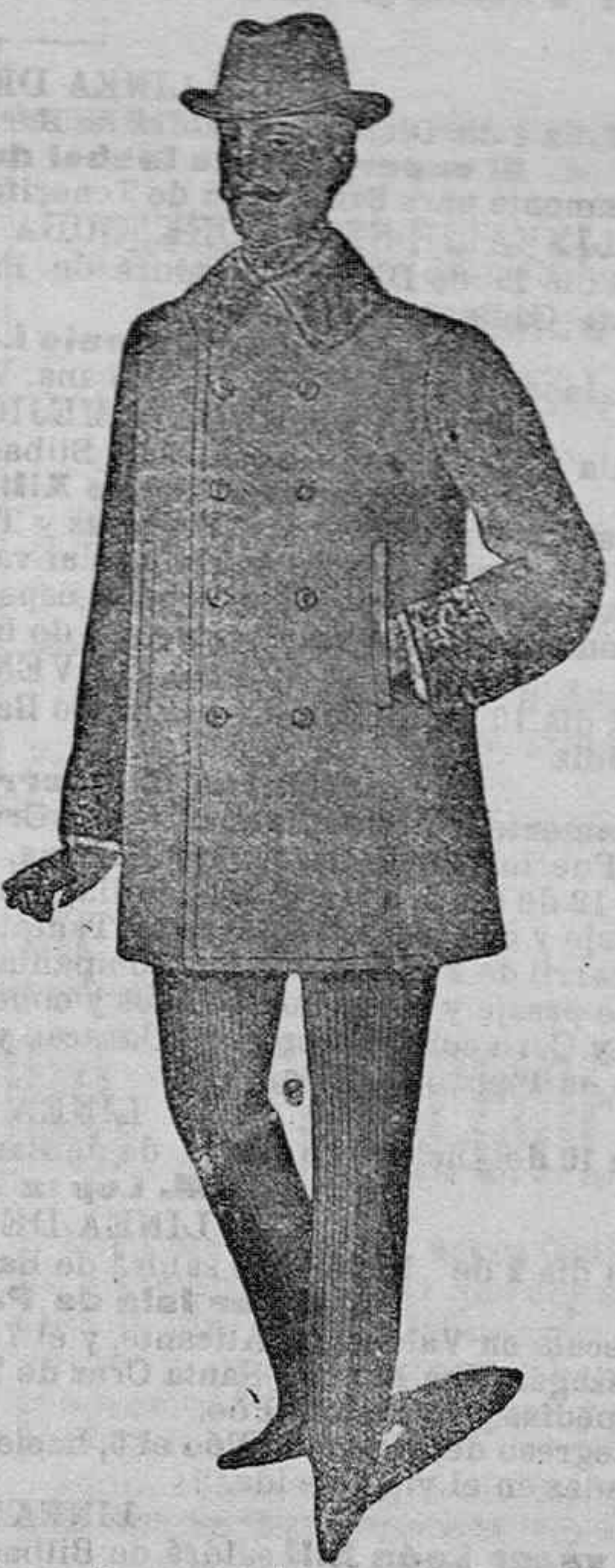
Corte con arreglo al último figurín