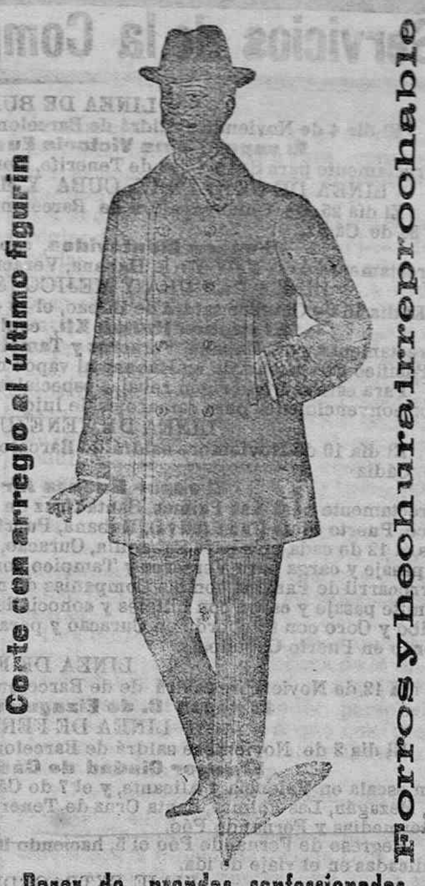
Corte con arreglo al último figurín