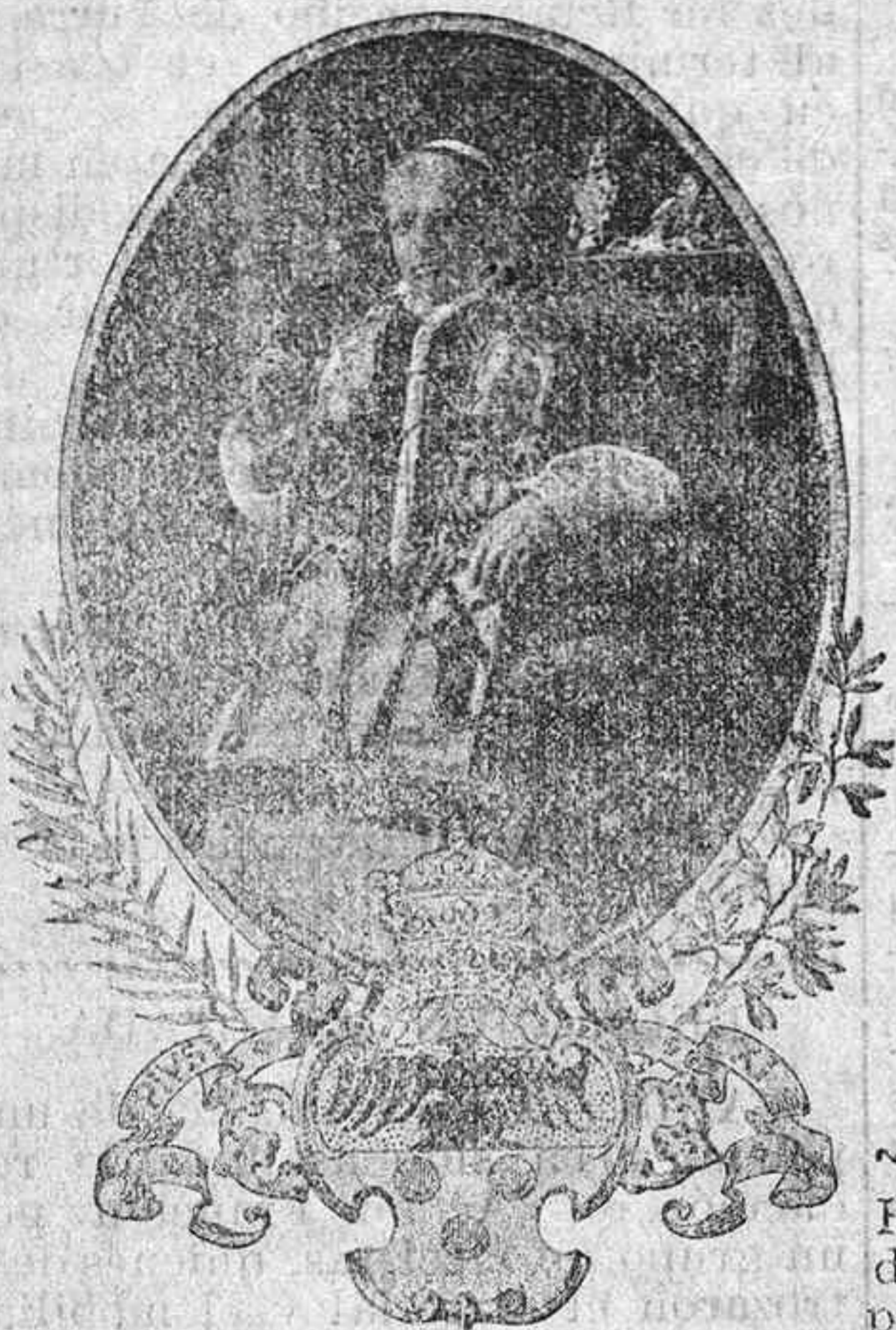
EL PAPA DE LAS MISIONES