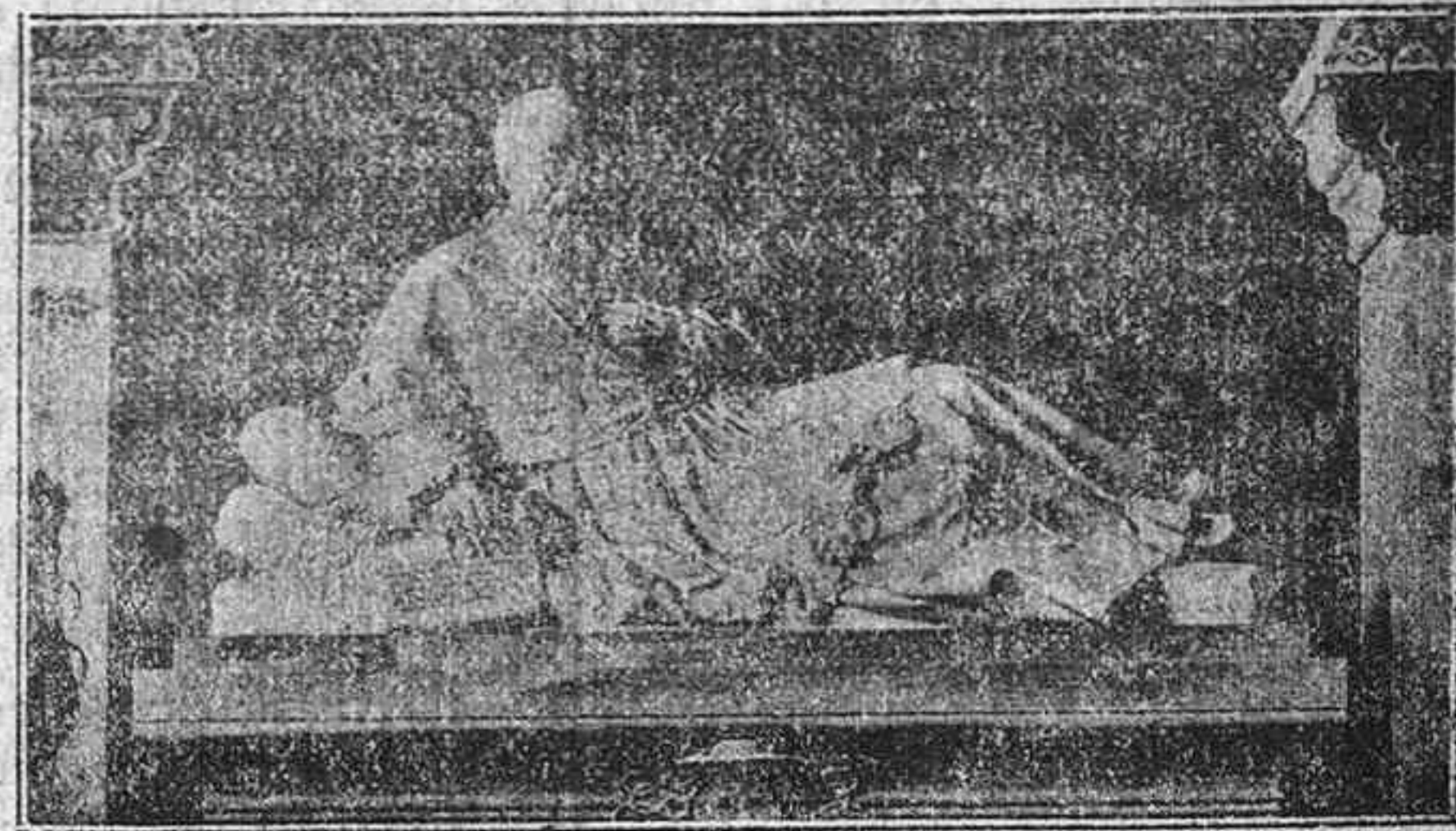
EL CARDENAL LAVIGERIE

mártir del Japón, humilde religioso dominico, rodeado de japoneses, por quienes vertió su sangre, y custodiado por soldados japoneses tan militarmente equipados con sus largas lanzas y ceñidos sus alfanges, daban la sensación de una escena impresionante y real del martirio glorioso. Un paje ricamente ataviado sobre un rico almohadón llevaba la daga auténtica, con la que la mano traidora de encubiertos piratas asesinaron al Venerable alavés, y piadosamente donado para este alarde misional por su poseedora la señora