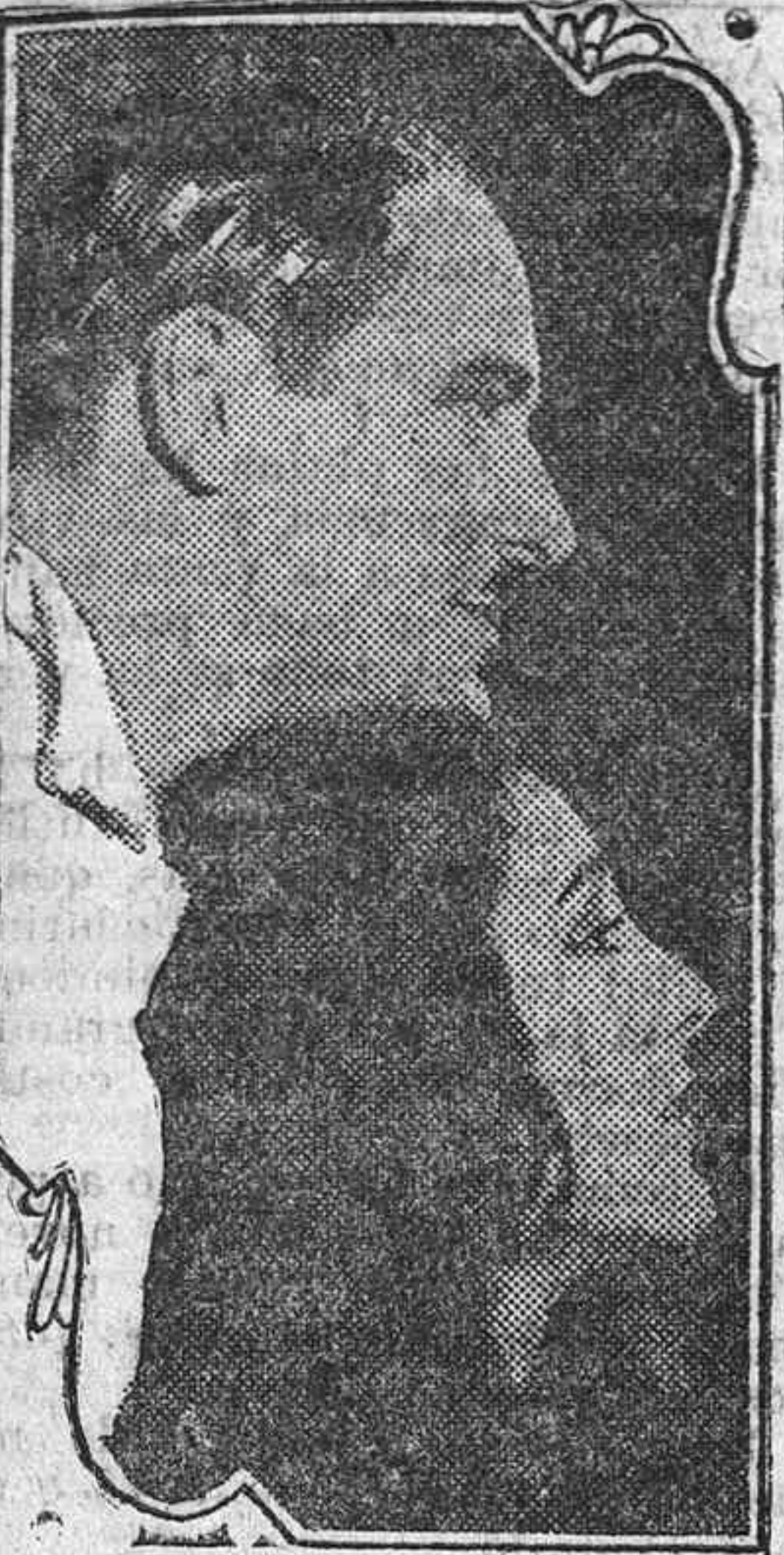
Los grandes artistas NORMAN KERRY Y PATSY RUTH MILLER que mañana se presentan en la joya LA MUJER Y EL BRUTO

La riqueza forestal es enorme en cantidad, calidad y valor económico. (Continúa en la pág. siguiente)