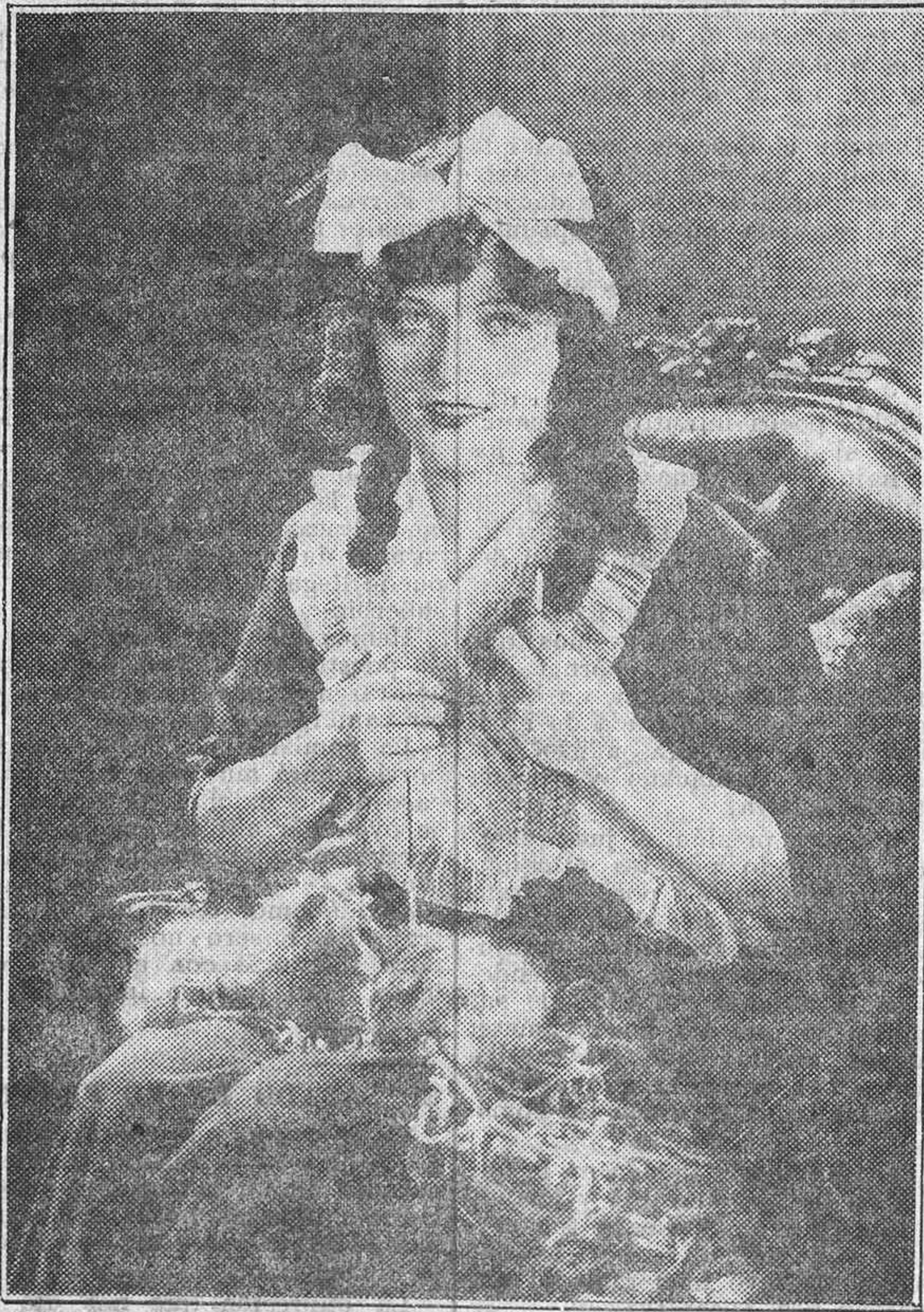
MARION DAVIES Estrella de la PARAMOUNT que se presentará en la pantalla del CINEMA con ADÁN Y EVA.