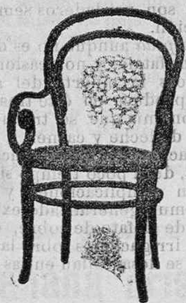
SILLA VIÑA curvado asiento regilla Pts. 12'50