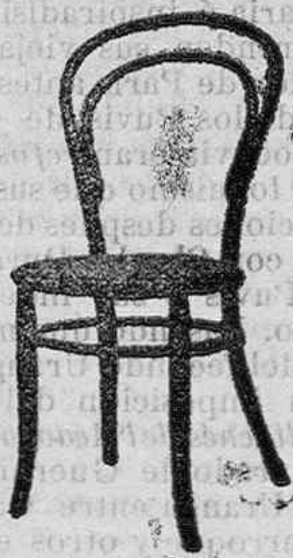
SILLA VIÑA curvado asiento regilla Pts. 5 50

INMENSO SURTIDO EN TODA CLASE DE MUEBLES