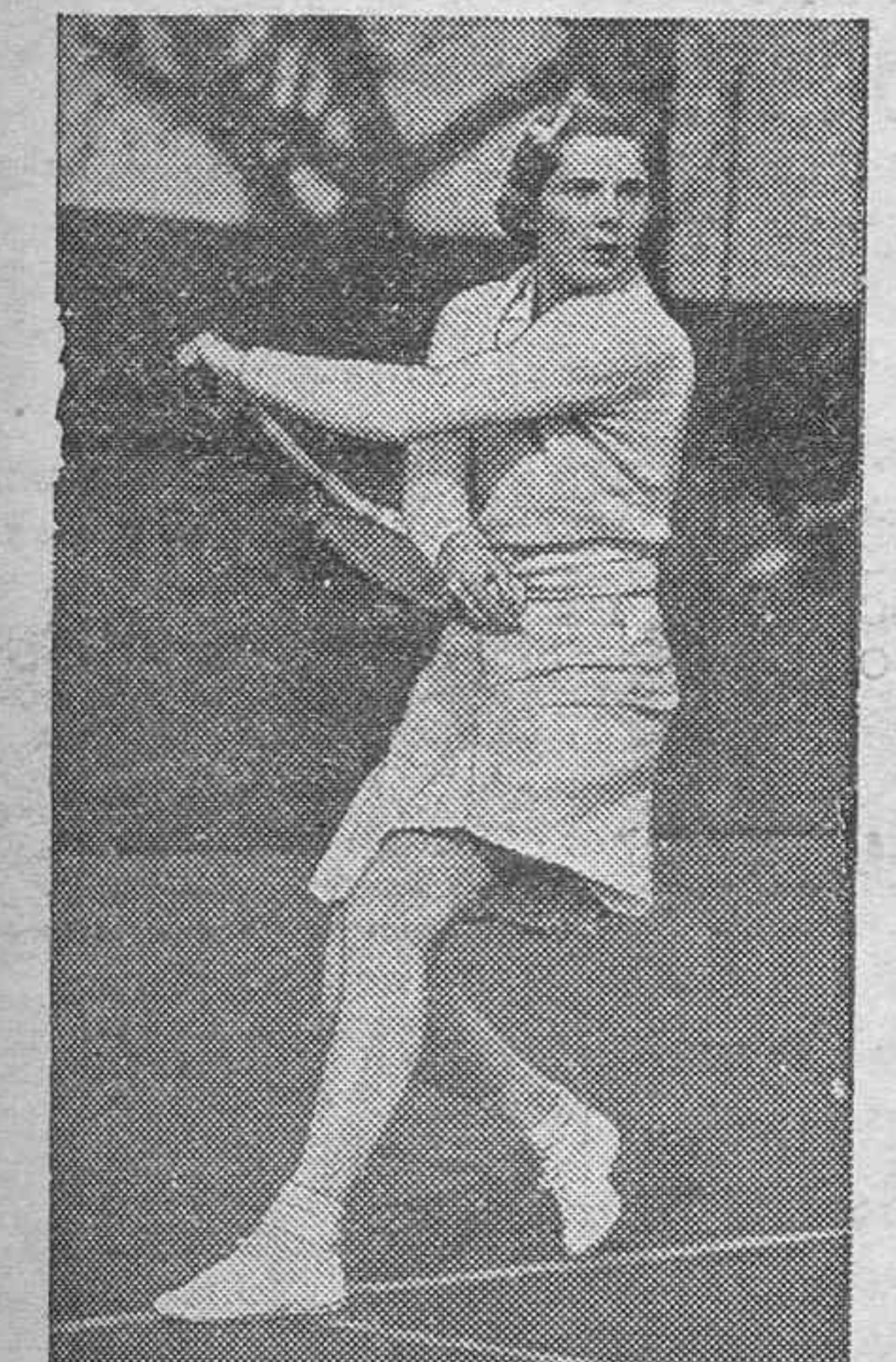
La célebre jugadora de tenis, inglesa, Miss Kang Stammers, que es una de las favoritas del próximo torneo de Wimbledon. Miss Stammers está considerada como una de las primeras jugadoras de mano izquierda.