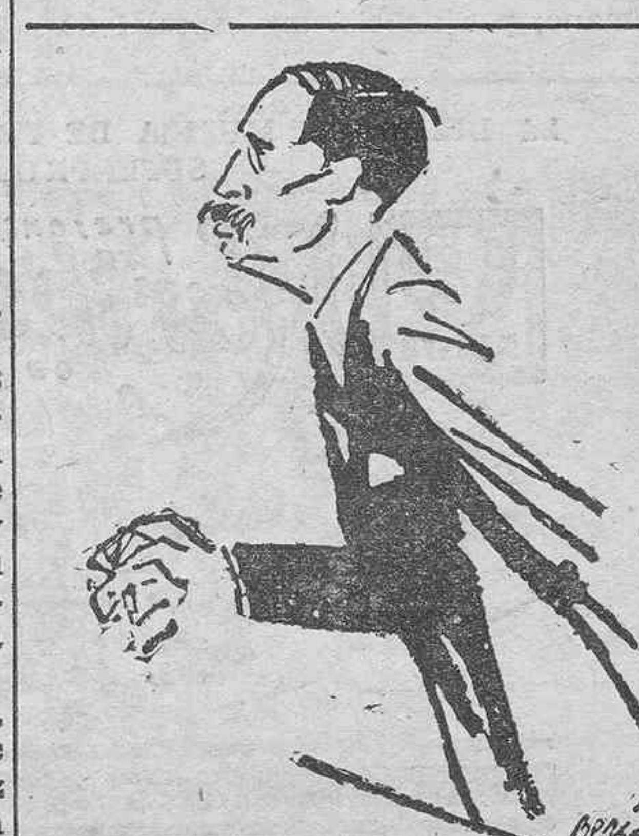
Leon Blum, uno de los dirigentes del Frente Popular francés, y árbitro en estos momentos de la política de la República

el resto de su vida militando dentro de las filas republicanas.