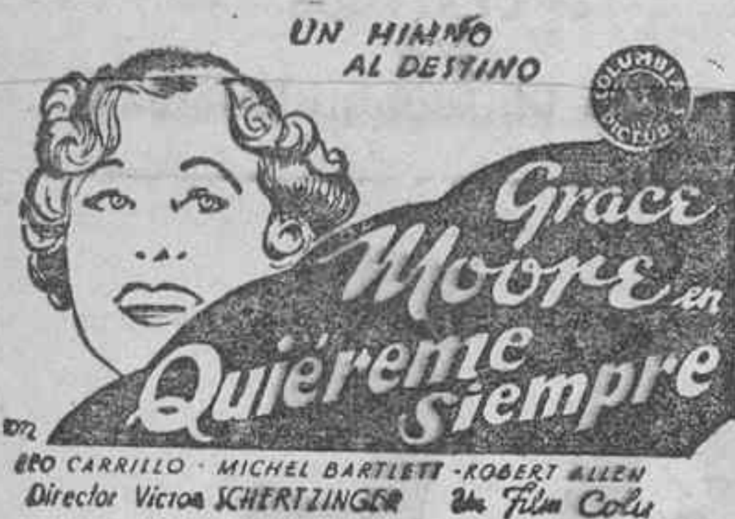
GRACE MOORE en "QUIÉREME SIEMPRE"

puesto de áskaris, situado en lo alto de una escarpada roca. Los oficiales me relataron que todas las noches tenían que subir las mulas desde el llano a lo alto de la posición a causa de la existencia en esa región de cierto insecto que mata las mulas y caballos en un día.