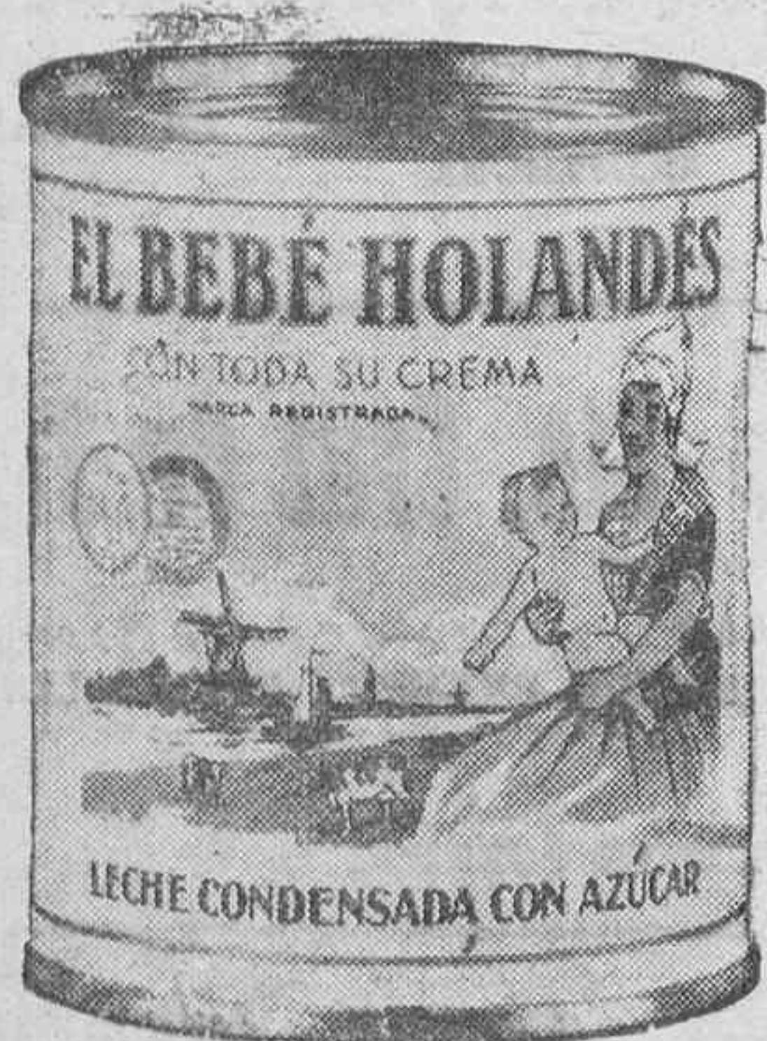
La marca de calidad

Es la mejor marca que sustituye a la leche materna. No olvide que consumiendo la leche condensada EL BEBÉ HOLANDES, a más de darle a su hijito un alimento de superior calidad, puede corresponderle un premio en nuestro "BOTE SORPRESA".