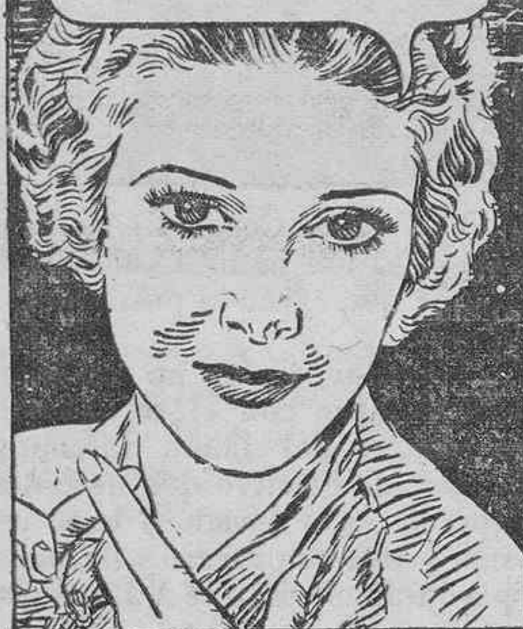
Estrella de Paramount Pictures.

ES IMPOSIBLE CAMBIAR EL COLOR DE SUS OJOS O ALTERAR LA FORMA DE SU CARA. PERO PUEDE VD. MANTENER SU PIEL SUAVE Y ATRACTIVA, Y ÉSTE ES EL ENCANTO FEMENINO MÁS IRRESISTIBLE.