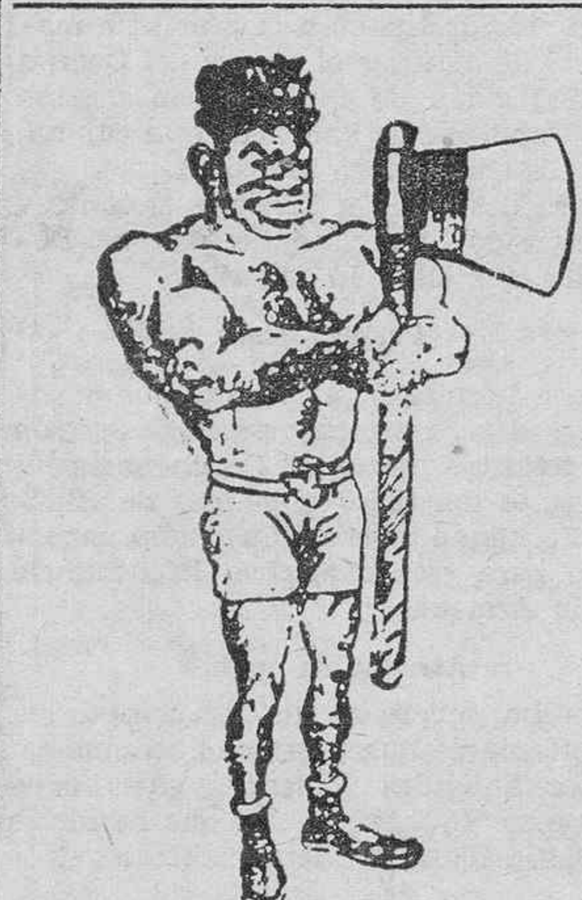
Paulino Uzeudun, que próximamente combatirá con el negro Joe Louis.

El equipo de relevos tres estilos grupo A se presentará en esta competición en busca de la revancha por la derrota sufrida durante la última competición por el grupo B.