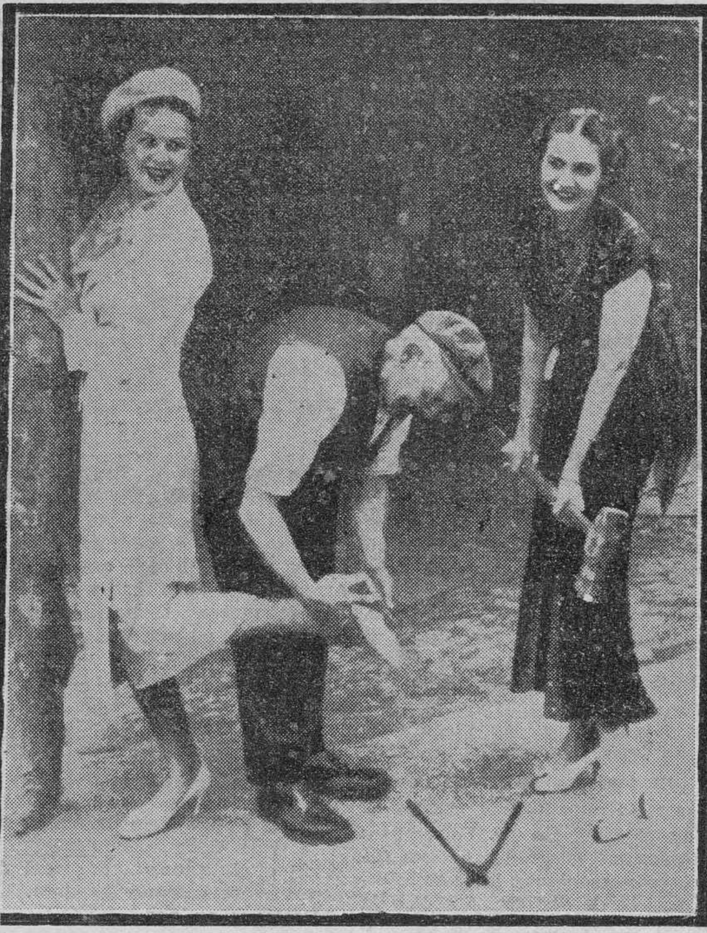
EN TORQUAY.—"Miss España" trata de reparar, con "apropiados útiles", una avería sufrida en el calzado por "Miss Checoslovaquia"