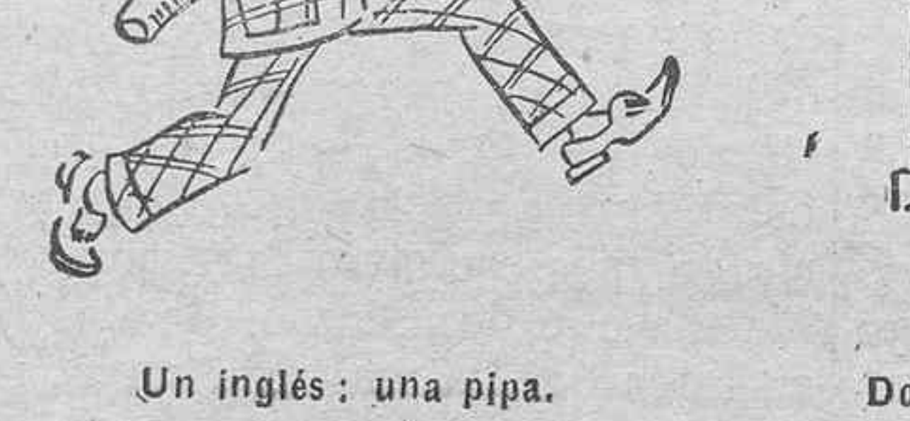
Un inglés: una pipa.