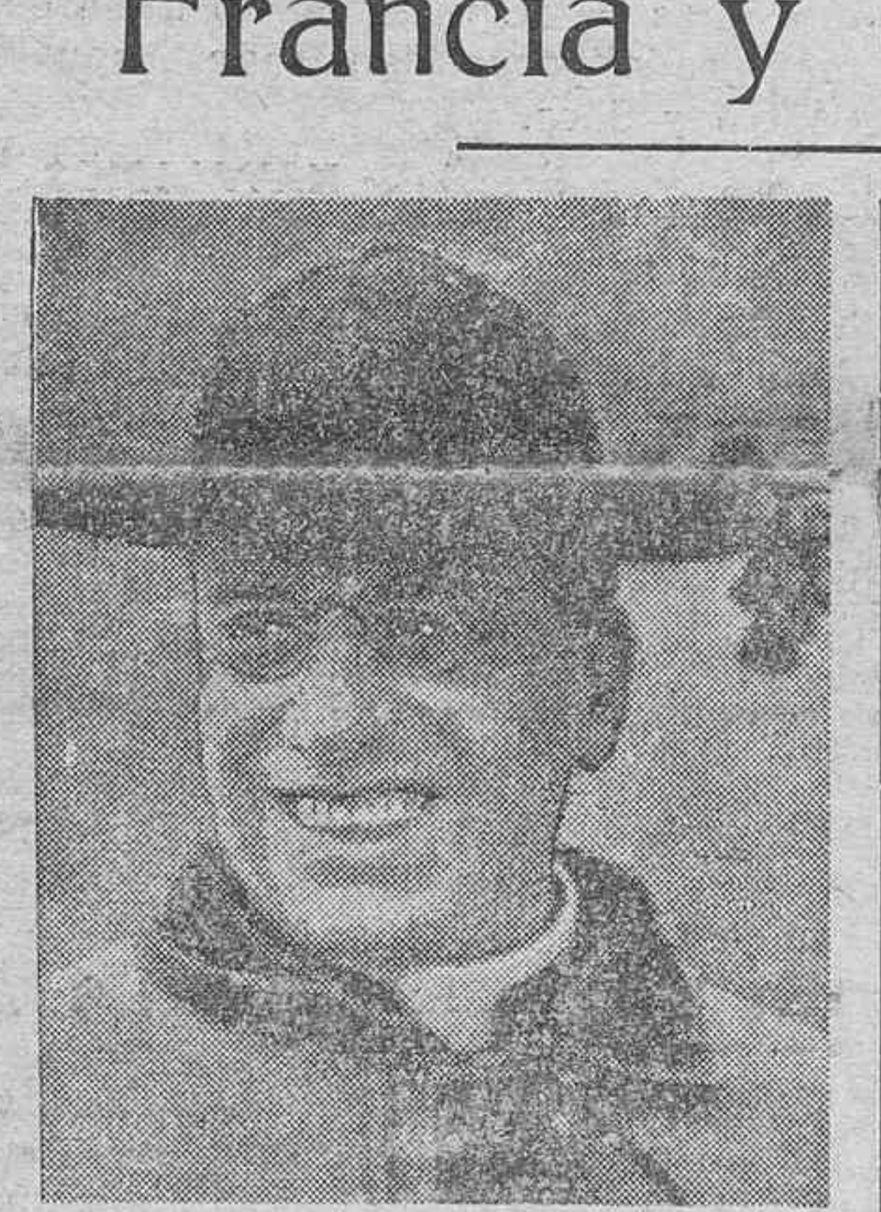
Mosseñor Ceretti, decano del Cuerpo diplomático

Las relaciones entre Francia y el Vaticano, que llegaron a ser bastante tirantes en los últimos meses, han vuelto a entrar en cauces de armonía debido a la discreta política del señor Herriot y del actual pontífice Pío XI, que parece refractario a establecer nuevas discordias con los republicanos franceses.