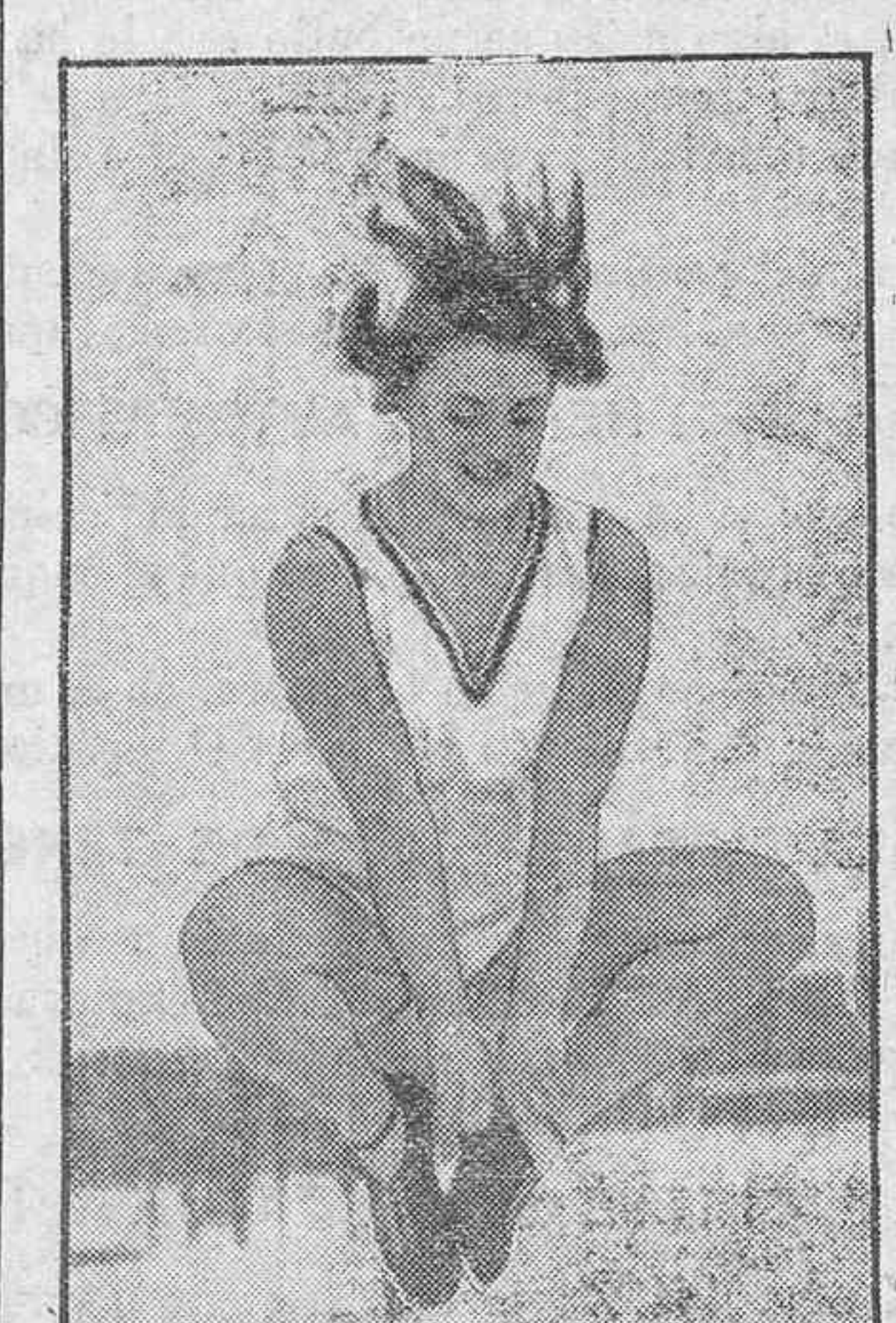
Un ejercicio de cultura física en un campo de nieve.