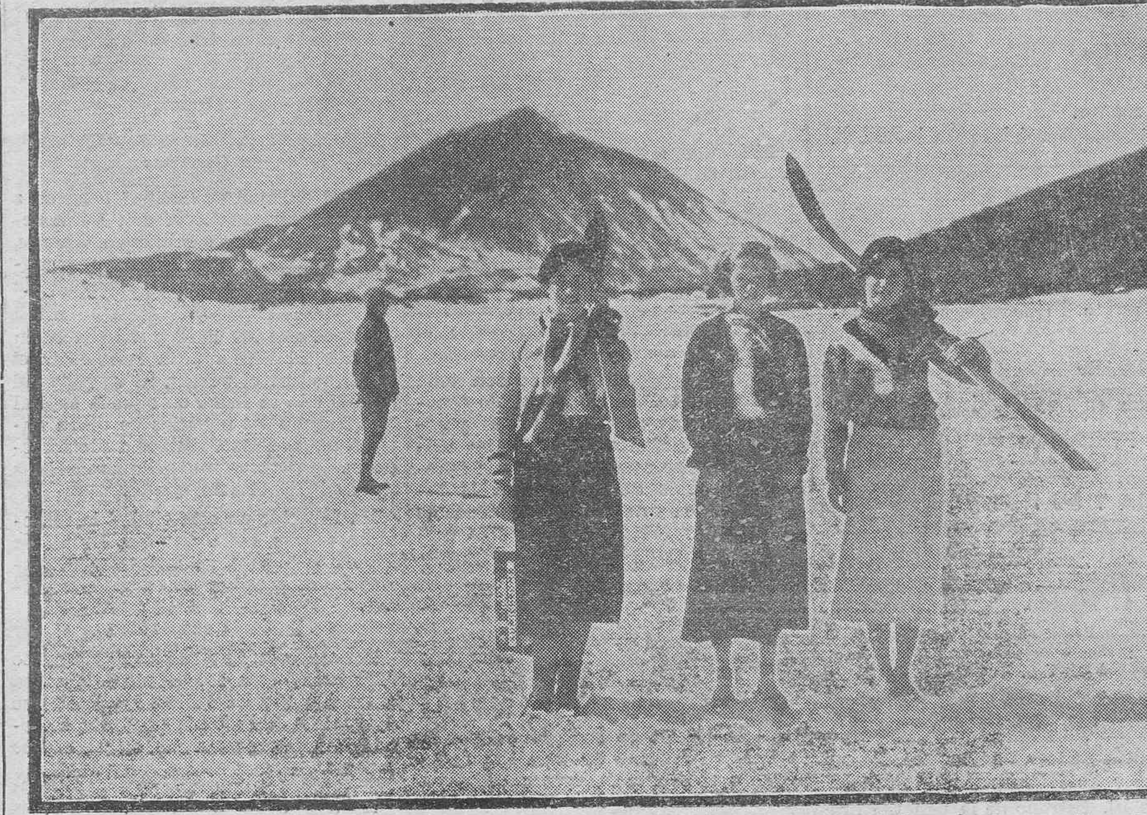
El excursionismo a las Cañadas va tomando aires de una gran cosa. El domingo hubo más de un millar de entusiastas de la nieve. He aquí a tres bellas alpinistas dispuestas a resbalar sobre la pista helada con sus esquís. Ahora, hay que hacer el refugio y las Cañadas serán la obligada excursión dominguera de la juventud, afanosa de deportes, de aire puro y de altura....