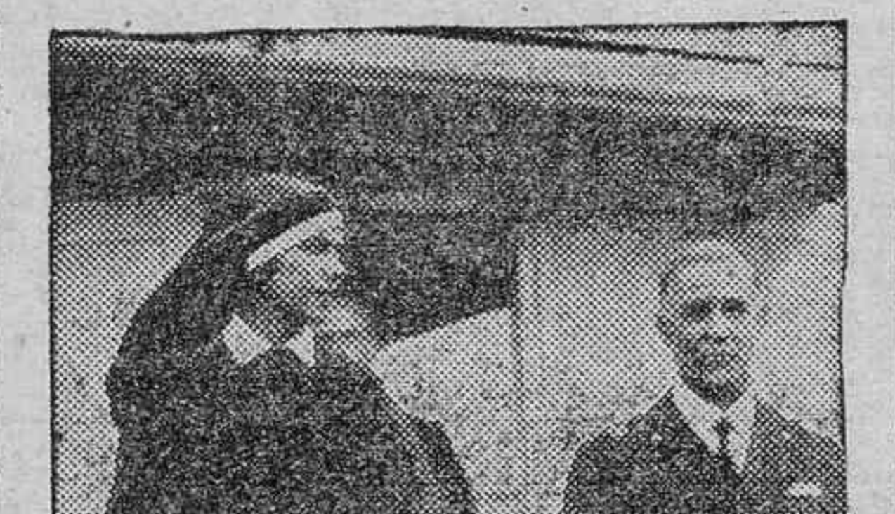
La Princesa de Piemonte en una visita a la Cruz Roja Italiana en Roma.

Paris, 16.—La Prensa de Roma publica la noticia de haberle sido concedido el título de Enfermera Su- perior de la Cruz Roja Italiana a la Princesa María de Piemonte, es- posa del Príncipe heredero de Ita- lia.