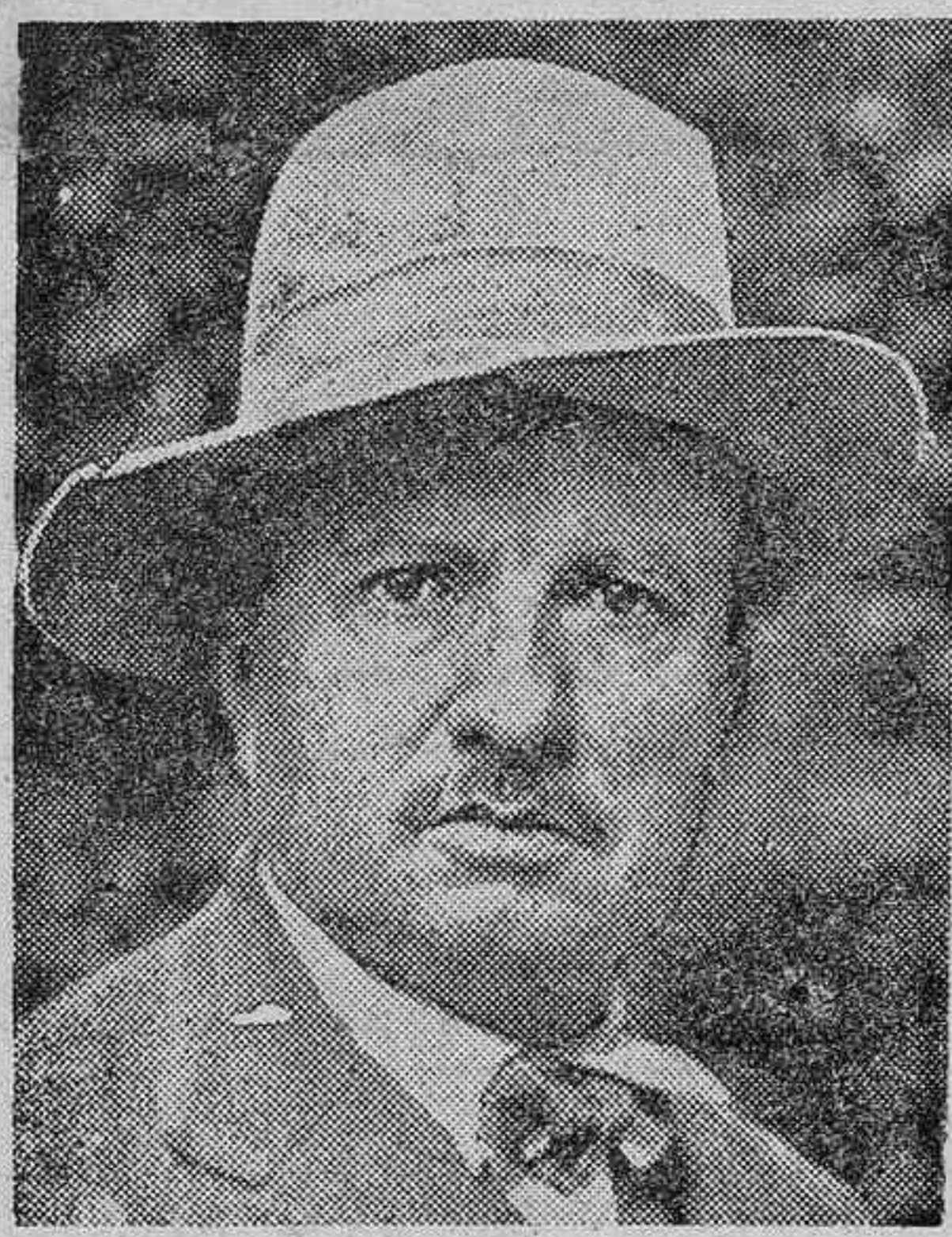
El ministro de Obras Públicas, señor De Monzie, que al recibir ayer a los periodistas se felicitó de que los ferroviarios no hubiesen secundado la huelga general anunciada para ayer, diciendo que los ferrocarriles representan en la vida económica y social la más exacta imagen del orden público.

Se da como seguro que los diputados socialistas se reunirán mañana en la Cámara, para acordar lo conducente, después de su manifiesto.