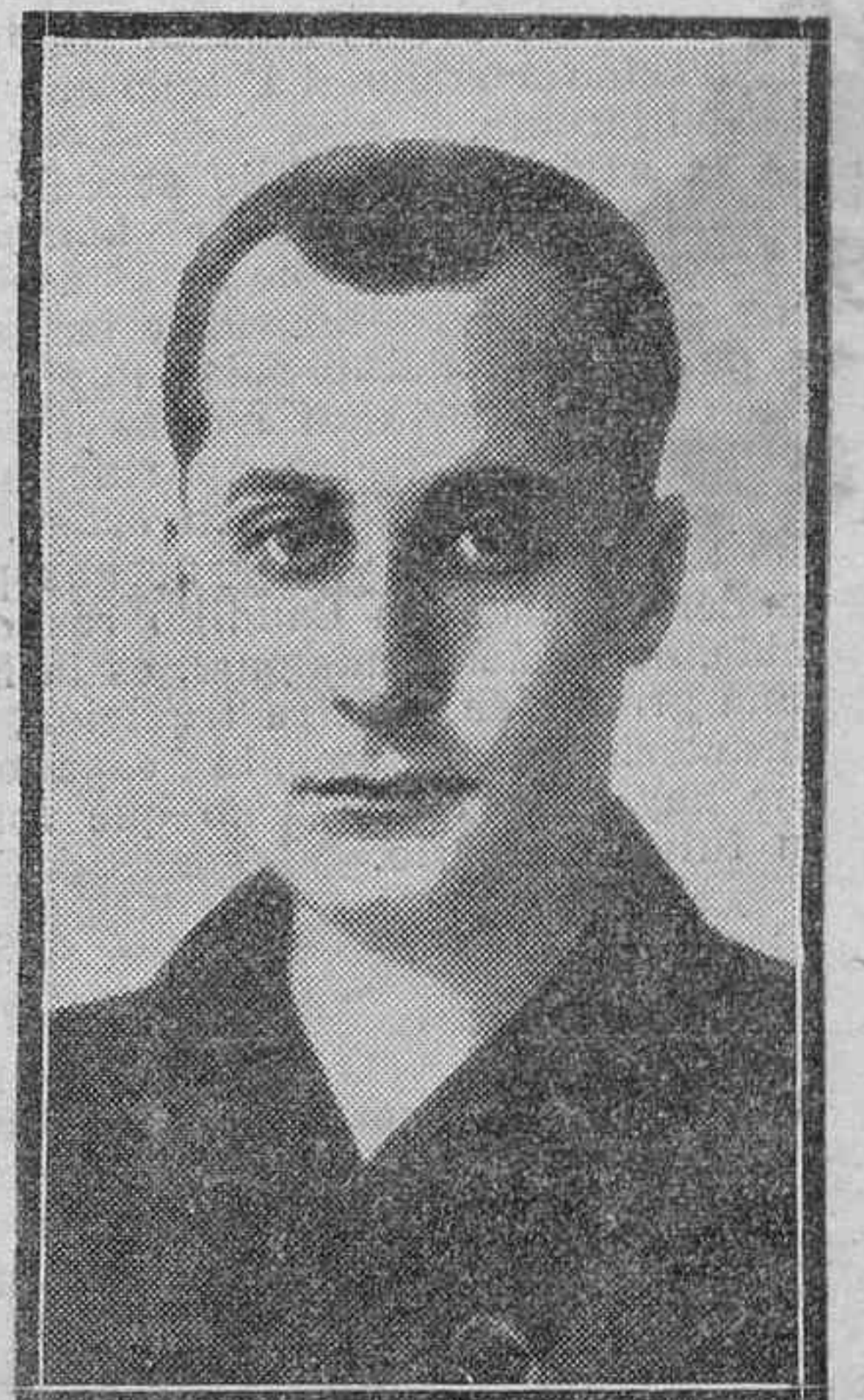
José Antonio Primo de Rivera, precursor de la Revolución Nacional Sindicalista, que hoy se conmemora en toda la España liberada