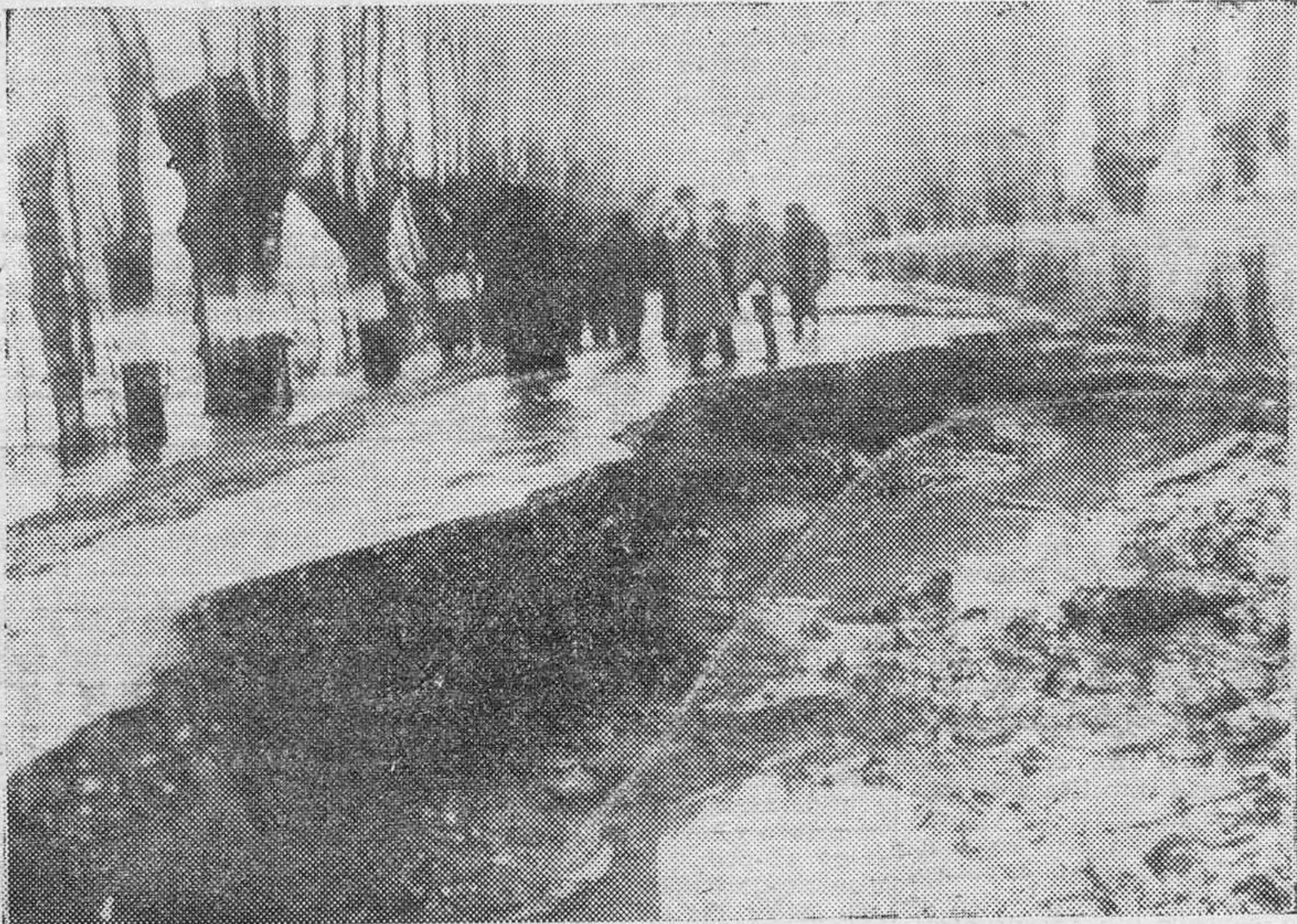
LA CRUDEZA DEL INVIERNO EN EL NORTE DE EUROPA