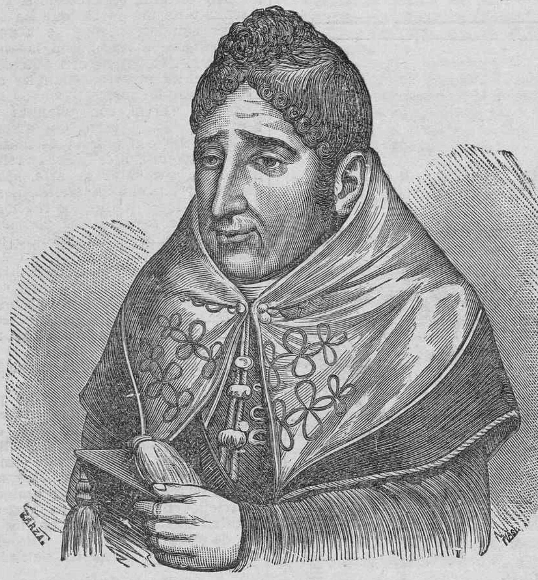
Don Alonso de Nava-Grimón... "Su mayor desvelo, su entrañable amor, fué el árbol: el fomento de la flora canaria."

berbio espectáculo que a un ilustre botánico extranjero hizo recordar los hermosos bosques de las islas del Pacífico.