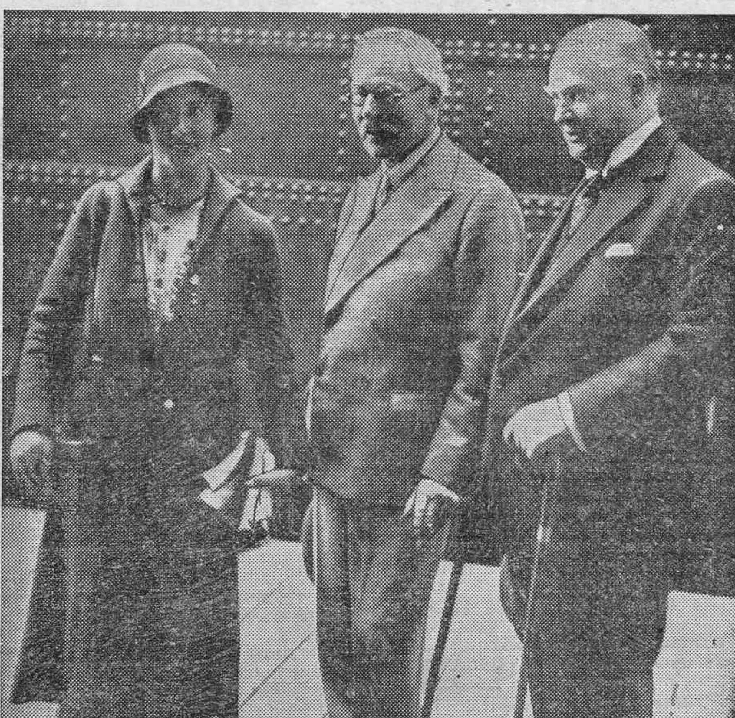
El ex jefe del Gobierno inglés, Ramsay Macdonald, que acompañado de una de sus hijas ha marchado a una República de América del Sur, donde se propone pasar 2 meses en viaje de estudios.

Permanecerá en esta ciudad desde el 16 al 18 del presente mes.