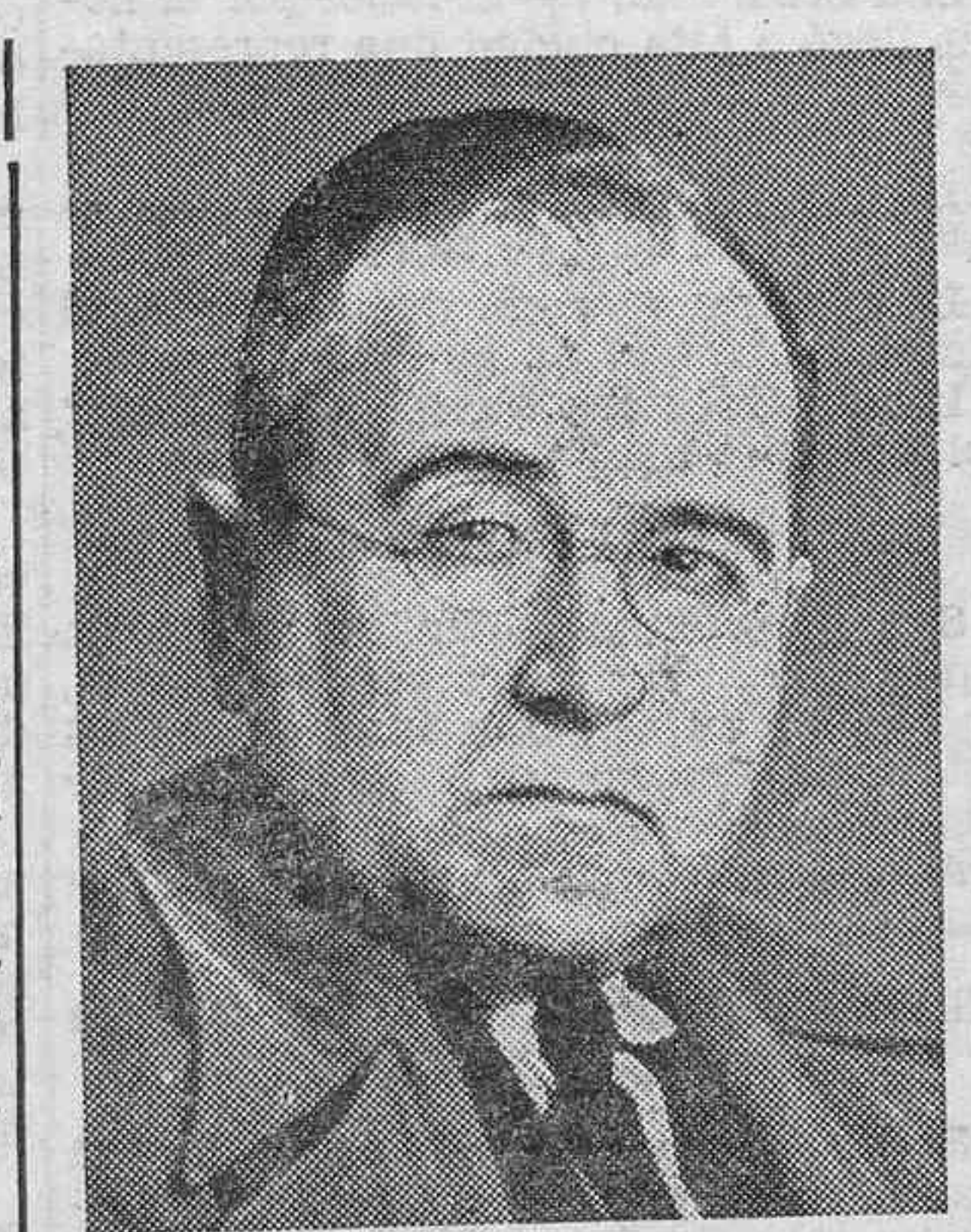
El Presidente de la República del Brasil, Getúlio Vargas, que ha decretado el estado de Guerra en el país, al descubrirse un vasto complot comunista.

Roma, 7.—A las ocho de la noche, el embajador de la Gran Bretaña y el Encargado de Negocios de Francia, visitaron en su despacho al ministro de Relaciones Exteriores de Italia. Pidieron al conde Ciano una respuesta urgente a la nota conjunta de dichos Gobiernos, invitando a Italia a una Conferencia tripartita para tratar del problema español y de la repatriación de los voluntarios extranjeros. En los círculos políticos se declara que el Gobierno de Italia contestará en el transcurso de esta semana. COMERCIANTE INDUSTRIAL DE TENERIFE! Multiplica tus donativos en especies a los Comedores Infantiles de "Auxilio Social" de F. E. T. y de las J. O. N. S. Con ello contribuirás a robustecer la labor de Justicia Social en la España Una, Grande y Libre, que Franco está forjando para tí.