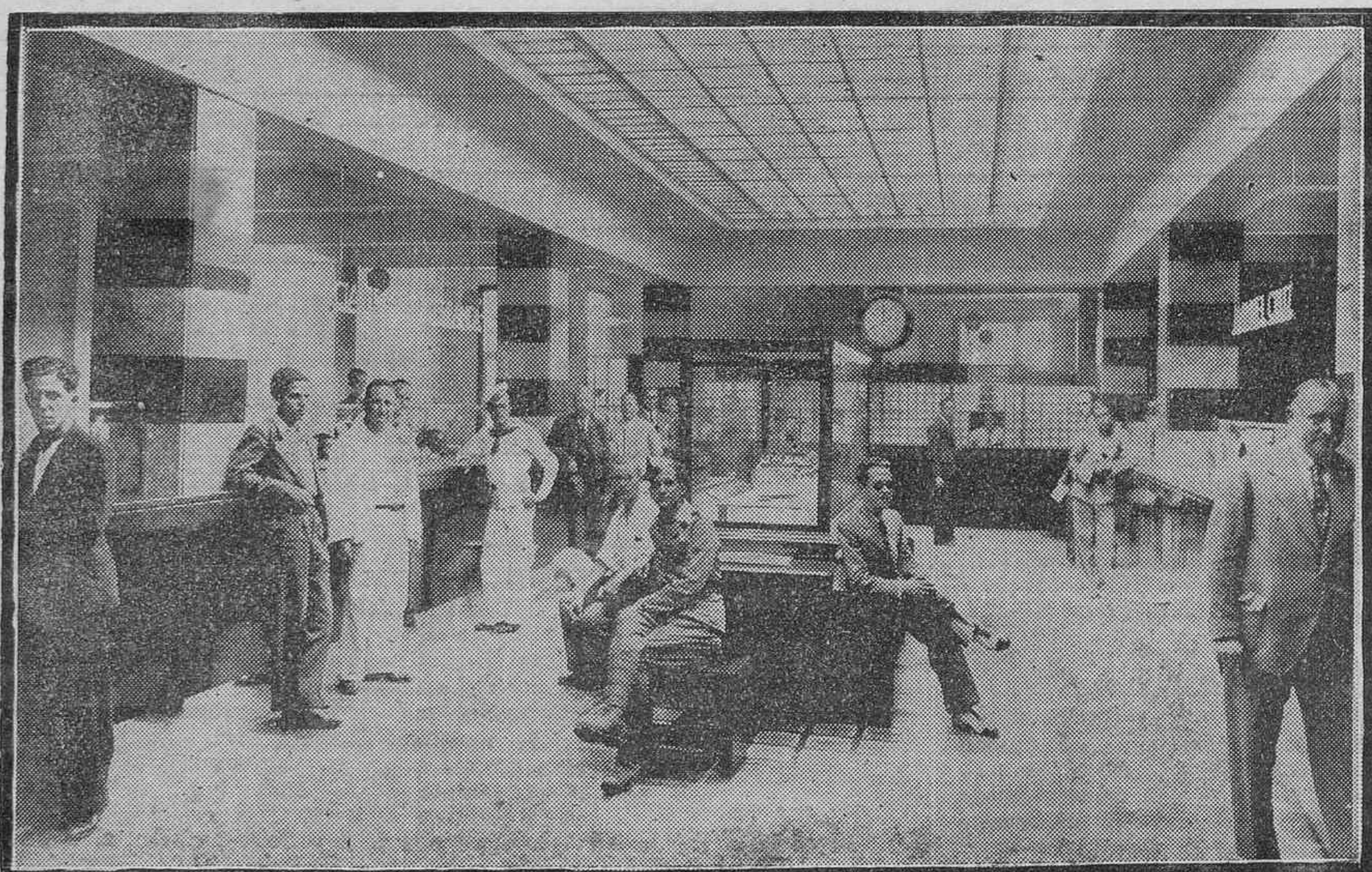
He aquí un aspecto de la moderna instalación de la Casa Manuel Cruz y Compañía Trasmediterránea, en el suntuoso edificio recientemente construido en la calle de la Marina de esta capital, obra del arquitecto señor Marrero Regalado. Por su buen gusto y riqueza, señala la nueva instalación de aquellas importantes oficinas, un claro exponente del desarrollo y perfeccionamiento adquirido en este orden de cosas por las actividades comerciales del país.