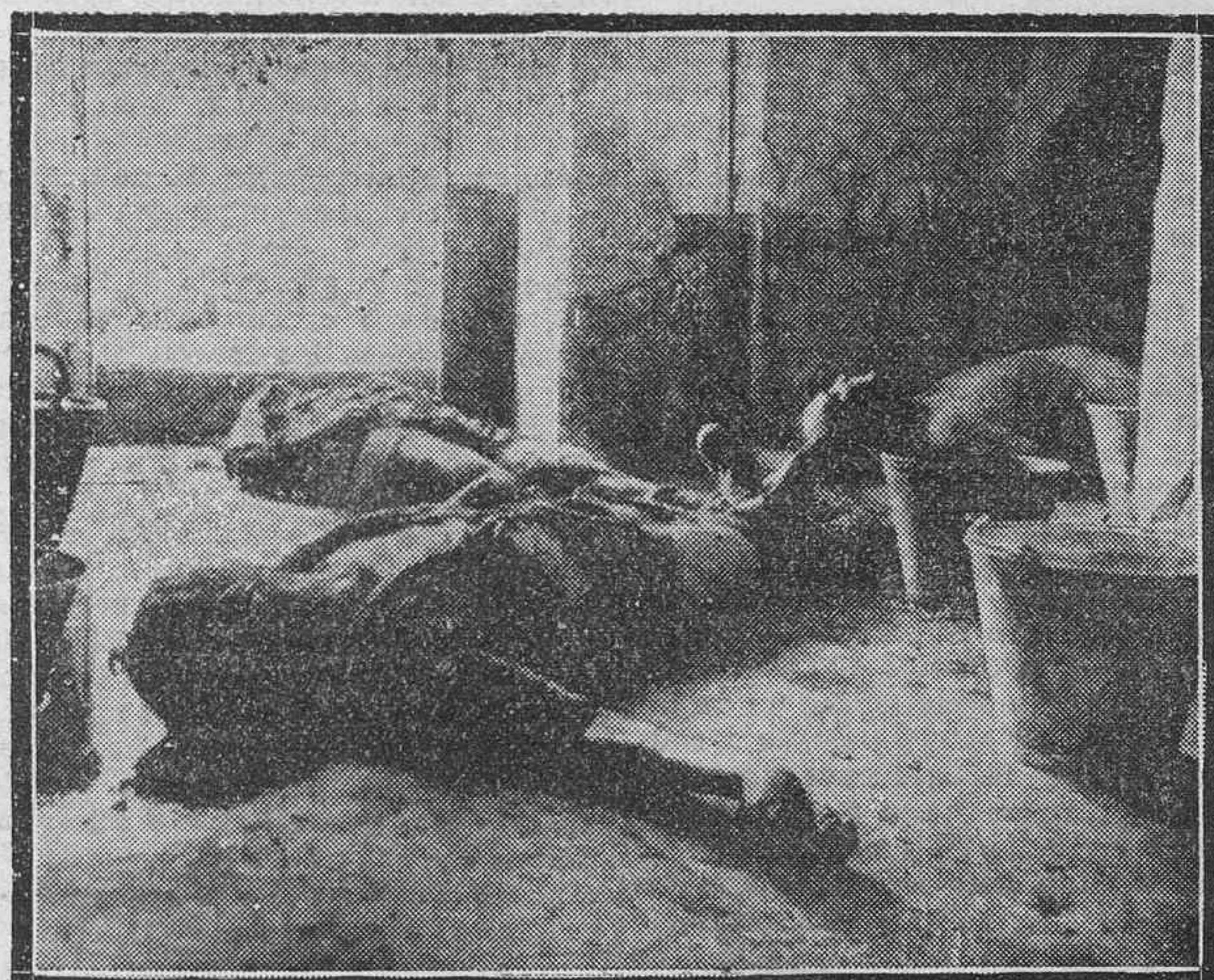
Un rincón de la Cárcel de El Arenal, donde las hordas del llamado "Gobierno de Madrid" quemaron vivas o asesinaron a 23 personas de orden.