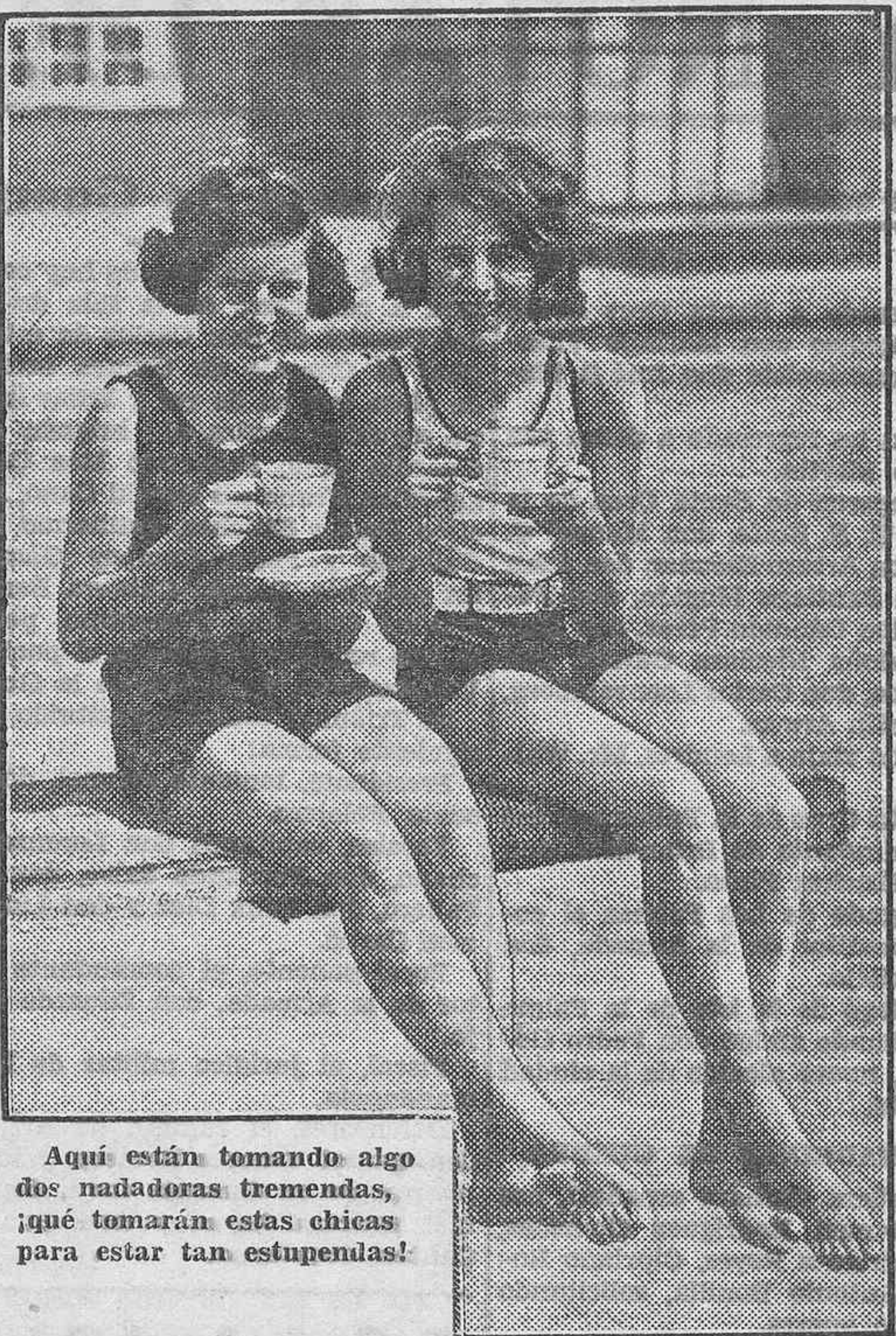
Aquí están tomando algo dos nadadoras tremendas, ¡qué tomarán estas chicas para estar tan estupendas!