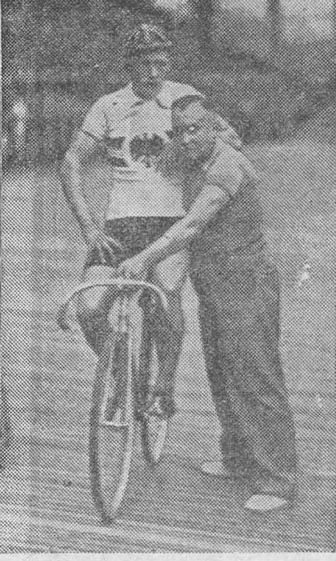
Toni Merkens, campeón mundial de ciclismo amateur, que en las pruebas finales de 1.000 metros en pista, ha obtenido para Alemania la medalla de oro.

Los vencedores del torneo de florete, han sido: 1.—Gaudini (Italia). Medalla de oro. 2.—Gardier (Francia). Id. de plata. 3.—Bocchino (Italia). Id. de bronce.