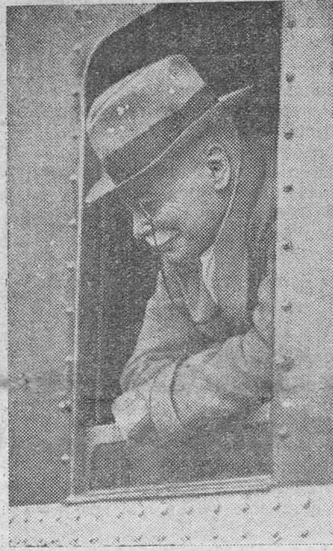
El general von Seeckt, antiguo jefe de la Reichswehr alemana, que se halla en Extremo Oriente haciendo estudios sobre la organización del ejército chino.