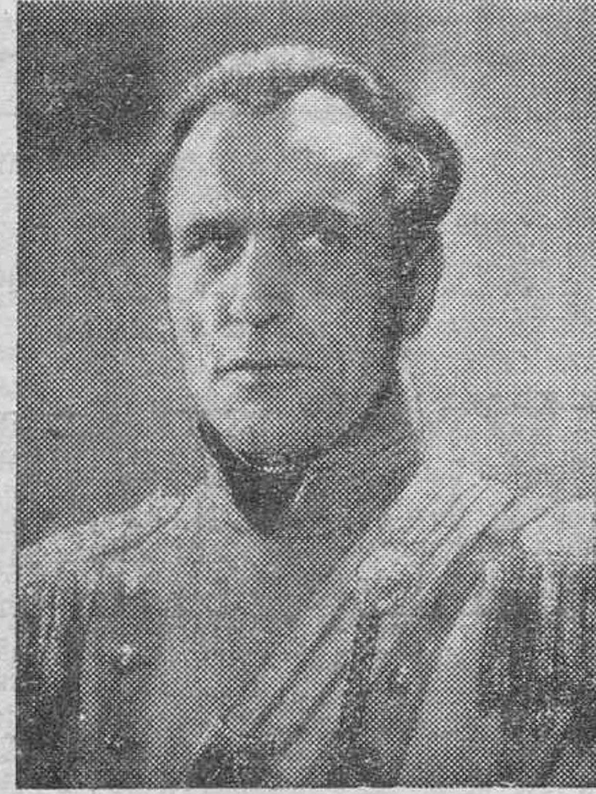
Tuis Freuker que ha adquirido celebridad universal con su film «El Rebelde», inspirado en un episodio de la guerra de independencia del Tírol.