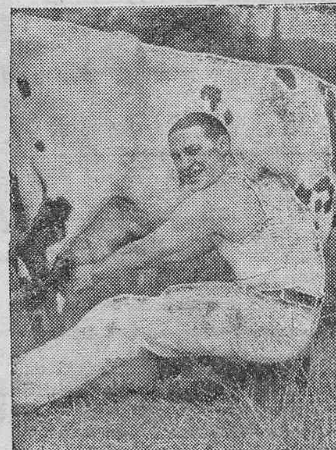
El boxeador americano, Tommy Loughan, que en breve va a contender en La Florida con el campeón mundial, Primo Carnera, sorprendido por un fotógrafo en la granja donde se está entrenando... y alimentando, para el próximo combate, que se aguarda con general ansiedad en el mundo deportivo.