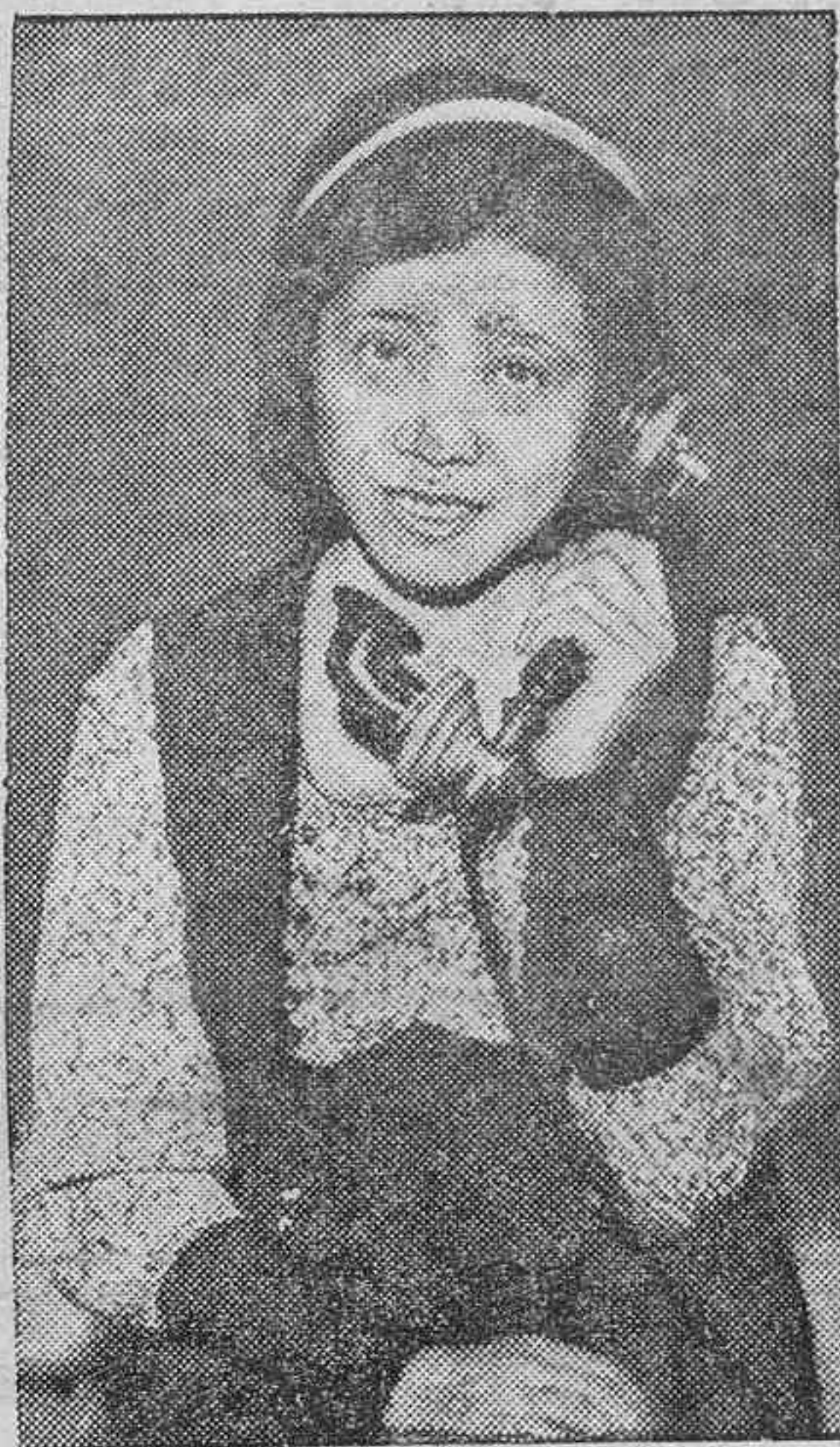
Shiskiru Tokuda, de Shanghai, que ha sido objeto de grandes homenajes en su país por los servicios de espionaje que ha prestado durante la guerra en la Manchuria.

—Personalmente, estamos convencidos, como tantos y tantos electores españoles—números cantan, sobre todo bajo el imperativo del sufragio universal, substancia nutricia de la República—, pero, ¿se convencerán los patrocinadores o prohijantes de la tesis fallida?