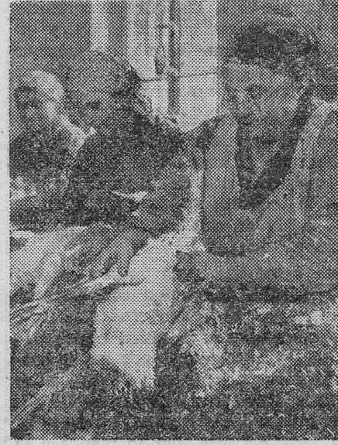
Preparativos para las fiestas de Navidad. Campesinas noruegas desplumando patos