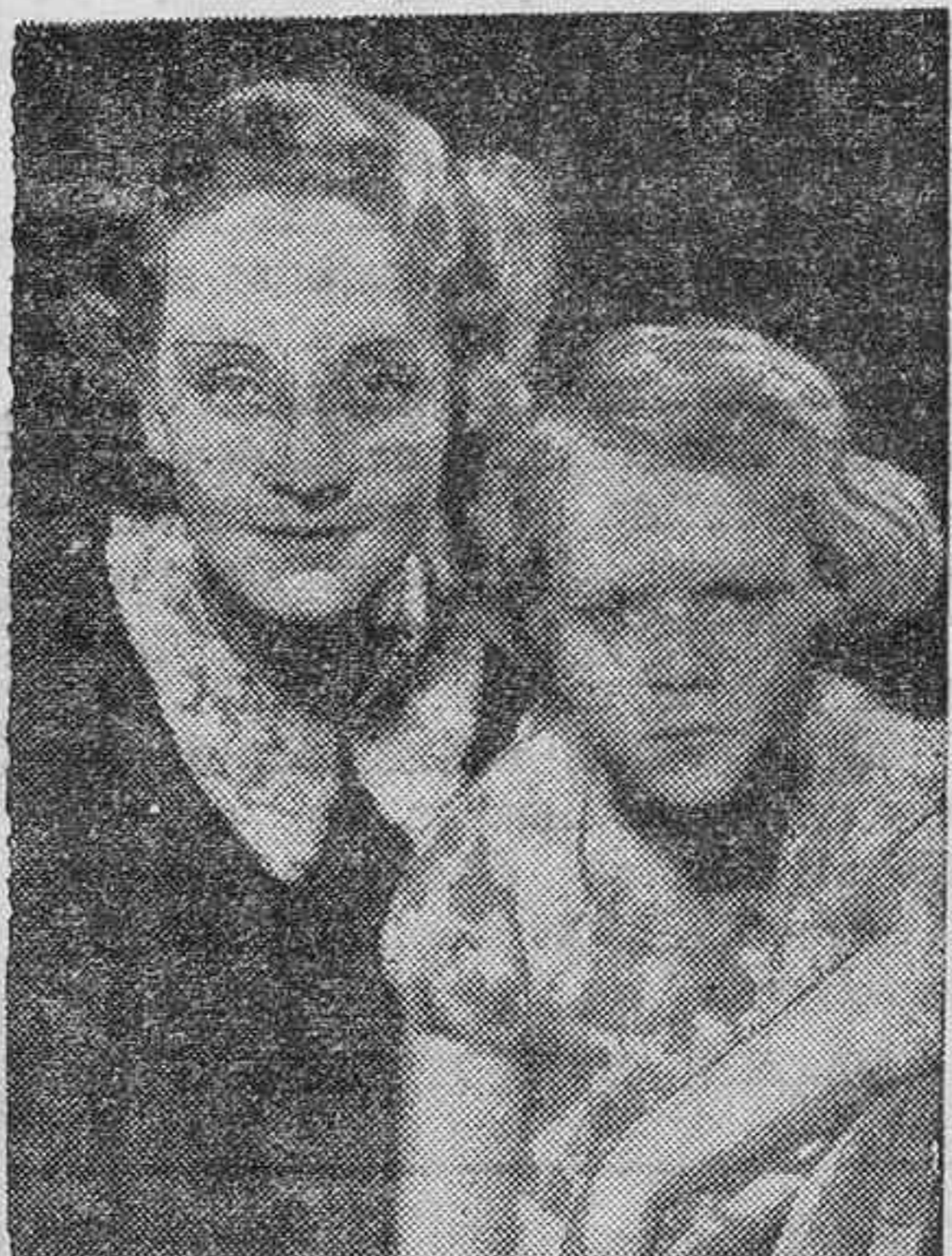
Al encargarse Greta Garbo de interpretar "Cristina de Suecia", Marlene Dietrich pensó sin duda: "Yo no soy menos", y se encargará de representar a la emperatriz Catalina de Rusia en una pizante opereta que se titula "El ejército de amantes de Su Majestad" Rivalidades monárquicas.