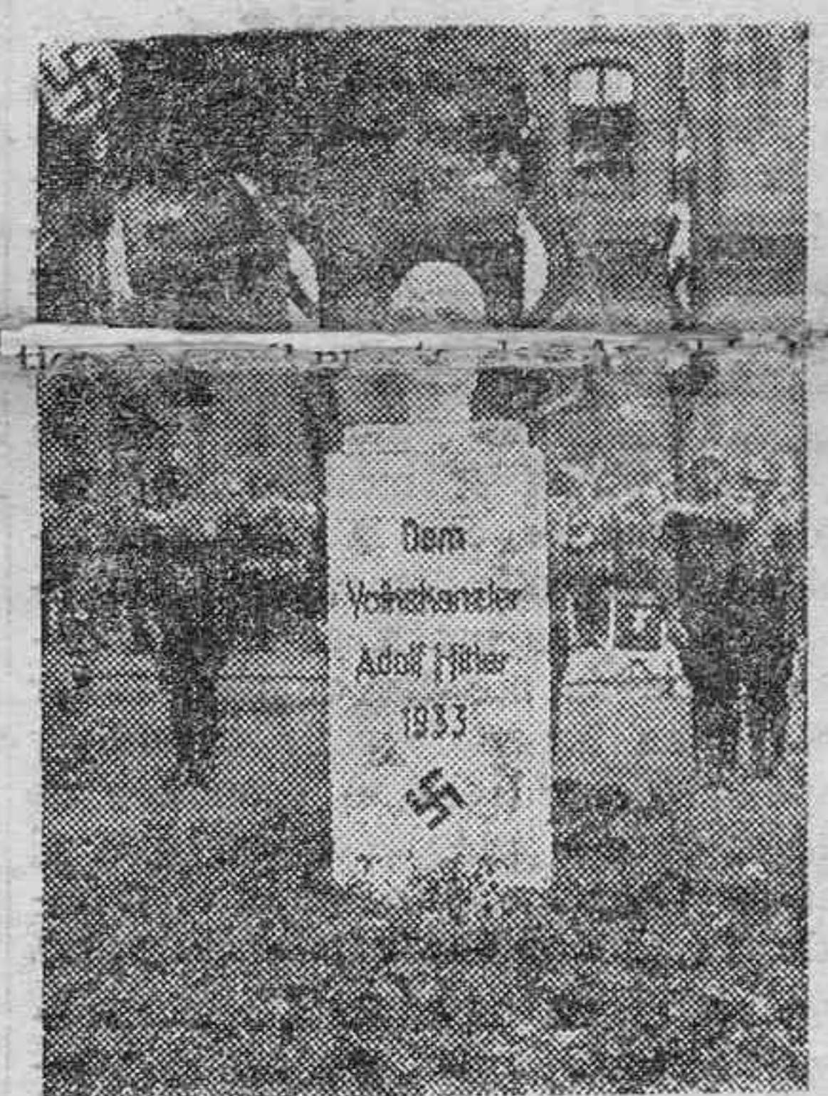
Hitler no quiere que se le erijan estatuas ni monumentos en vida. En este sentido acaba de publicar un decreto. He aquí uno de los monumentos que serán demolidos en virtud de esa orden.