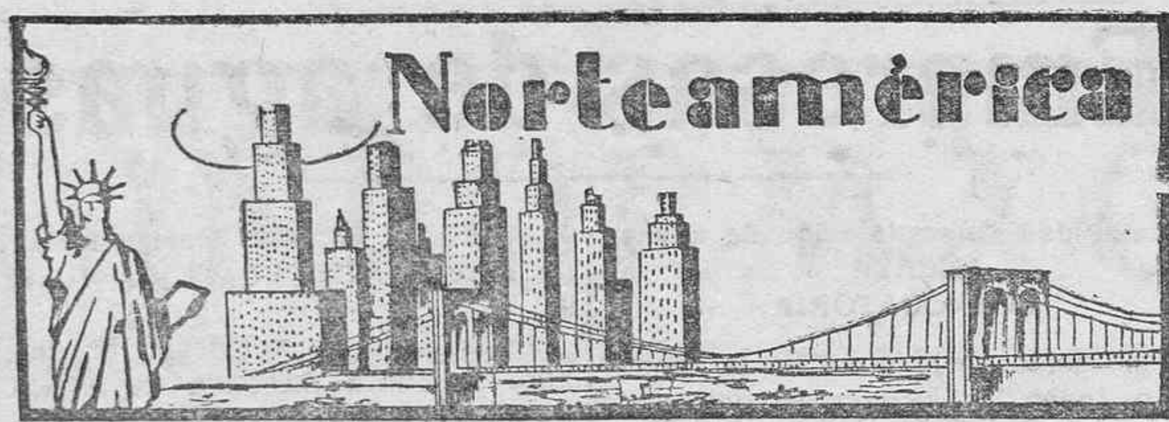
Encanto y desencanto de un pueblo

Cuando Hoover asumió el poder en 1929, su campaña presidencial se resumía en esta frase popular: "Una gallina en cada cazuela". Cuando terminó su etapa presidencial, en 1933, al pueblo norteamericano no le quedaba ni la cazuela. ¿Para qué la quería, si dentro de ella no podía guisar, no digo gallina, ni patatas siquiera?