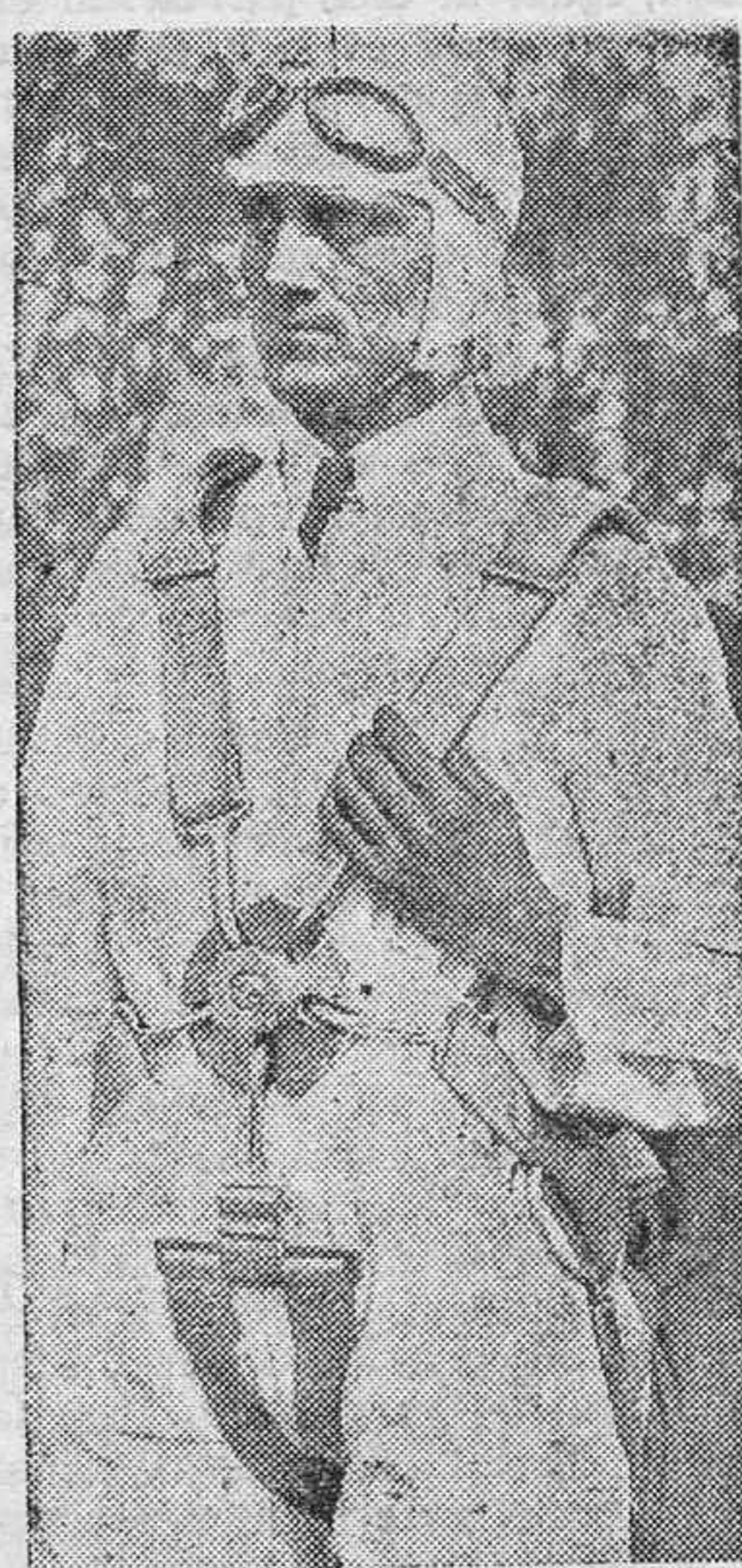
El corredor inglés, Malcolm Campbell, que según las noticias recibidas de Londres, va a cubrir otro record para alcanzar la velocidad de 300 millas por hora (481'902 kilómetros).