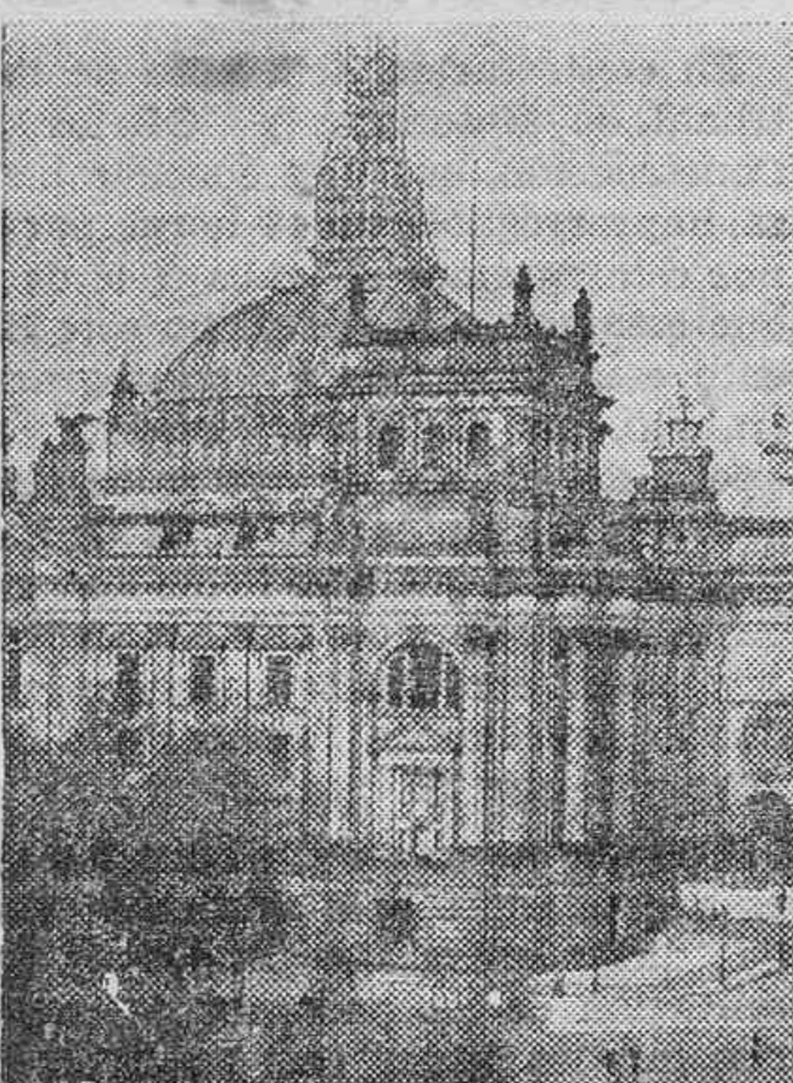
EL REICHSTAG EN REPARACION.—Mientras el ruidoso proceso del incendio del Reichstag, contin- ua celebrándose en Leipzig, los obreros trabajan en reparar los da- ños producidos en el hermoso edifi- cio, cuya cúpula aparece rodeada de un andamiaje.