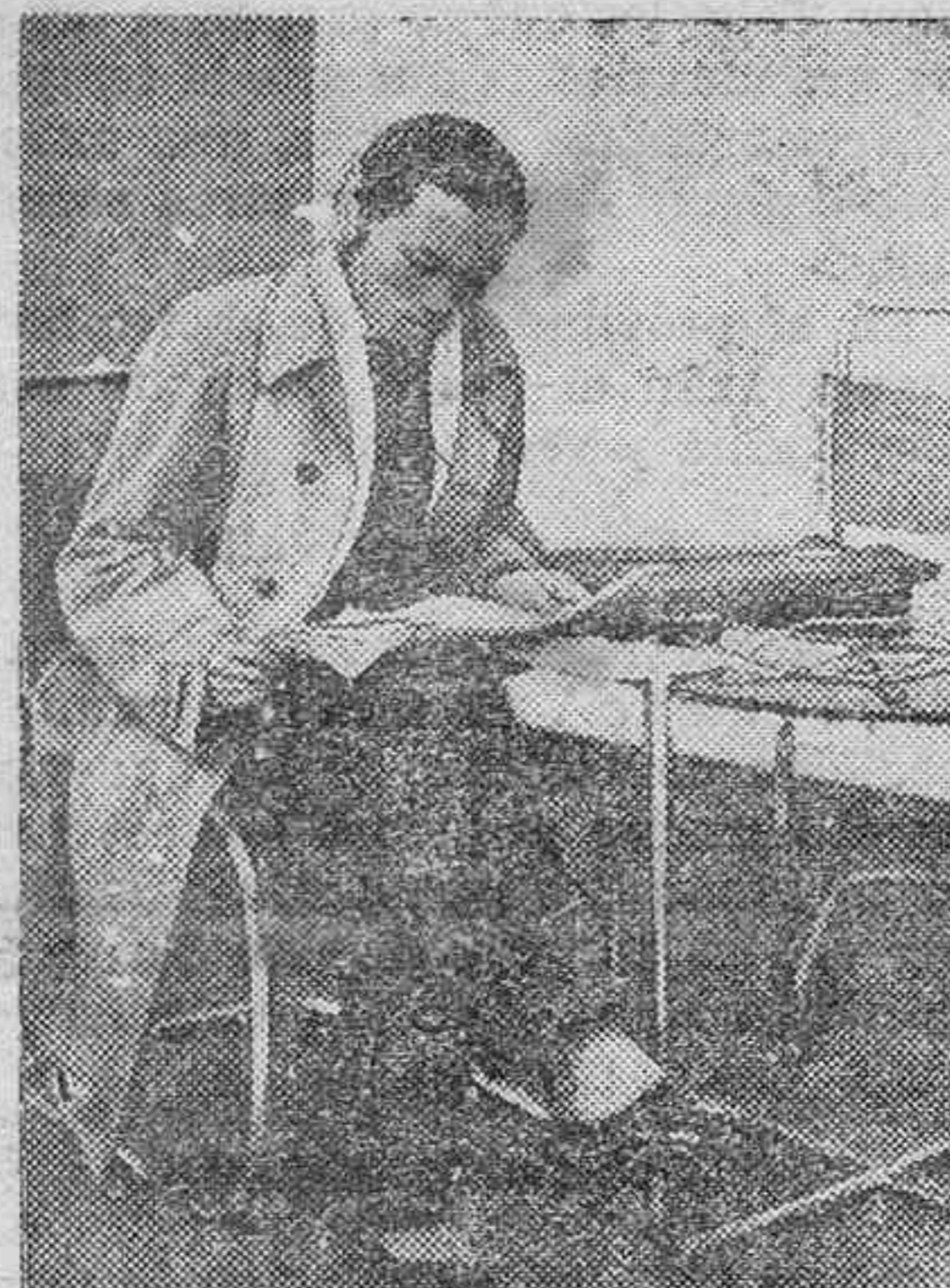
LA RADIO DE BOLSILLO.— La So- ciedad de Naciones ha hecho insta- lar pequeños aparatos de radio, lla- mados de bolsillo, que permiten a los delegados seguir el curso de las sesiones mientras se dedican a la lectura de periódicos en los pasillos.