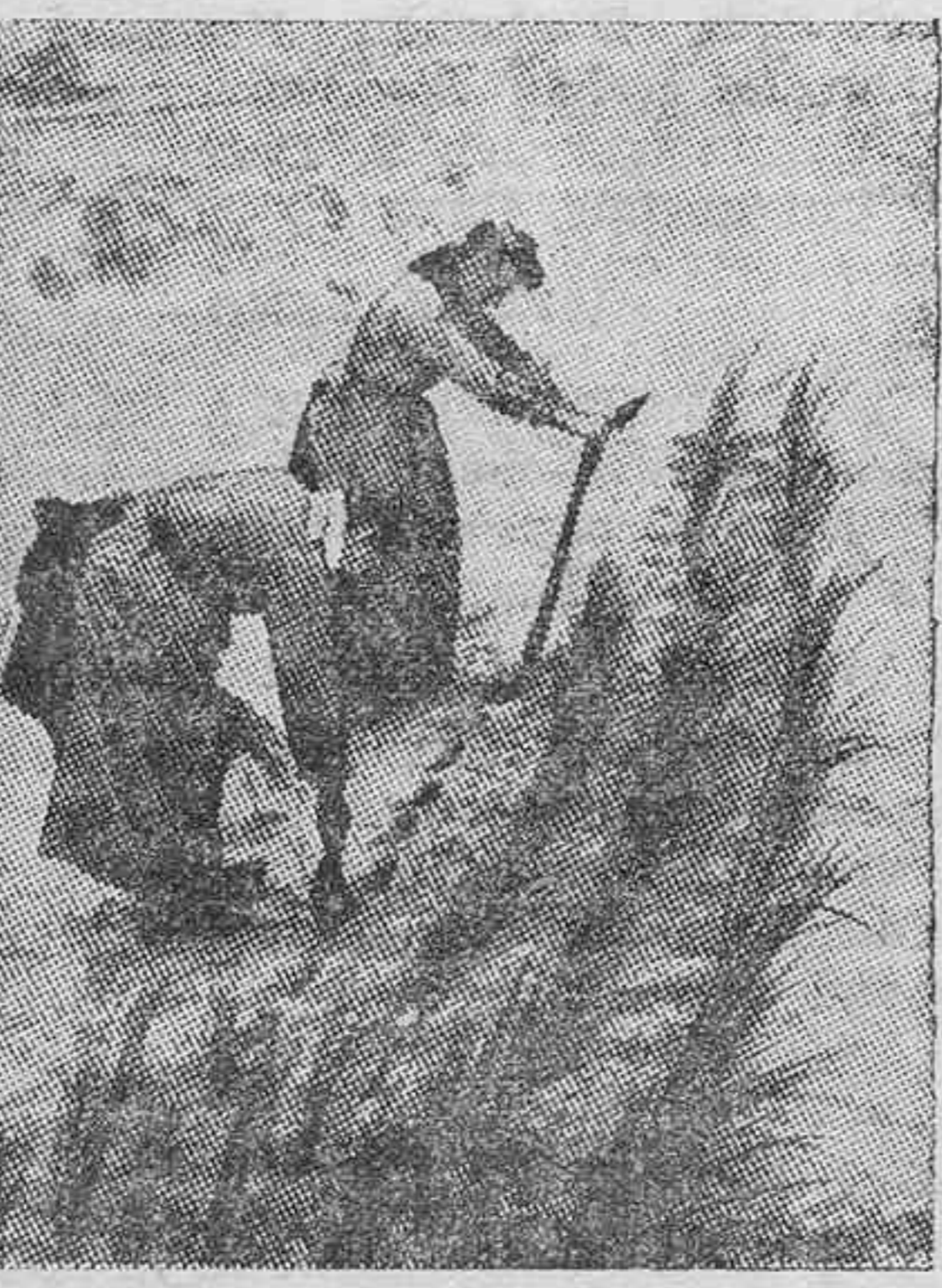
En muchas playas de Europa se es- tán adoptando medidas de protec- ción, por hallarse amenazadas de desaparecer a causa de los constan- tes movimientos de arena. He aquí a unas mujeres haciendo plantacio- nes, en una playa, de yerbas orde- nadas para sostener las arenas.