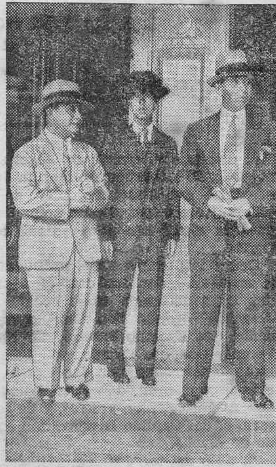
HUESPEDES CHINOS.—El famoso general de la China del Norte, Chang-Huei-Liang (a la izquier- da) en sus días libres, que se ha- ce de tanto en tanto en Londres, donde es objeto de grandes agas- ajos, tanto por sus paisanos, como por el elemento oficial.