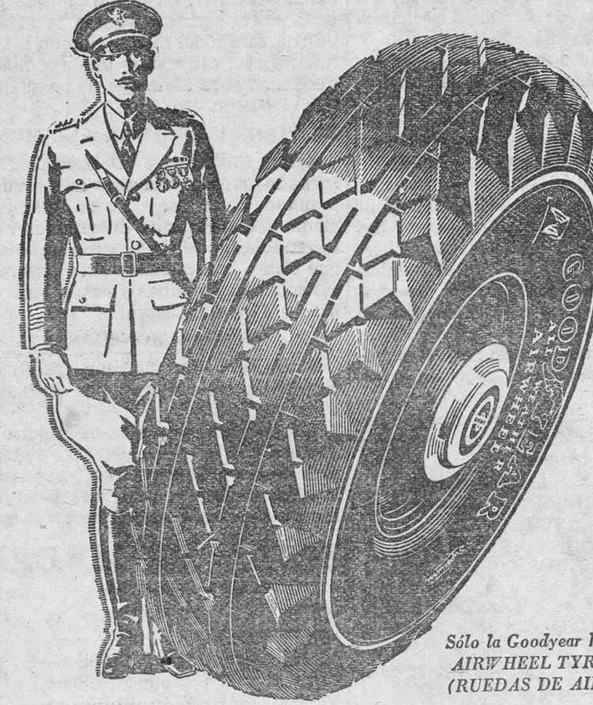
Sólo la Goodyear hace AIRWHEEL TYRES (RUEDAS DE AIRE)

UN BRIGADIER, escribiendo de Gezira, Egipto, acerca del funcionamiento de las RUEDAS DE AIRE en un viaje de casi 2.000 kilómetros, dice: