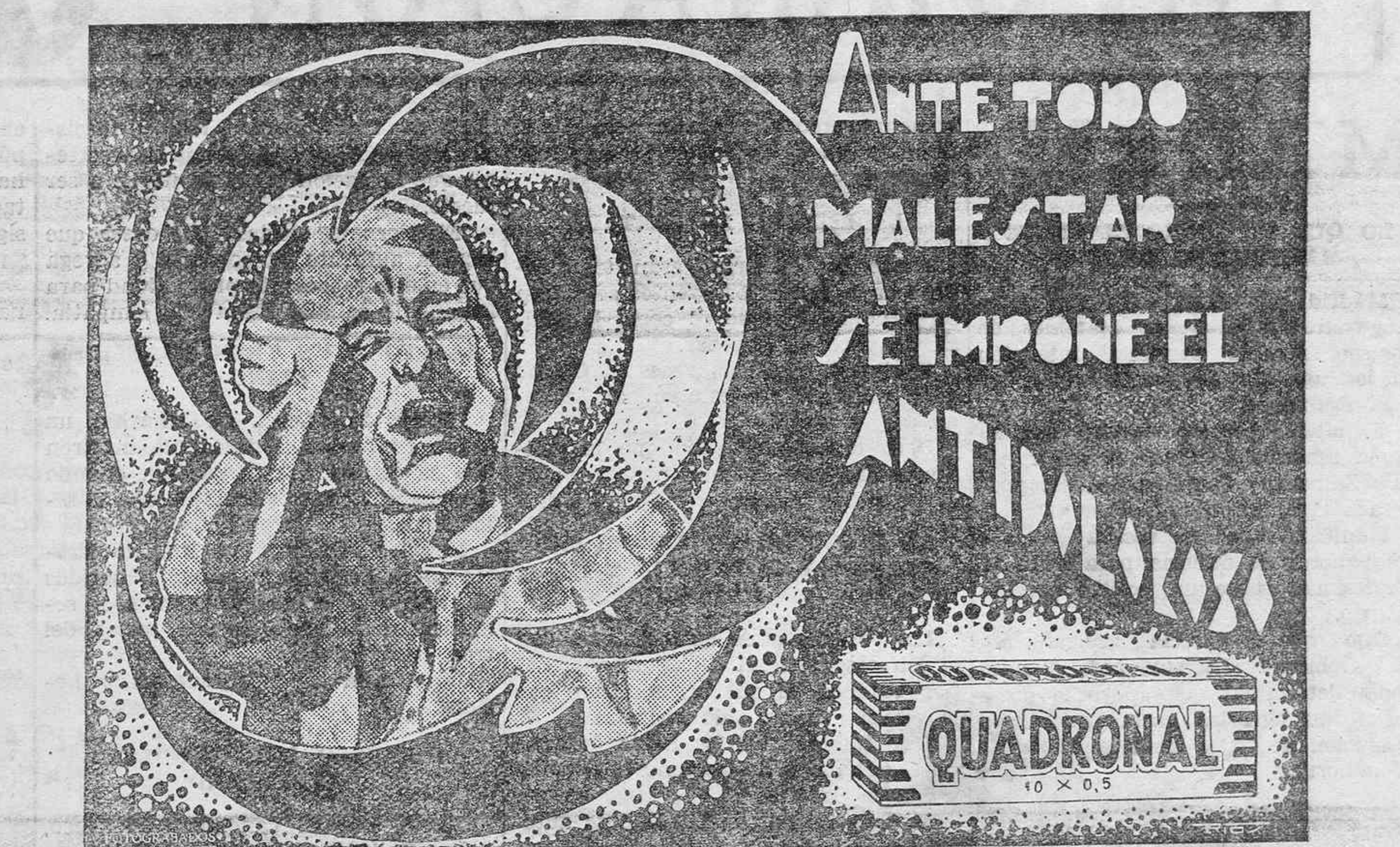
DIBUJO DE DON TEODORO RIOS