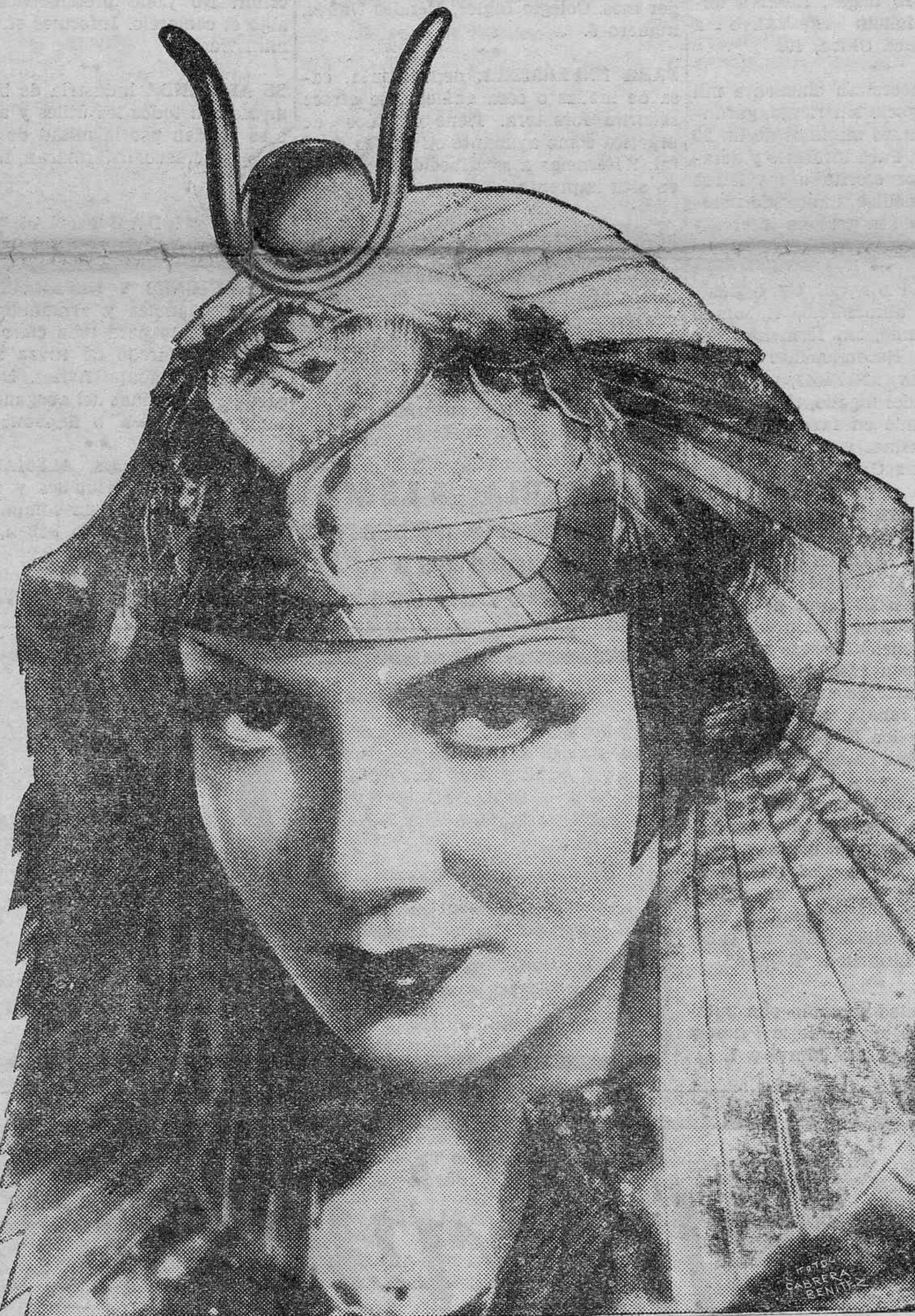
Claudette Colbert, protagonista de la magna película "Cleopatra", que se estrenará mañana en el Cine Numancia.