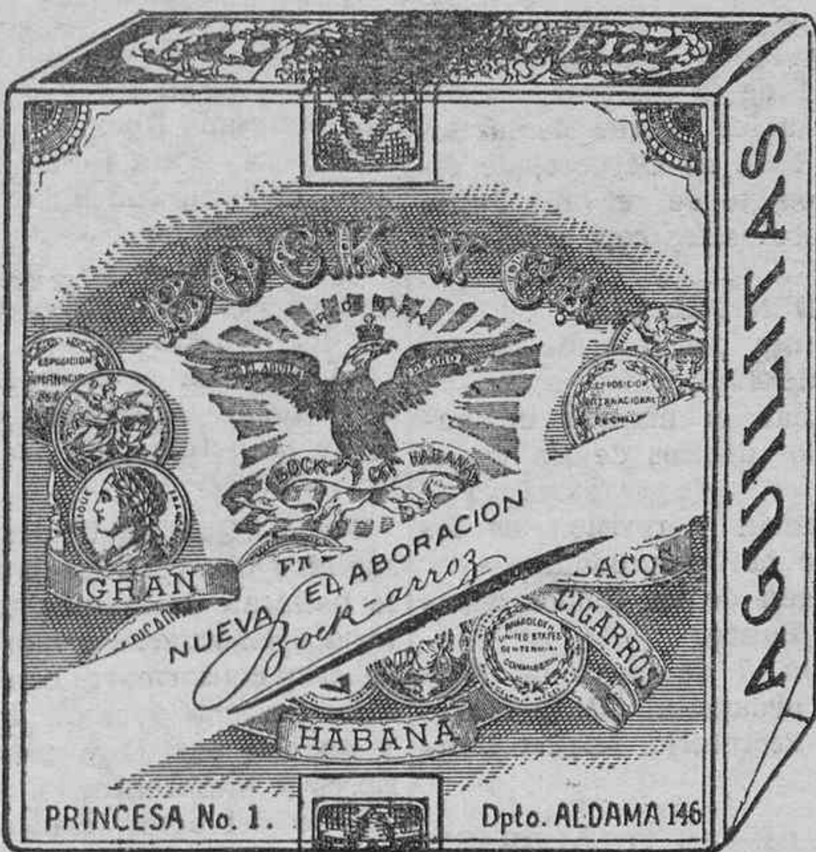
ELABORADO CON LAS MEJORES RAMAS DE CUBA