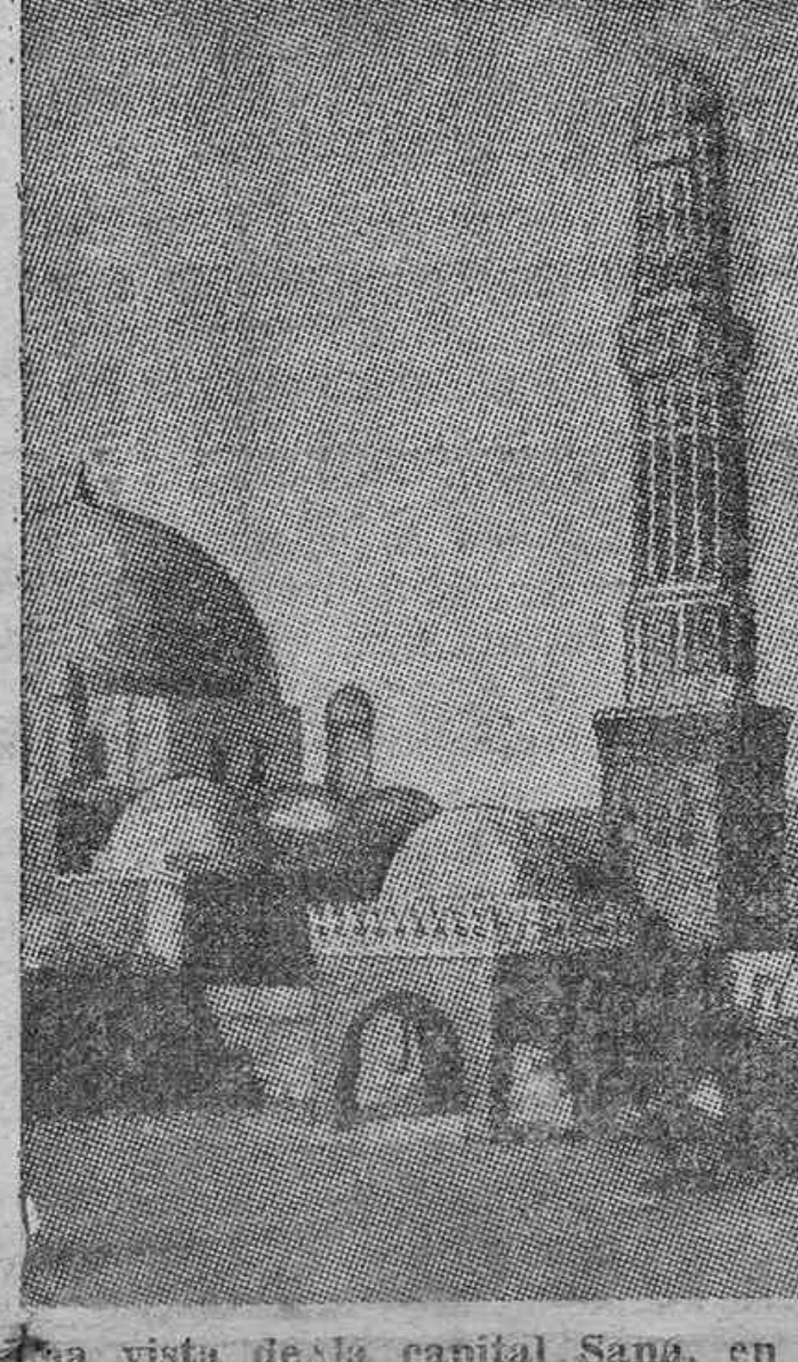
Una vista de la capital Sana, en Kenen, centro de operaciones del Ejército árabe que dirige Ibn Saud, el nuevo candidato.