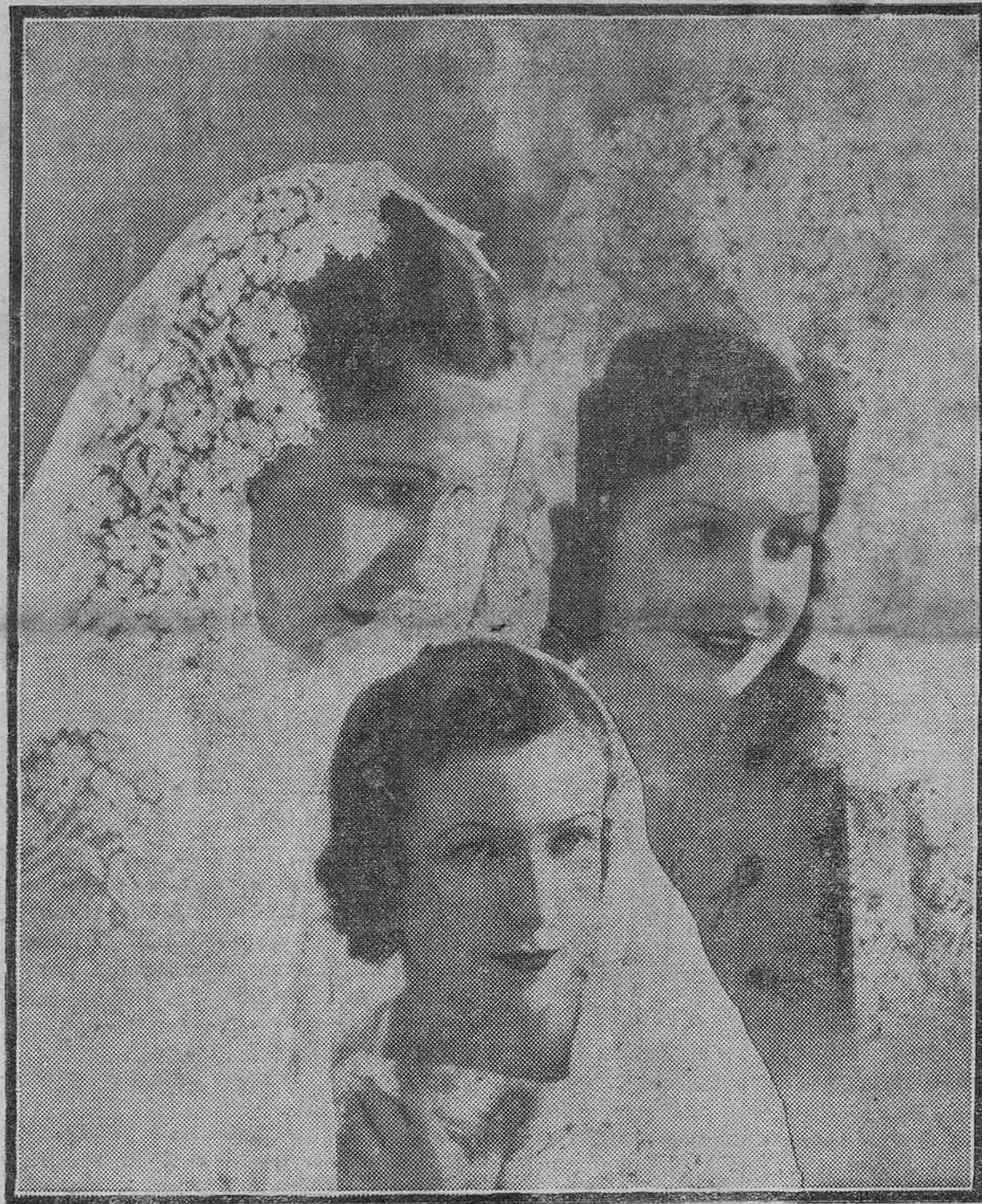
PRESENCIANDO LA CORRIDA.