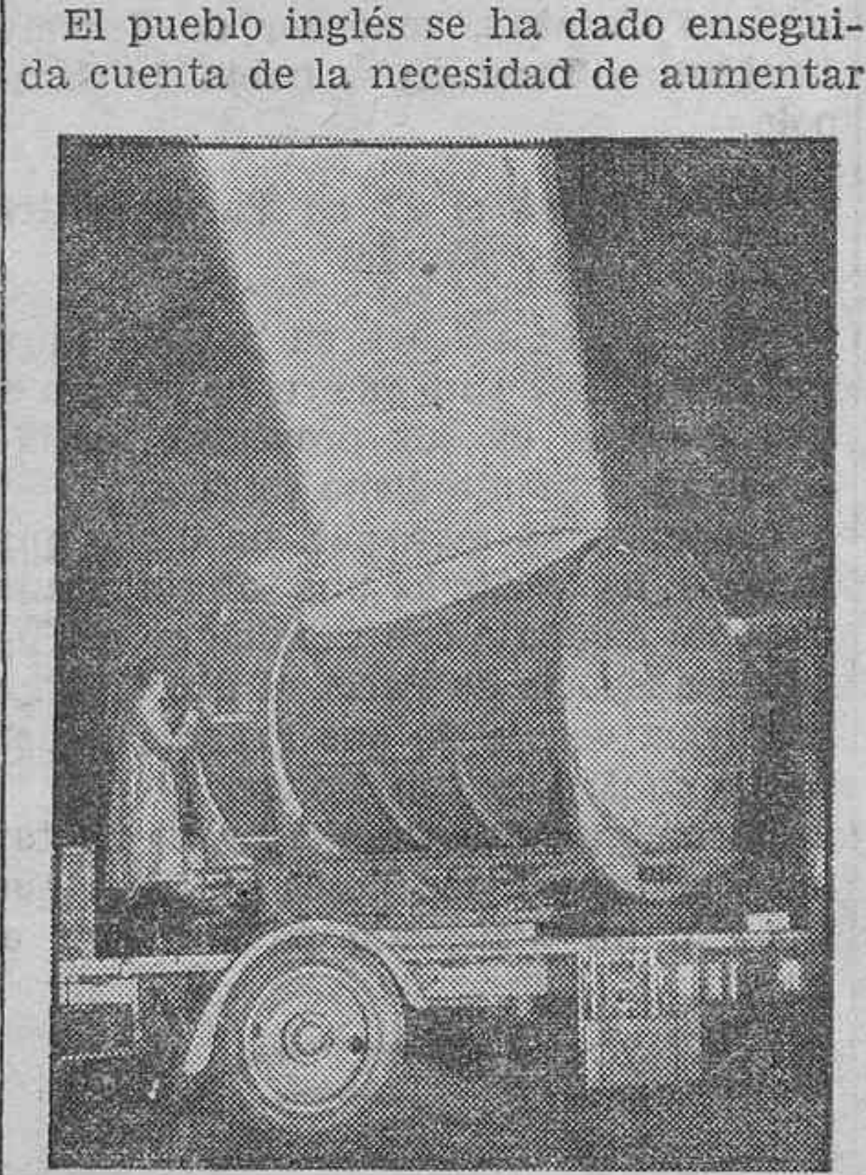
Proyector gigantesco inventado por un ingeniero inglés para explorar las regiones aéreas.

El pueblo inglés se ha dado enseguida cuenta de la necesidad de aumentar su aviación. No cabe duda, según dicen los observadores imparciales, que el desarrollo de la aviación de la Alemania nazi ha contribuido a dirigir la atención del pueblo inglés hacia la necesidad de que se desarrolle también intensamente la propia aviación nacional.