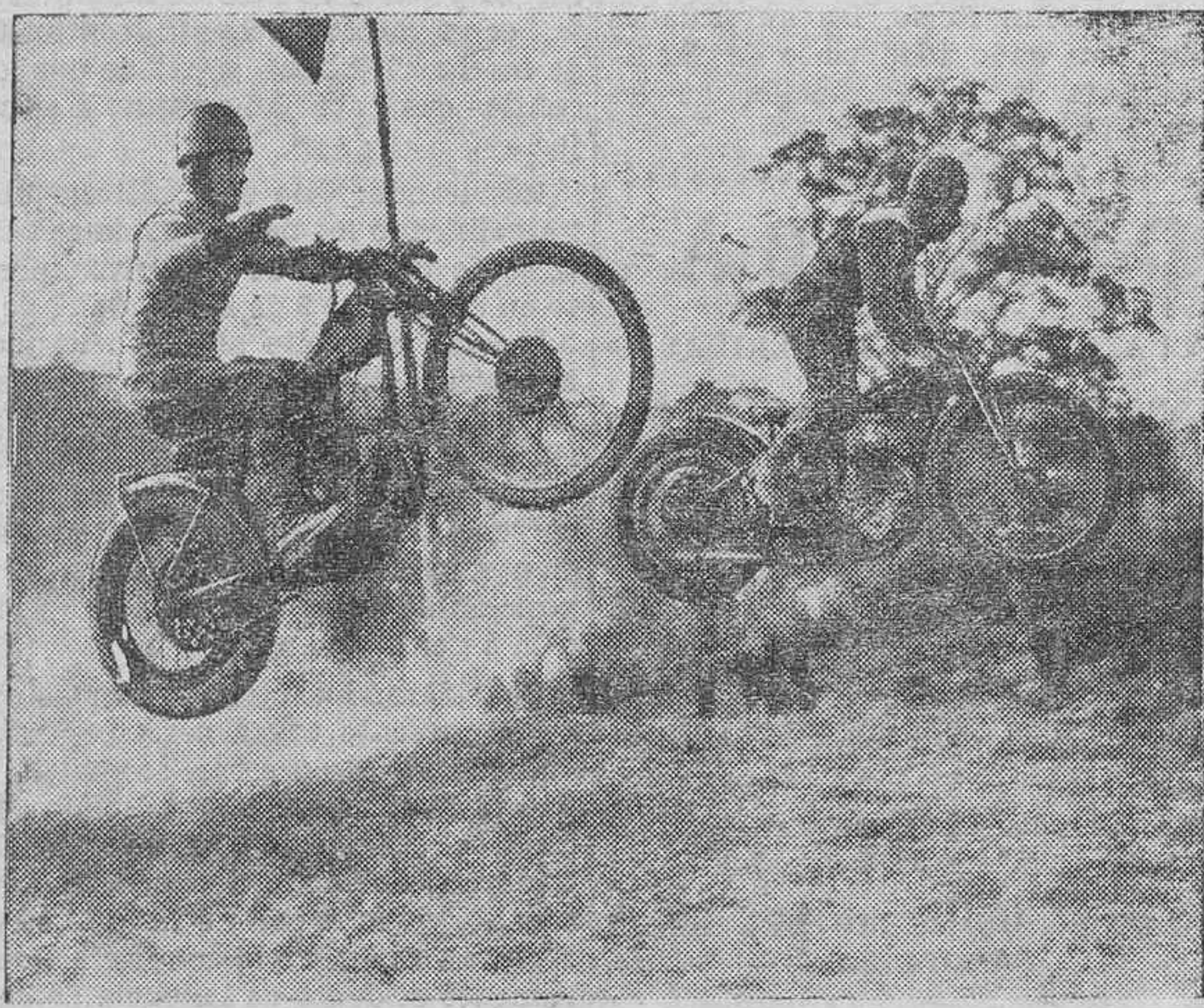
Detalle de una carrera de "motos" celebrada en Londres, deporte que apasiona a la afición inglesa.

MEDICO CIRUJANO Consultas, de 9 a 12. Teléfono, 1212. Bethencourt Alfonso, 24 Santa Cruz de Tenerife