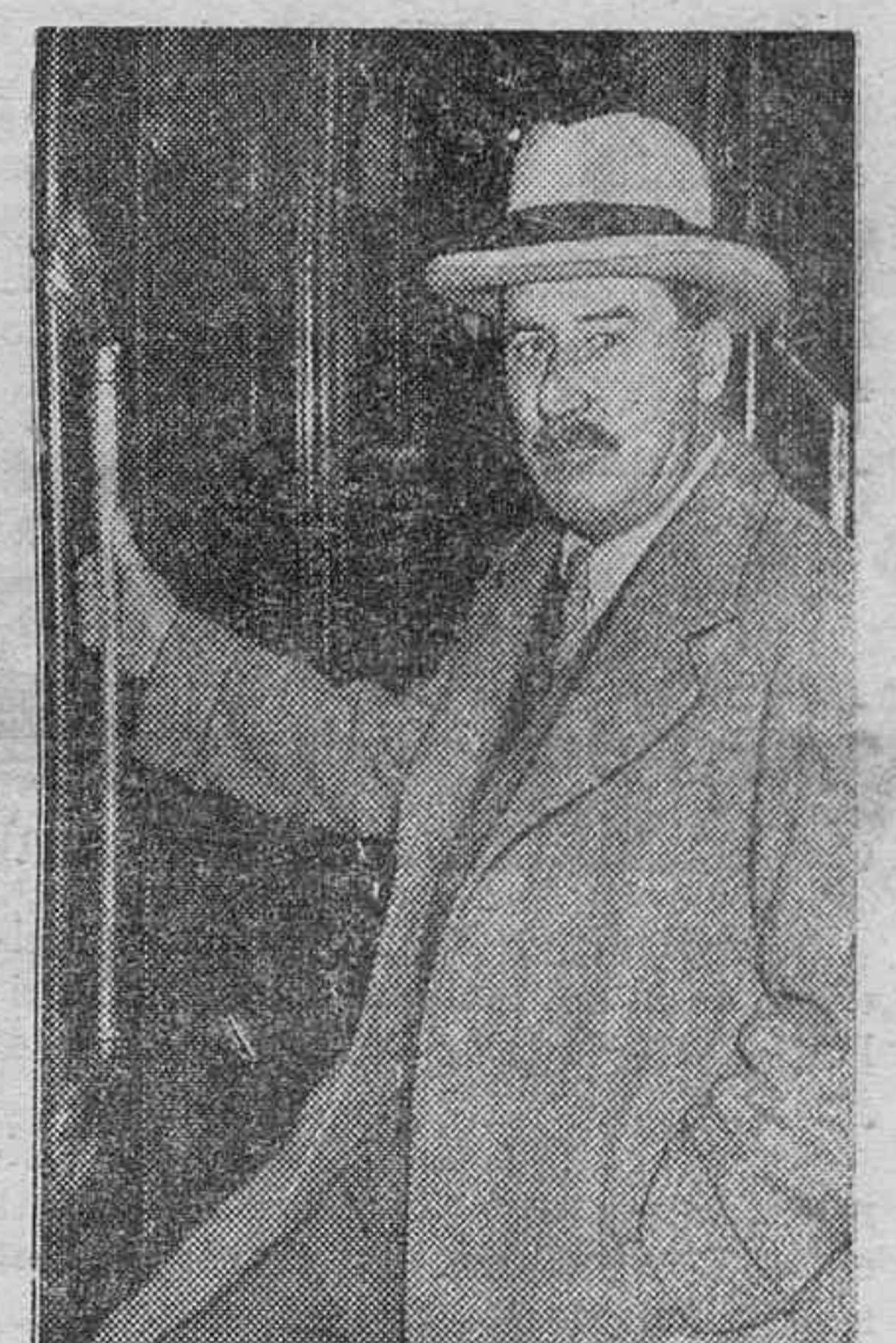
El comandante Ciano, ministro de Propaganda de Italia y esposo de la hija del señor Mussolini, que acaba de recibir el título de aviador, durante su primer viaje de prueba.—La actriz austriaca, Paula Wessely, protagonista de la nueva película de Willy Forst, que acaba de obtener la medalla de oro en la Olimpiada de Venecia.—El doctor Howard Carter, célebre egiptólogo inglés, que en unión de lord Carnarvon descubrió la tumba de Tutankamen, en el Valle de los Reyes, alrededores de Tebas, que de nuevo va a tomar parte en una expedición científica encargada de buscar la tumba de la reina de Tutankamen.