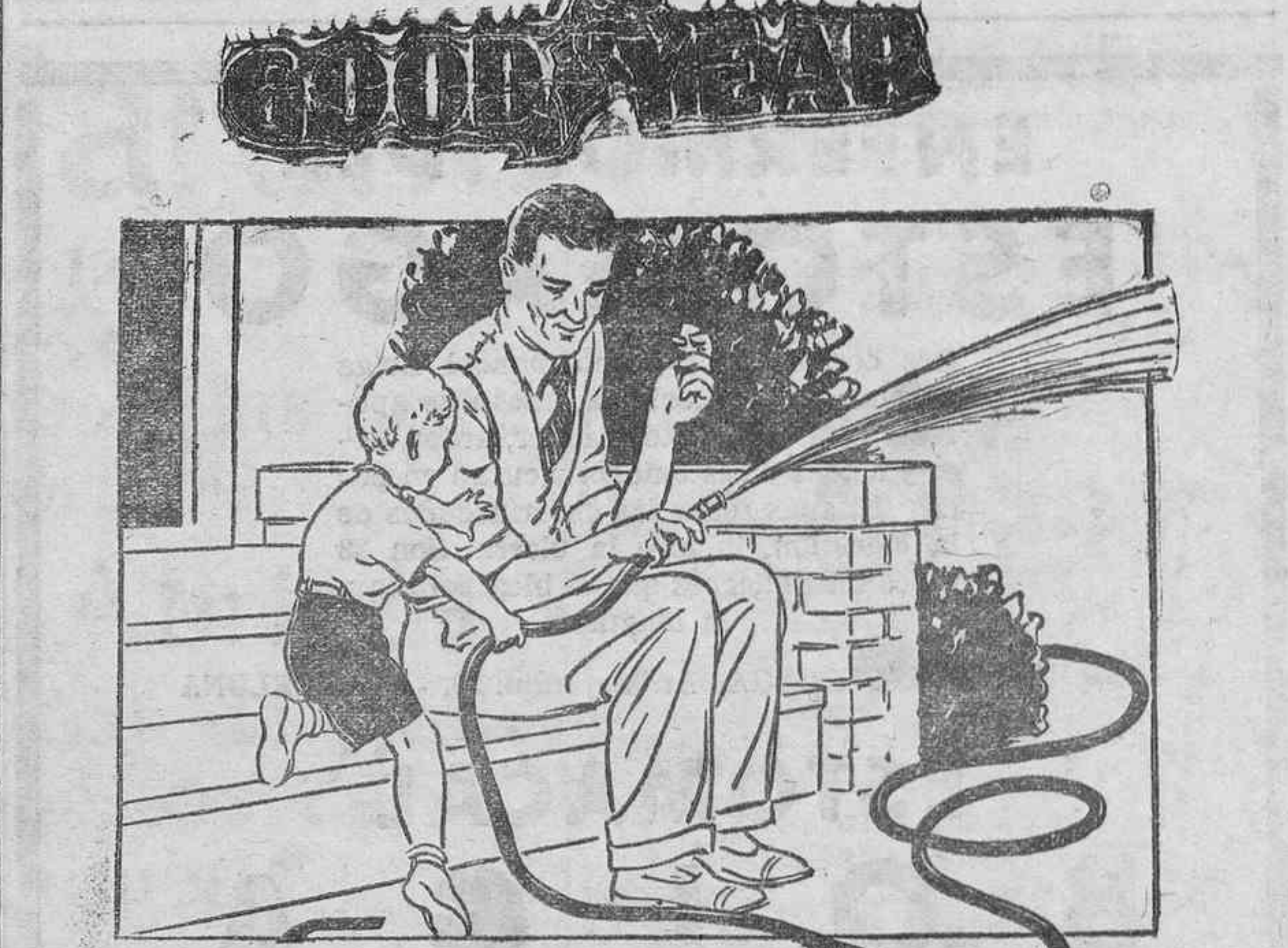
Se acaban de recibir de esta acreditada marca, de media y tres cuartos de pulgada, desde 2/50 a 5 pesetas metro. ALBERTO CAMACHO.—Doctor Comenge, 11.—Santa Cruz de Tenerife