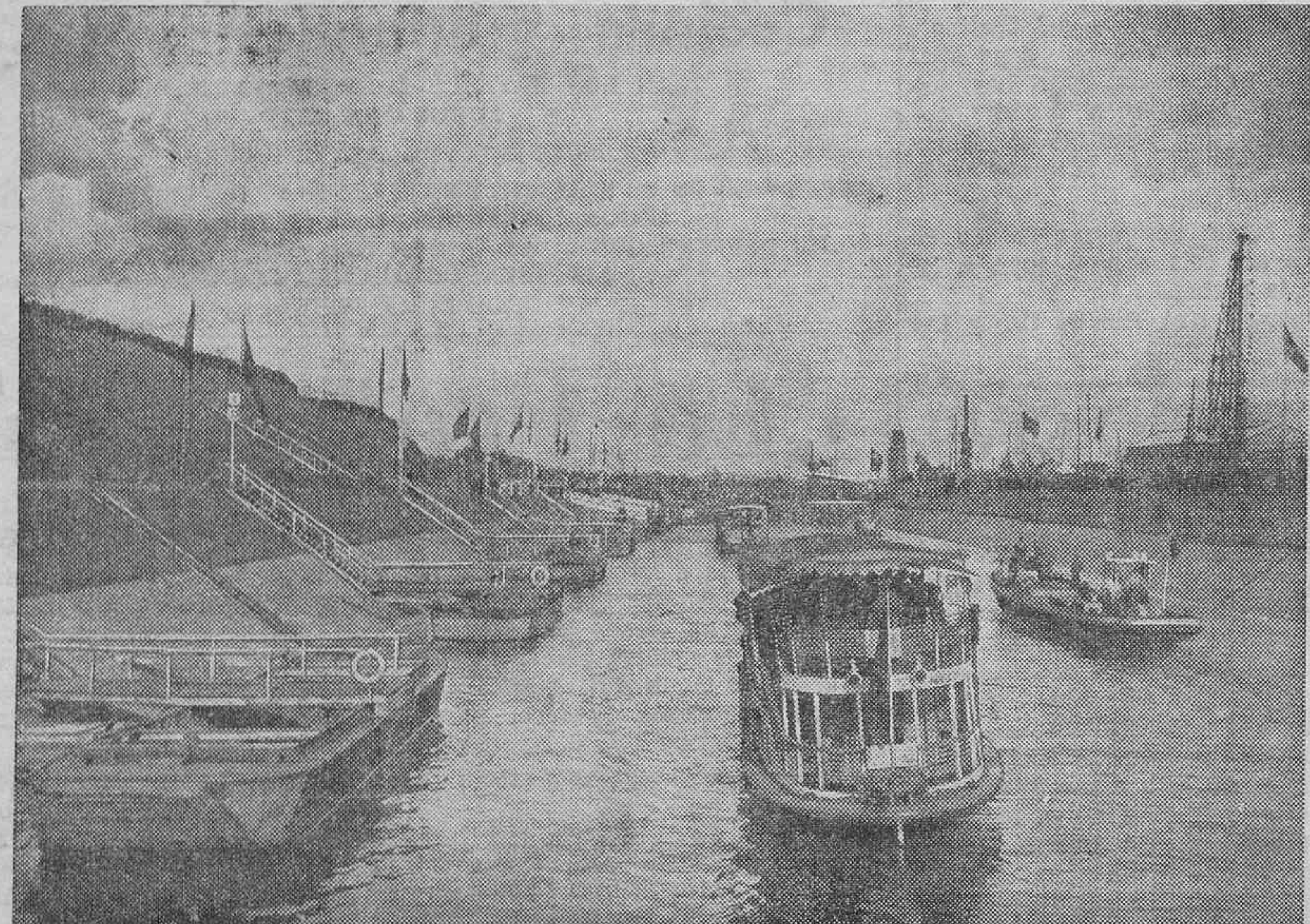
INAUGURACION DE UN NUEVO CANAL EN BELGICA.—El canal Albert, entre Antwerpen y Lieja, que ha sido inaugurado recientemente por el rey Leopoldo, con asistencia de todo el Gobierno y de una enorme muchedumbre.