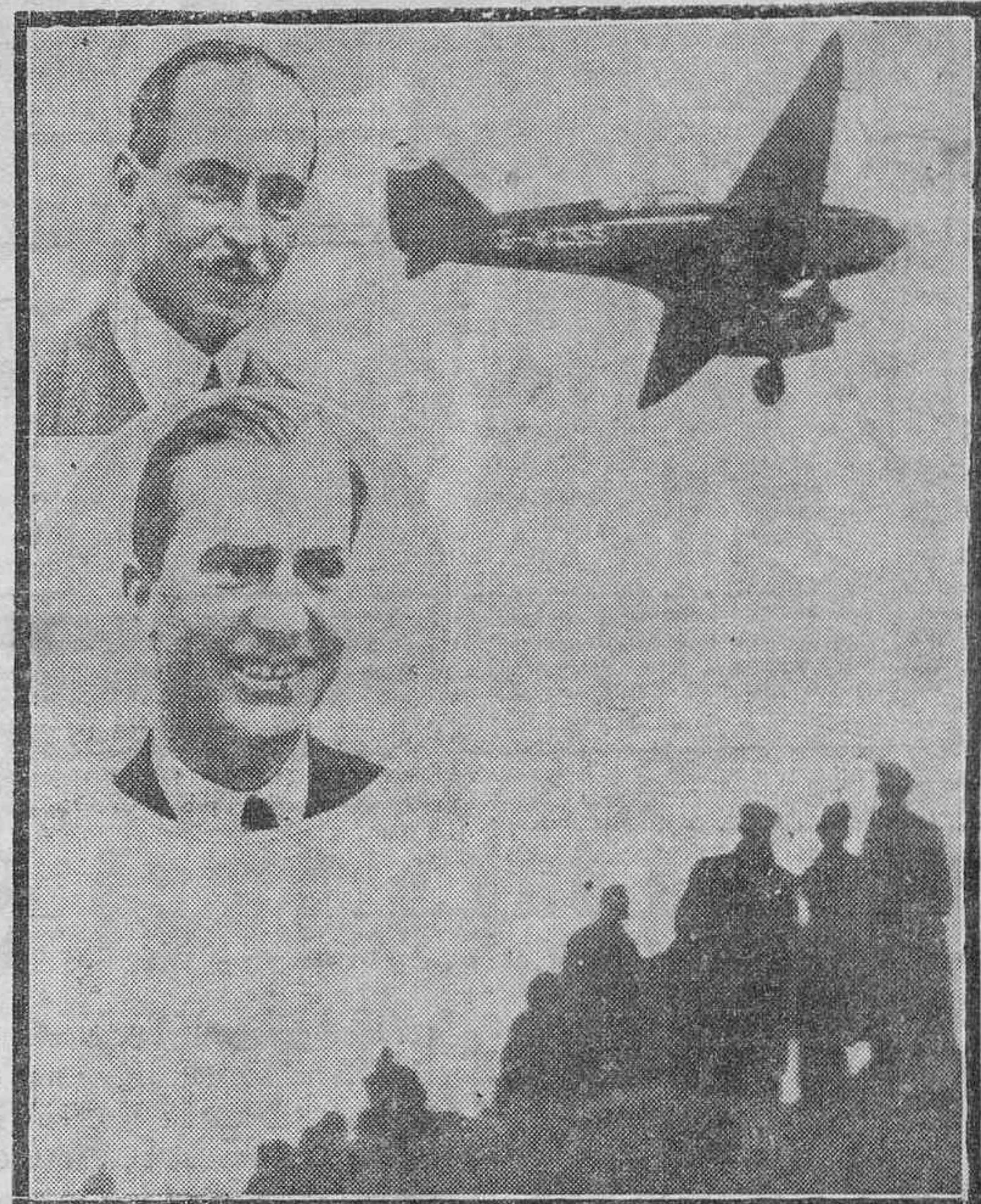
El "Grovesnor House", de C. W. A. Scott y T. Campbell Black, al iniciar su vuelo en el aeródromo de Mildenhall, el 20 de octubre. En la misma foto, los retratos de los vencedores, Scott (arriba) y Black.

El vuelo Londres-Melbourne representa una de las proezas más extraordinarias de la aviación, señalando un paso gigantesco, casi diríase definitivo, hacia la plena conquista del aire. Scott y Campbell Black, han volado desde Inglaterra a Australia en 52 horas y 33 minutos, batiendo en cuatro días y trece horas el record anterior. Para ello, el aparato que conducía, el "Grovesnor House", sólo se detuvo en cuatro aeródromos, en Bagdad, una hora; en Allahabad, unos minutos; en Singapoore, veinte, y en Post Darwin una hora y treinta y cinco minutos. Es decir, en los lugares obligados de control. Diez horas más tarde recorrían el mismo camino los holandeses Pamentier y Moil, en su "hotel flotante", con tres pasajeros y que ha sido una de las sorpresas de esta prueba. El coronel norteamericano Roscoe Turner y Clyde Pangboru, fueron magníficos terceros en esta colosal carrera,