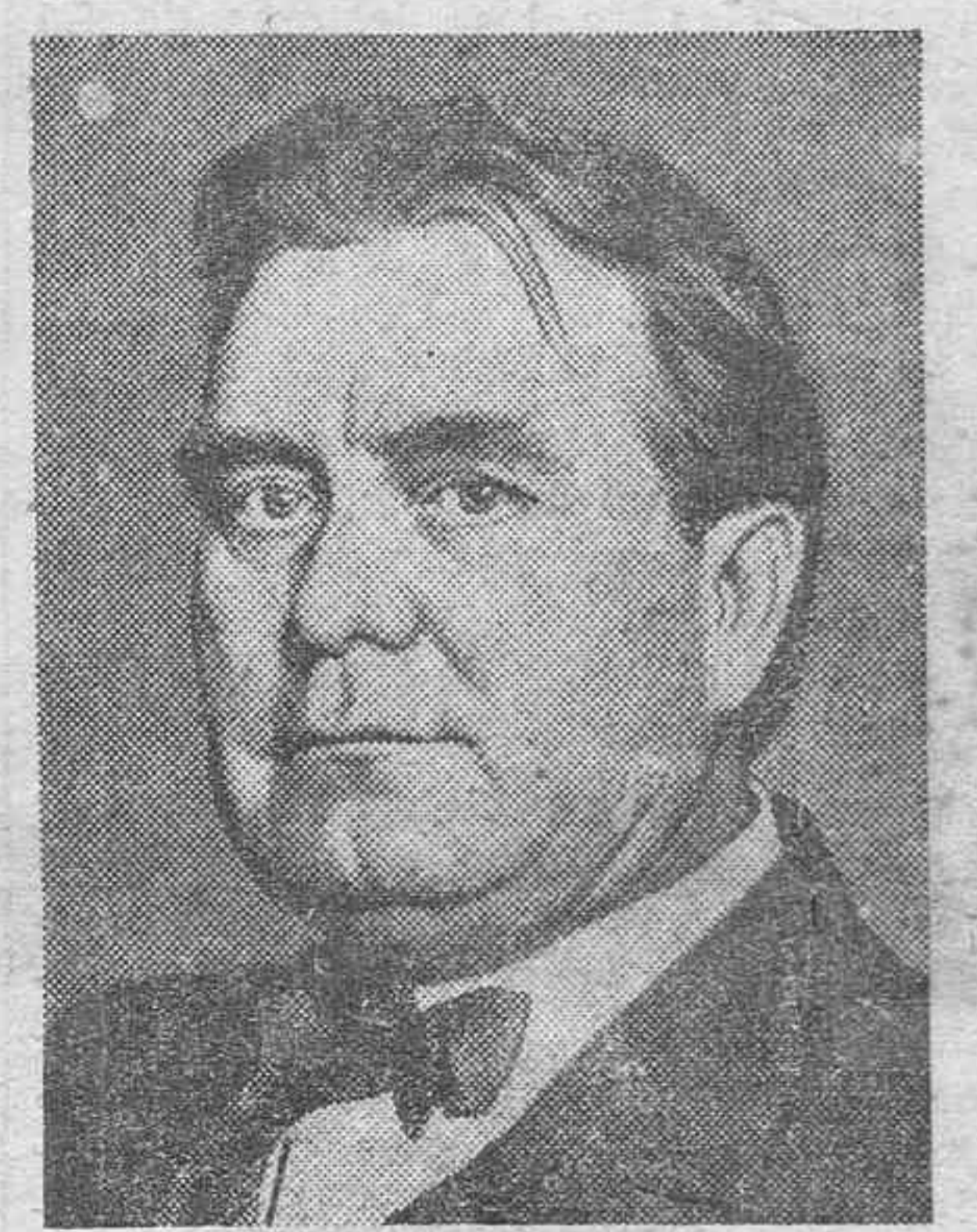
El senador Borah, una de las personalidades de más relieve en Norteamérica, que se ha opuesto resueltamente a toda intervención de su país en los asuntos de Europa.