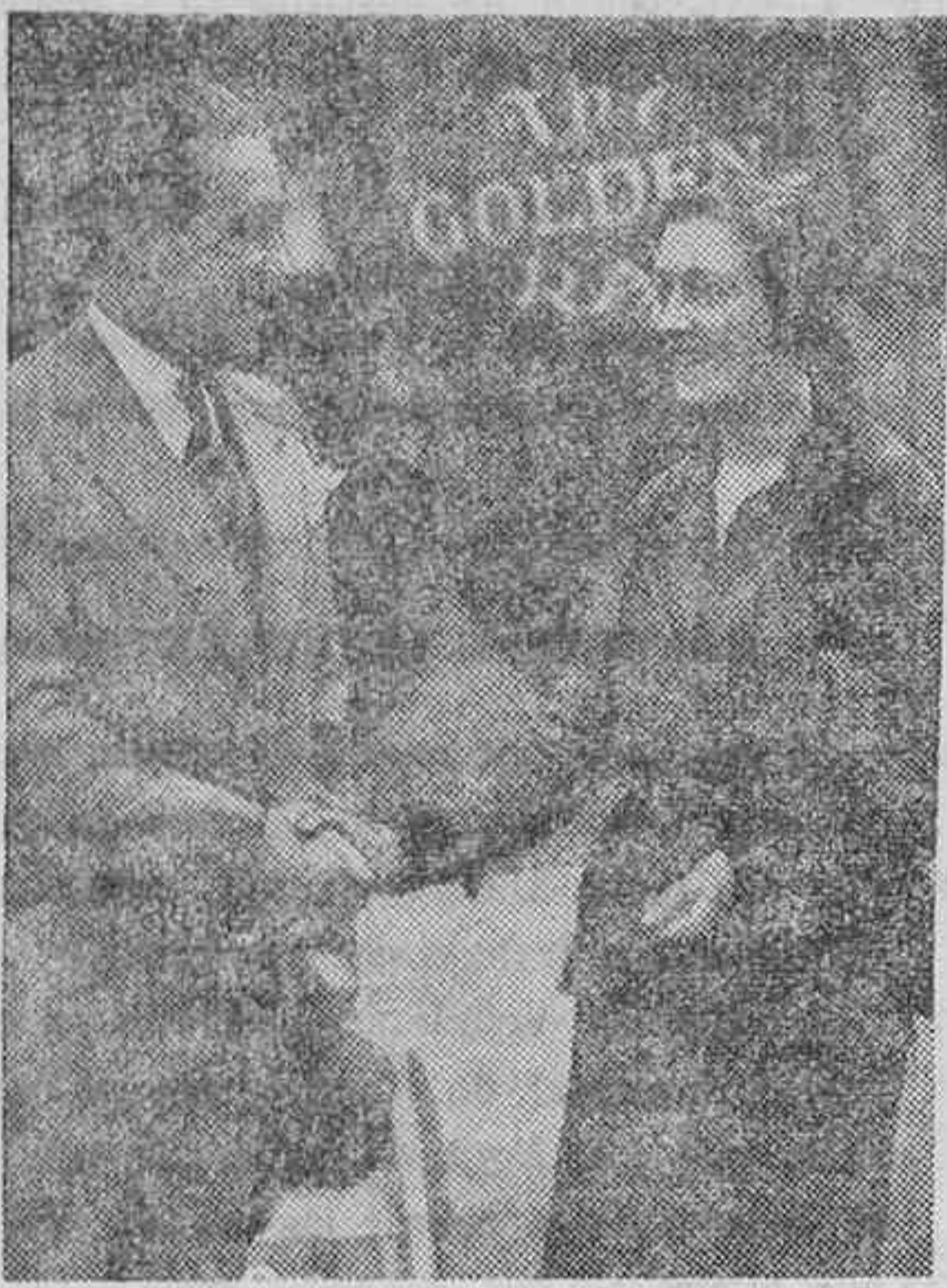
Costes el famoso as, saluda a Amy Johnson y la felicita. "Me ha vencido usted, amiga. Ha batido todos los "records"

record del vuelo de Inglaterra a la Ciudad del Cabo, realizándolo en cuatro días, 17 horas y 22 minutos. "Amy" decidió batir este record, volando en su pequeña máquina, "baby". Muchos de sus amigos trataron de disuadirla de esta empresa. Algunos de sus más grandes admiradores dudaban de que aún sus nervios y su constitución de acero pudieran resistir la tensión de un vuelo solo, contra el tiempo, vuelo que tendría que cruzar dos continentes, cruzar el mar, y cruzar también el desierto más grande del mundo de un extremo al otro. Al parecer, la única persona que no tenía la menor duda de su éxito final era la misma "Amy".