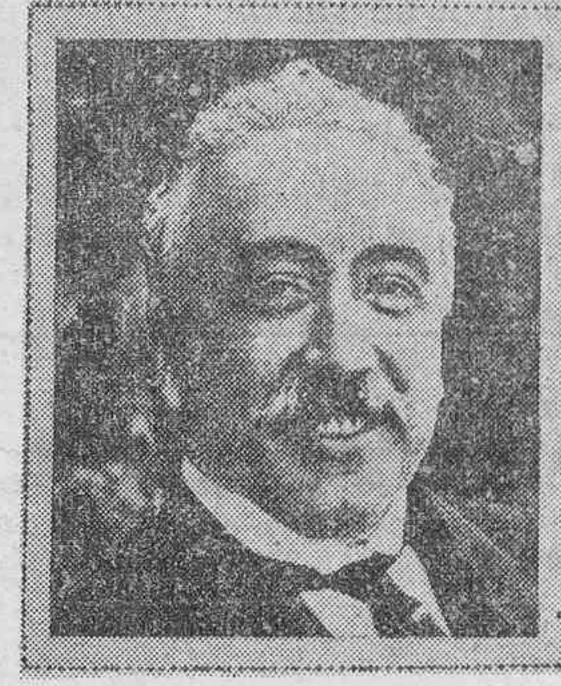
El Gobierno a palacio

Terminó haciendo votos por días de ventura para la nación y su primer Magistrado.