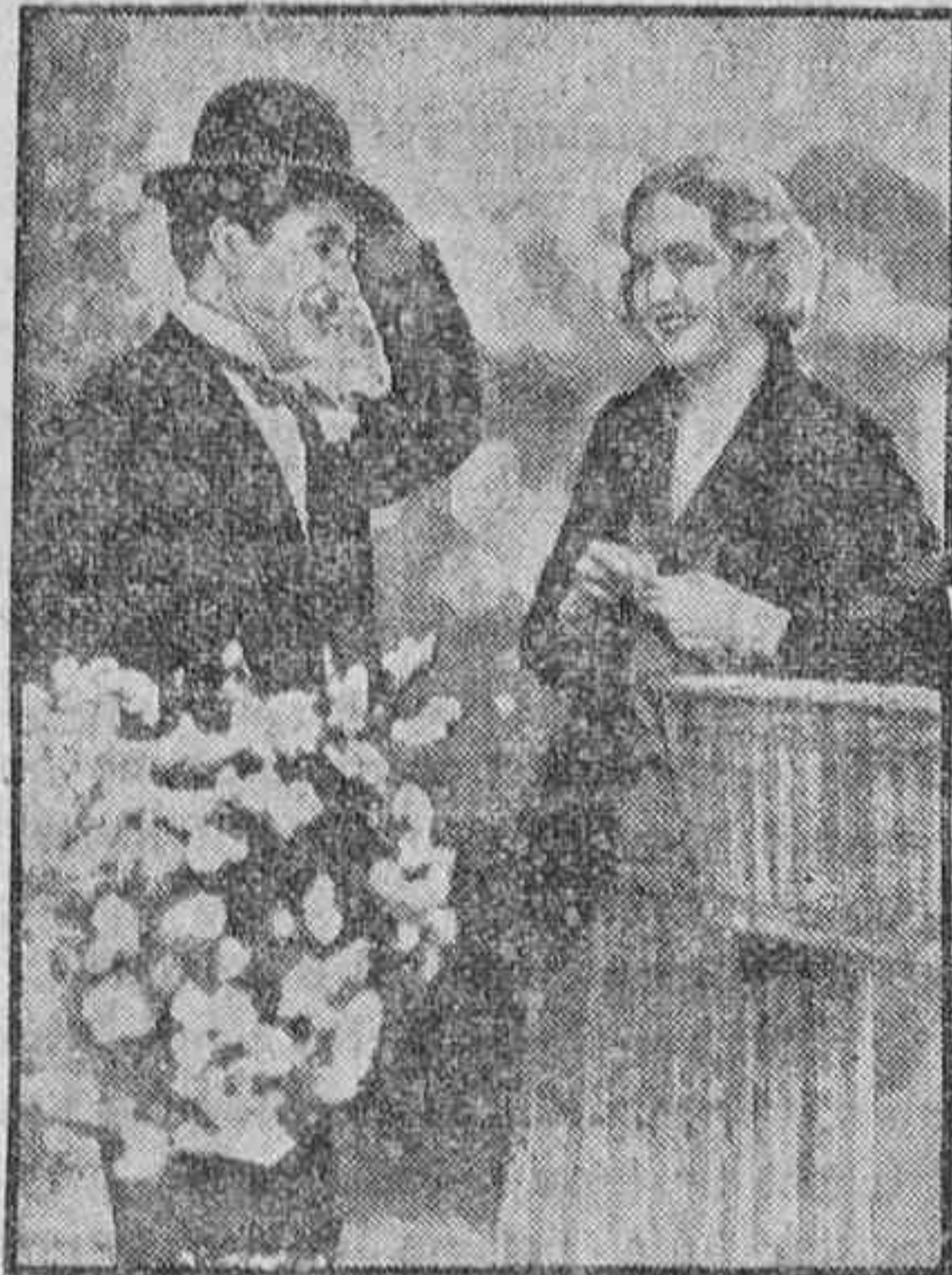
Una escena de «Luces de la ciudad», estrenada anoche en el Parque Recreativo.

El «Titanic» era un vapor de alto porte, una obra maestra de la ingeniería moderna, que se anunció para su primer viaje como barco de condiciones marítimas técnicas tan perfectas que hacían imposible su hundimiento.