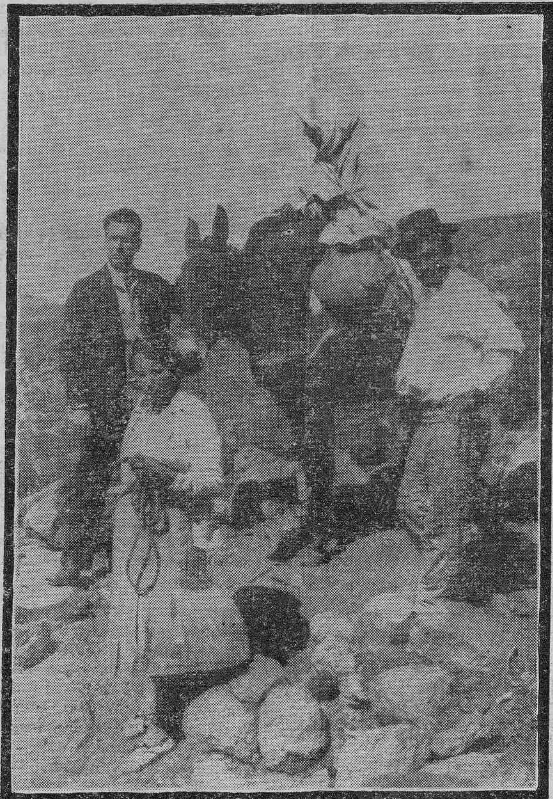
Transporte de una enferma grave, desde el Observatorio de Izaña

Acabamos de llevar a cabo, en unión de nuestro excelente compa- ñero de excursiones montañaras, don José María Segovia, una de las más maravillosas de las muchas e intere- santes que esta hermosa isla ofrece en su casi increíble variedad de paisa- jes, en bruscos contrastes a veces con sus elevadas, escarpadas y sal- vajes cumbres, sus bellísimas y deprimidas cañadas y sus bosques frondosos y solitarios que, sus imponentes siluetas y sus visiones sidéreas en las alayadas de sus gigantescas cimas y sus suaves armonías de luces, reflejos y coloridos en los tibios y fecundos valles. Y hemos tenido la suerte de ser, tras la muy fatigosa jornada, huéspedes una vez más del acogedor auxiliar de me- teorología destinado en el Observa- torio de Izaña, señor López Solís, pa- ra quien conservaremos siempre nuestro cordial agradecimiento por sus habituales solicitud y atenciones, conocidos seguramente de todos los tenerifeños aficionados a abandonar de vez en cuando la «tierra baja» para elvarse a las cimas en una purifica- ción, no sólo física, sino muy princi- palmente espiritual.