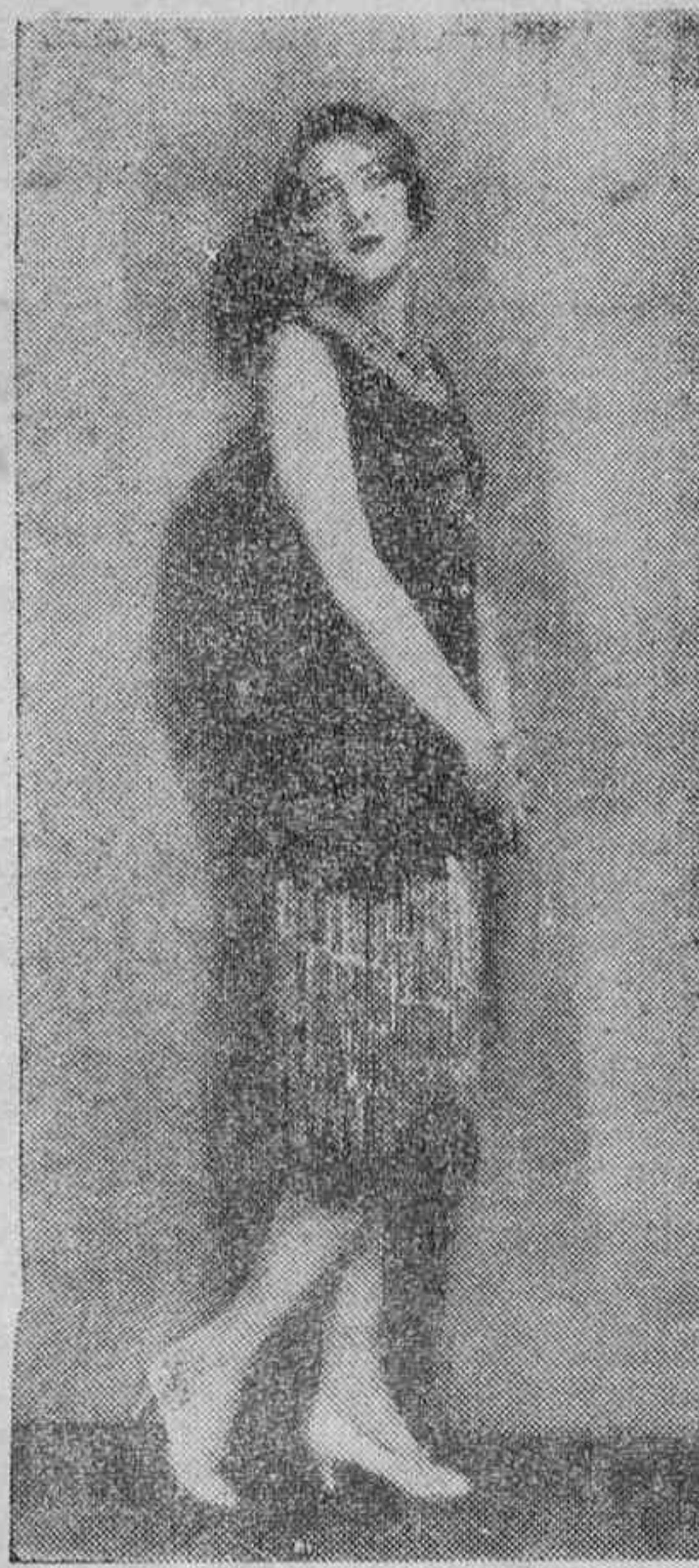
CINEMATOGRAFIA.—La agraciada silueta de Gwan Lee, una de las nuevas triunfadoras de Hollywood, se destaca admirablemente con el lujoso vestido en que apareció en la fotografía.

La Asamblea de Representantes de la Asociación Canaria, en una de las sesiones ordinarias celebradas últimamente, acordó nombrar presidente de honor al general Gerardo Machado, primer magistrado de la República. El acuerdo fué cumplimentado en el mes de Febrero último. Un comisión concurrió al Palacio presidencial