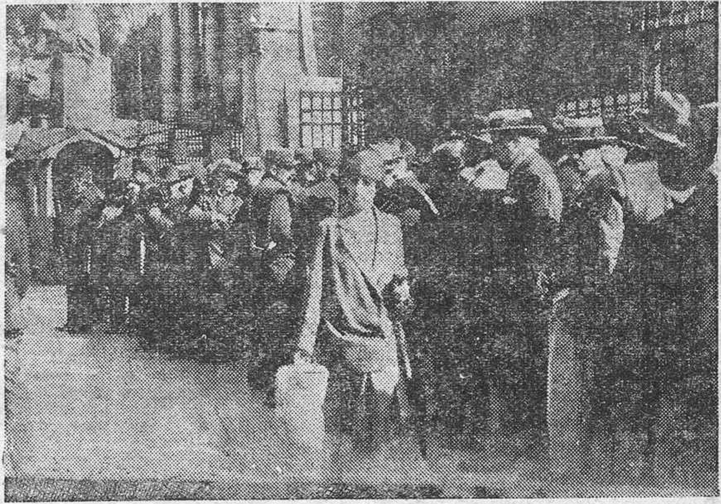
ACTUALIDADES EUROPEAS.—Con motivo de los grandes debates que se han suscitado en la Cámara francesa, el público, aficionado a las emociones fuertes, espera en los alrededores de la Cámara a que se abran las puertas del edificio para presenciar las sesiones. Franz, el famoso ciclista, que acaba de triunfar en el circuito de Bilbao, abrazando al campeón belga, Luciano Buysse.

Las compañías de vapores y las de ferrocarriles pueden decidir en un momento la suerte del archipiélago canario dando facilidades para el