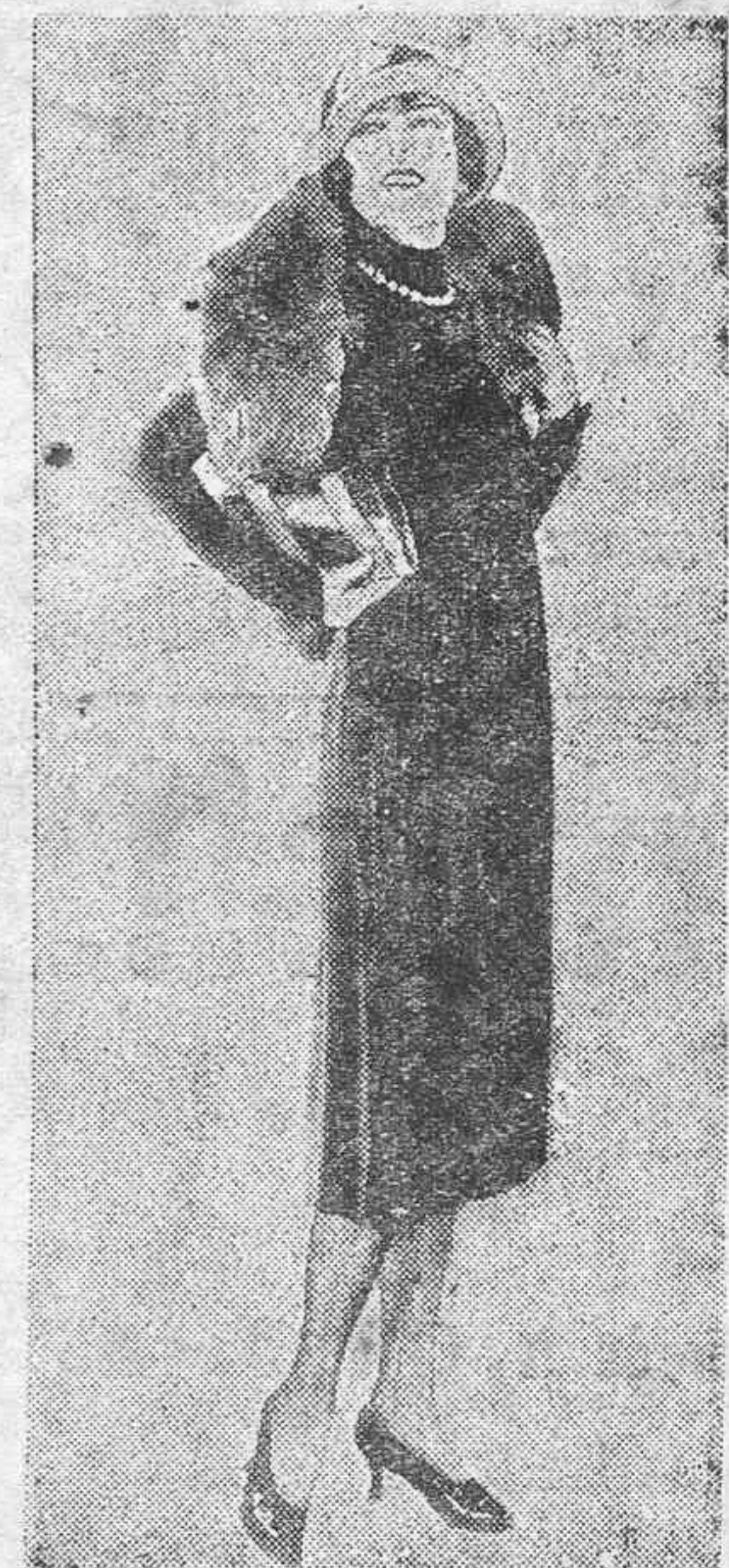
ARTISTAS FAMOSAS.—Carmel Myers, una de las estrellas de cine más populares de América