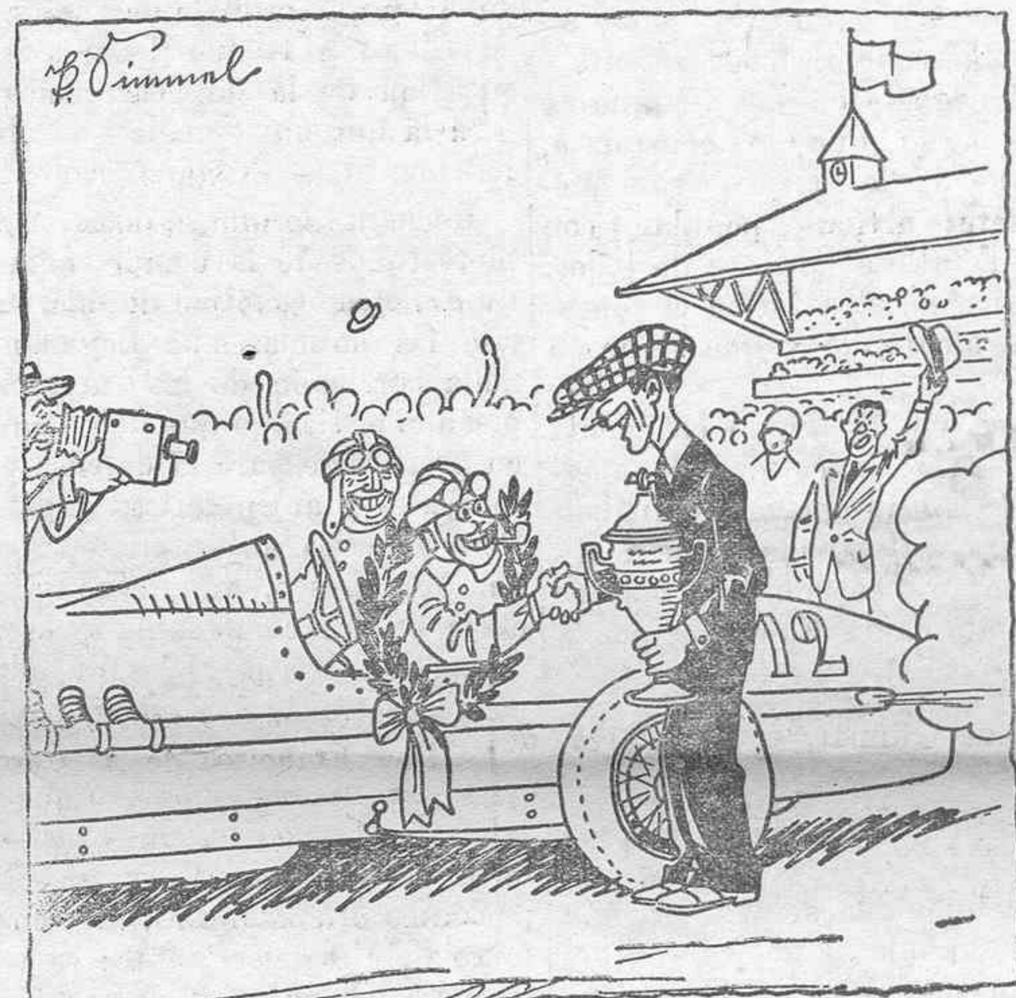
El juez de la carrera: ¡Hombre! Ha sido maravilloso! Pero si el acero es la galleta comparado con sus nervios! ¡Que manera de desafiarse la muerte! El campeón: Gracias... no vale la pena... Va haria lo mismo. Tres tabletas de Bromural (Knoll) antes de la salida y la muerte se le presenta como un chiste malo, que son los que más hacen reír.

En la presente semana regalaremos un disco «Constantinopla», precio foxtrot, o un disco «Pregón de Cunito», del «Carnet de Eslava», a toda persona que adquiera juntos CUATRO DISCOS «ODEON». Hemos recibido «Si vas a París, papá», «Ay, Tomasa!», «Por si las moscas», FOLIAS, ISAS, MALAGUEÑAS, Vals en harmónicos y Estudios, por Carmelo Cabral. BAZAR LAFAYETTE, Valentín Sanz, 13. Teléfono interurbano.