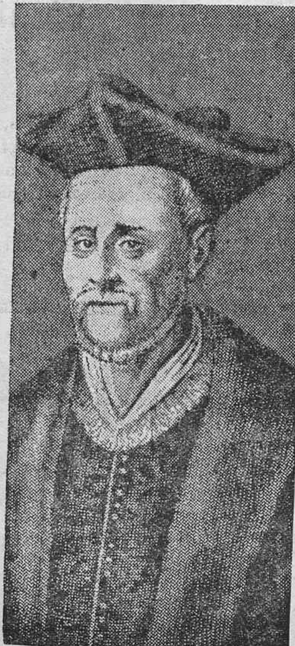
El retrato de Rabelais, que se encuentra en su casa natal de Chinon, transformada en museo por el Gobierno francés.

ahora cree haber sido acaso demasiado pródigo.