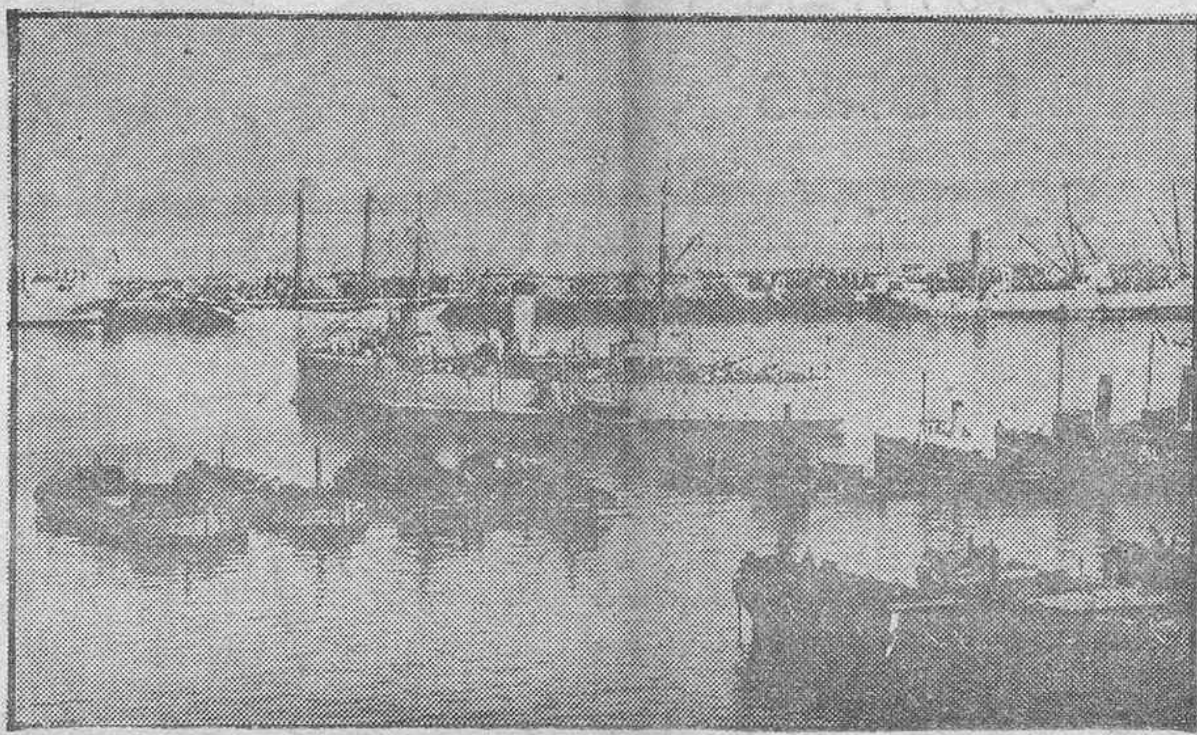
BUQUES DE GUERRA EN EL PUERTO.—En primer término, el cañonero «Bonifaz».