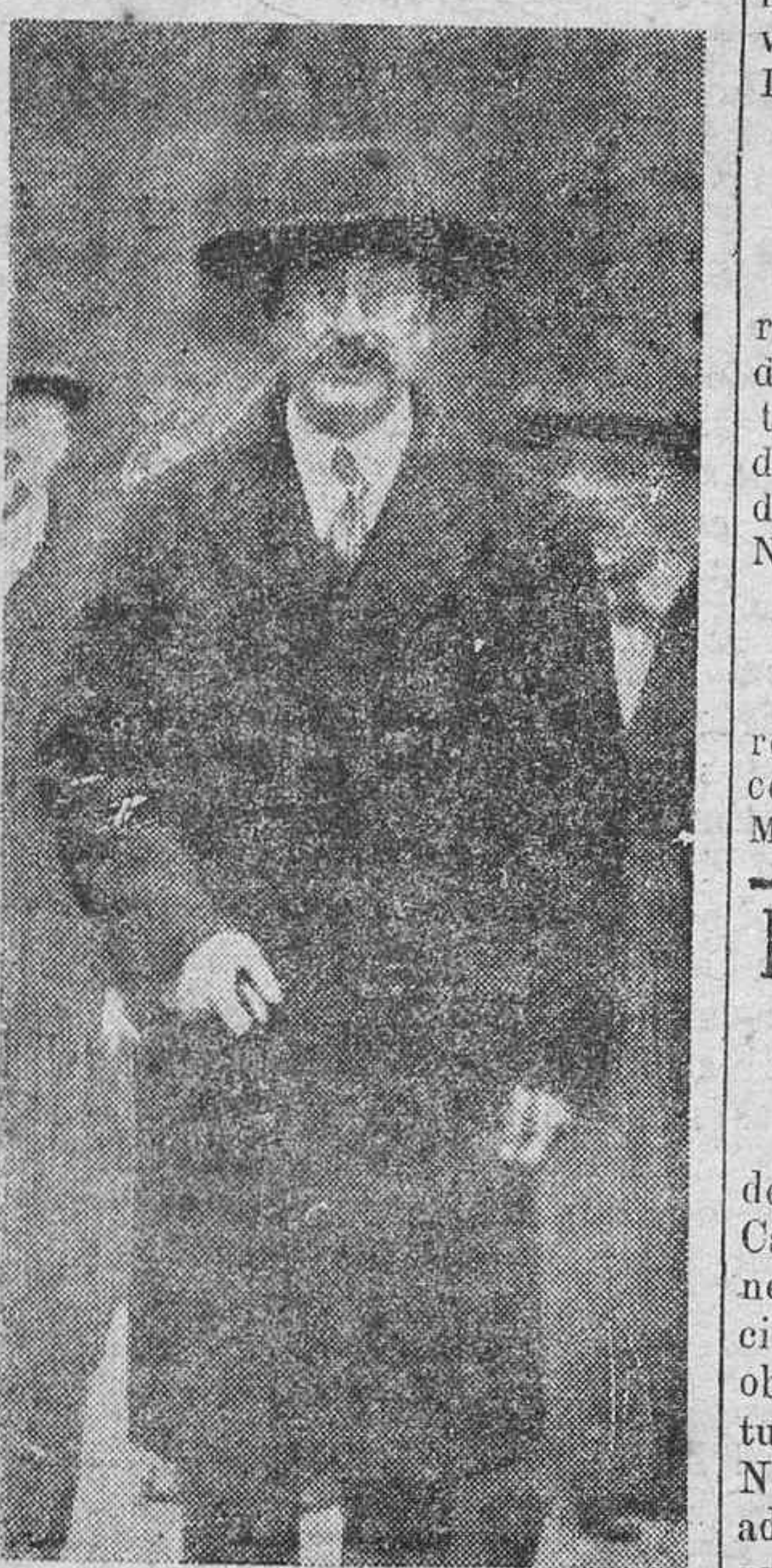
FIGURAS DE ACTUALIDAD.—León Blum, líder de los socialistas y uno de los primeros tribunos de la Cámara francesa.

Protesto. Aunque me dejen solo en la protesta y no logre mi voz despearlar un eco práctico en los centros