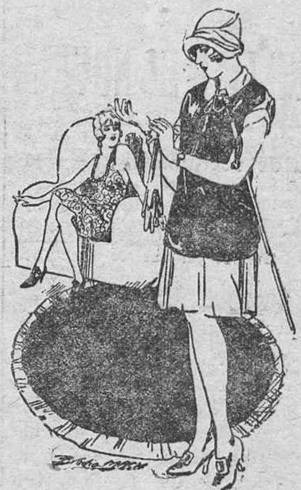
—Sí, me gustaría casarme; pero con un hombre que no mire nada más que a mis ojos. —Pues será necesario que te alargues la falda.

En real orden de 26 de Octubre de 1925 (B. O. número 91) el Subsecretario de Instrucción Pública dijo al Subsecretario de Gobernación: "Teniendo en cuenta que en modo alguno puede tolerarse que los Ayuntamientos dejen de abonar la indemnización por casa, y principalmente en este caso por haberse dictado resolución según orden de 31 de Diciembre pasado, "siendo firme por no haber interpuesto recurso de alzada dentro del plazo legal"; S. M. el Rey, que Dios guarde, ha resuelto se ponga este hecho en conocimiento de V. E. encareciéndole la conveniencia de que comunique al gobernador de Málaga obligue al Ayuntamiento a cumplir la citada orden de