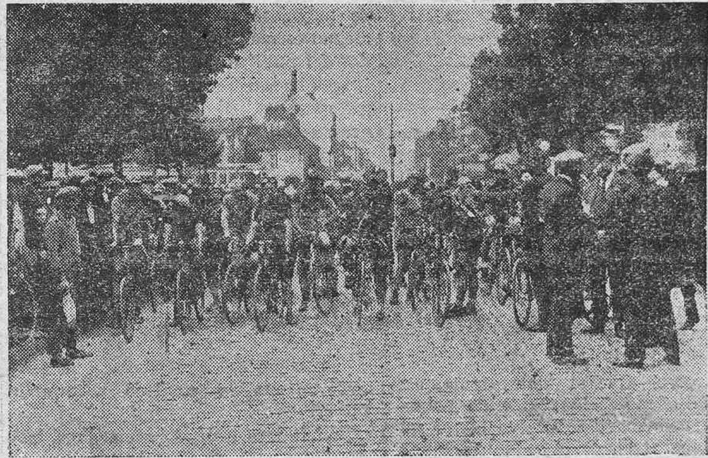
He aquí un interesante detalle de las últimas carreras internacionales, en las que obtuvo el primer premio el célebre ciclista Ch. Pelisier, el primero a la izquierda del grupo de corredores que aparece en nuestra fotografía