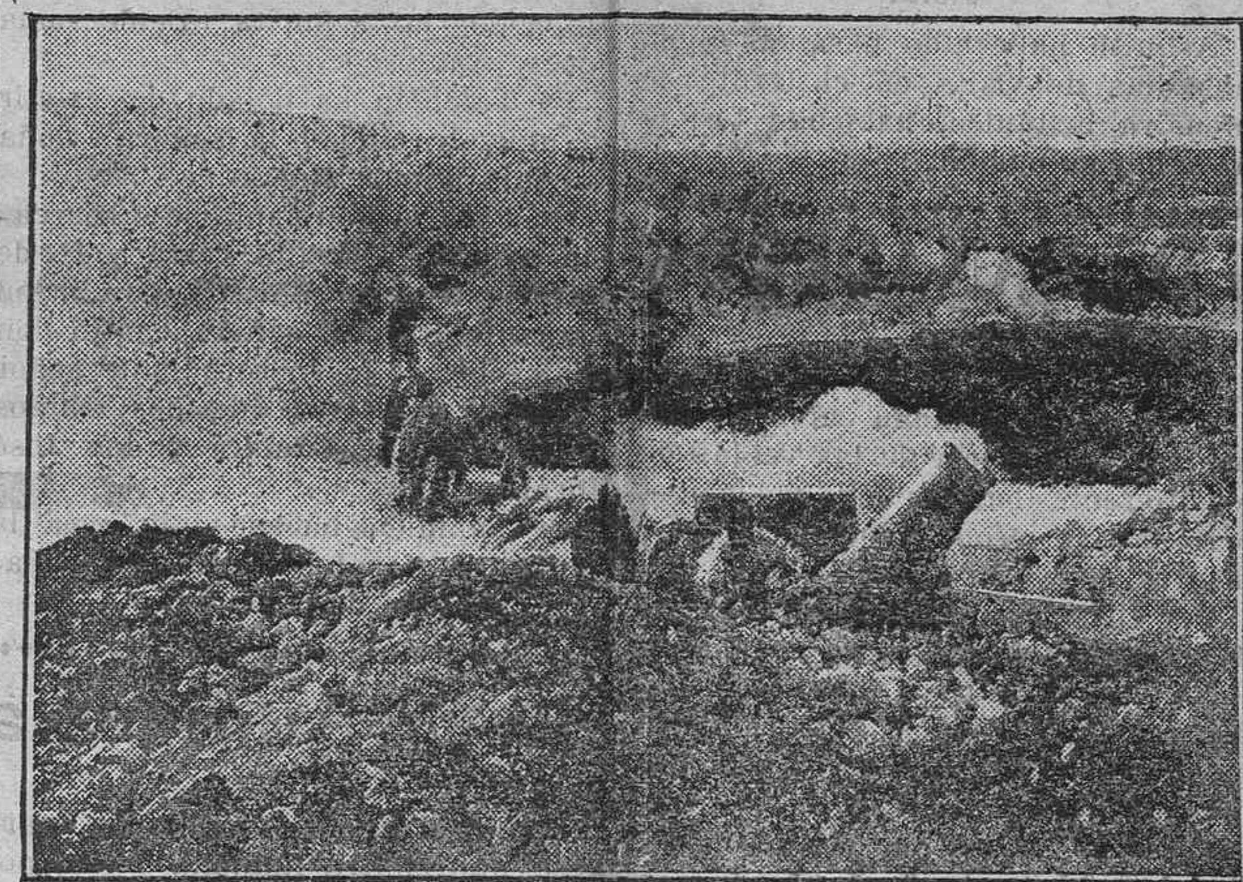
LOS OBJETOS DE GRAN CALIBRE DISPARANDO