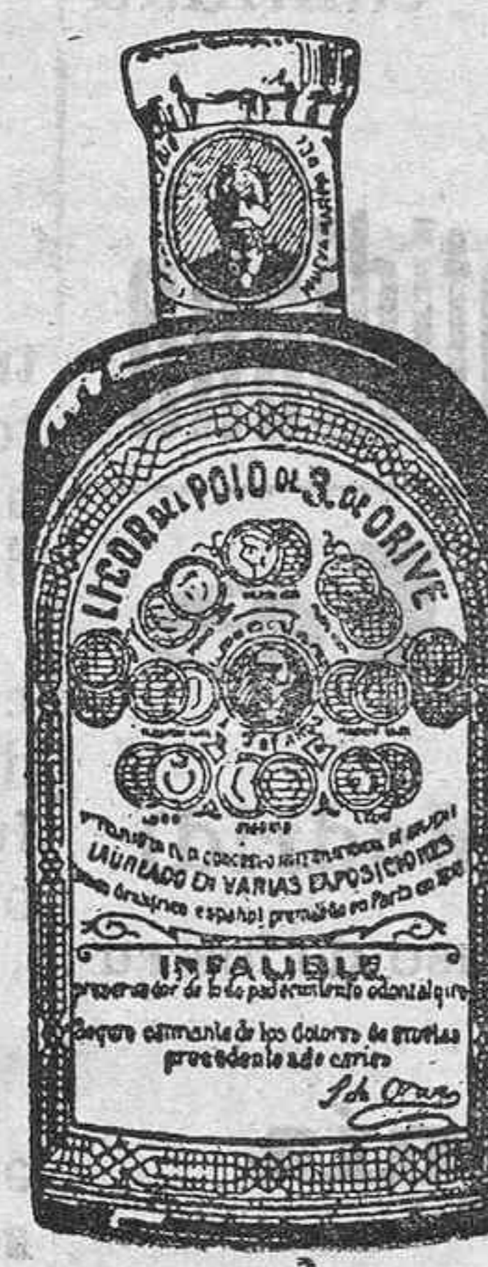
Frasco 1'50 pesetas