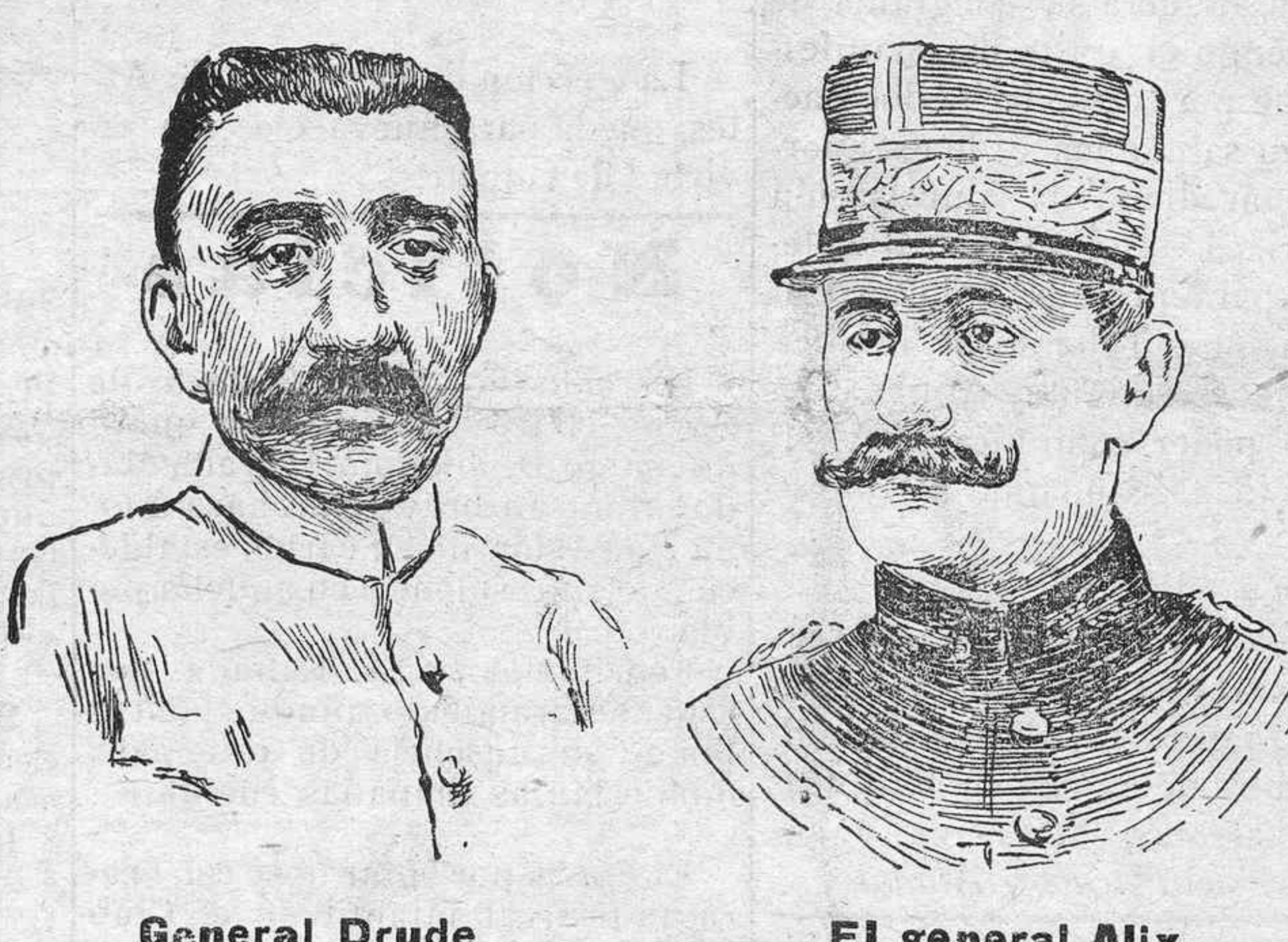
General Drude El general Alix

La solución dada por el gobierno francés al asunto de Ujida, demuestra que no eran infundadas las acusaciones que se formularon contra Mr. Destalleur y compinches. Sin embargo, según afirman los que se tienen por bien enterados, no ha sido aquella todo lo radical que procedía.