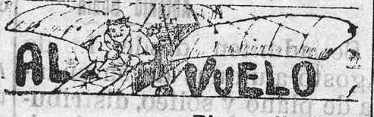
Risa y llanto.

En algunos sitios estas proclamas han sido arrancadas de la pared, atribuyéndose estos manejos a la policía.