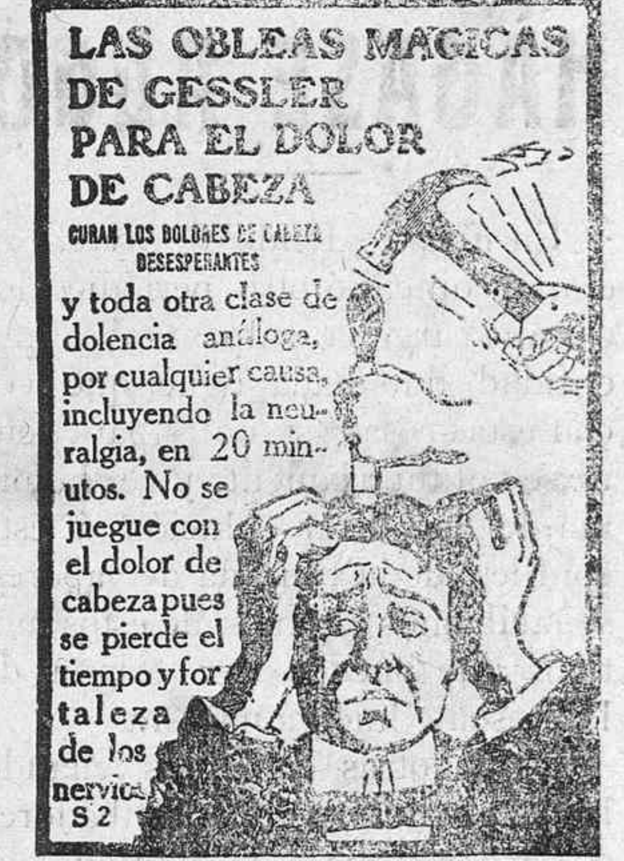
De venta: Droguería Espinosa.

dencia; pueden evitar un espectáculo de mal gusto en sus comienzos y sin embargo esperan a que este se desarrolle para entonces pecar de enérgicos. Había terminado su tocada la banda municipal cuando los báquicos noruegos promovieron un alboroto; un guardia se acercó a ellos y trató de detener a uno... y he aquí el principio de la película; el noruego corre desenfrenadamente y sus compañeros le imitan; el guardia le persigue acompañado de otros municipales y los guasones noruegos dan vueltas alrededor de la manzana, donde está enclavado el Gobierno civil; la gente corre a la par que los que se disputaban el campeonato de la velocidad, produciendo un efecto cinematográfico divertido. Y ahora empieza la brutalidad; los perseguidores desentranan el sable ante un gesto de amenaza de uno de los borrachos y luego de detenido por un joven, el valiente municipal la emprende a sablazos con el noruego, dando un espectáculo inepto y salvaje que indignó al público.