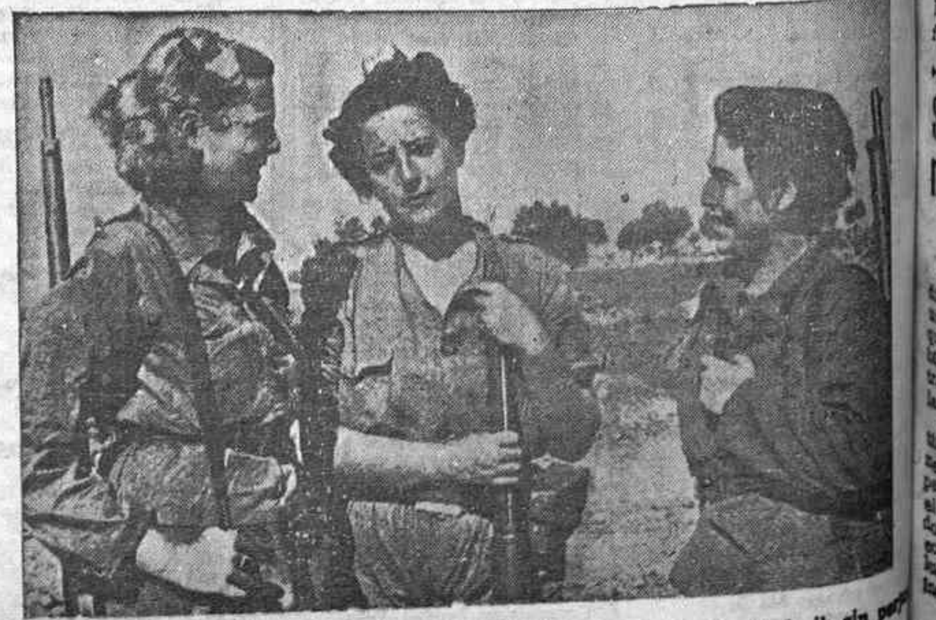
Las manos que se hicieron para acariciar, también saben del manejo del fusil, sin que se les olviden