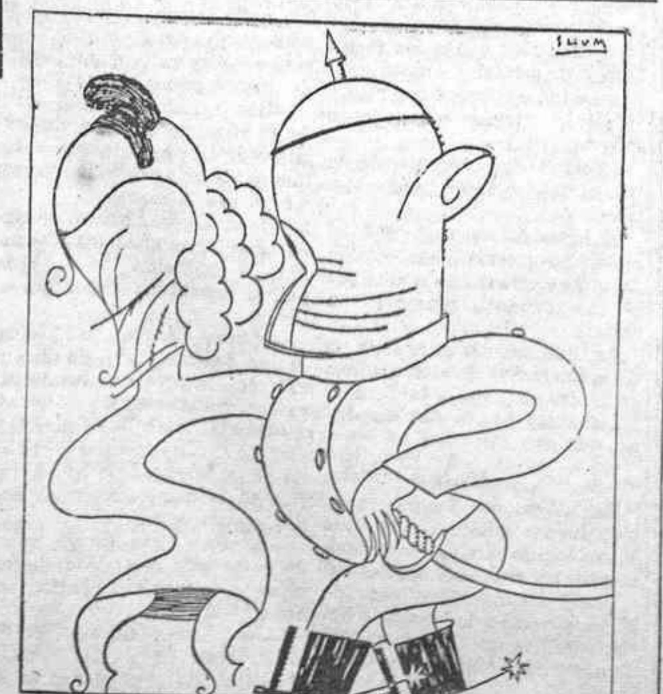
El curioso observador: ¿Y pensar que tal pareja haya podido entenderse!