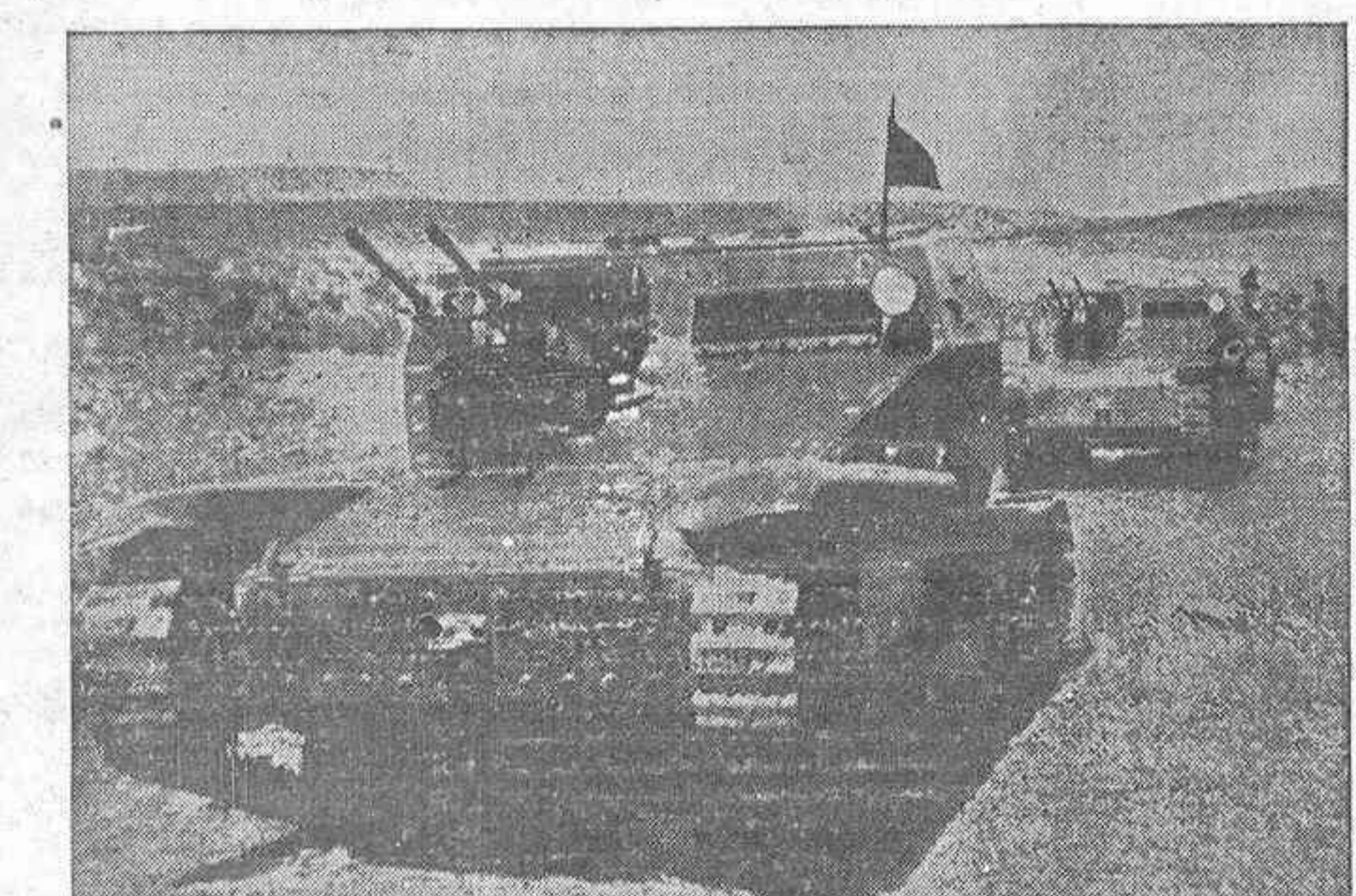
Estos orugas de fabricación italiana han sido capturados al enemigo hace días en los frentes de Madrid

COMISIÓN PROVINCIAL DE ABASTECIMIENTOS DE ASTURIAS-LEÓN Convocatoria A los componentes de esta Comisión; se les recuerda la reunión periódica que ha de celebrarse en el día de hoy, en el local de costumbre — El secretario técnico