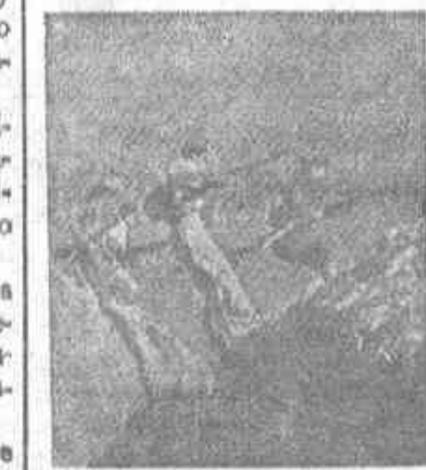
Así avanzan nuestros milicianos

bardeado la sierra de Montevías habiendo actuado la nuestra con gran intensidad sobre la zona de retaguardia del enemigo bombardeando entre otras partes la estación de Getafe.