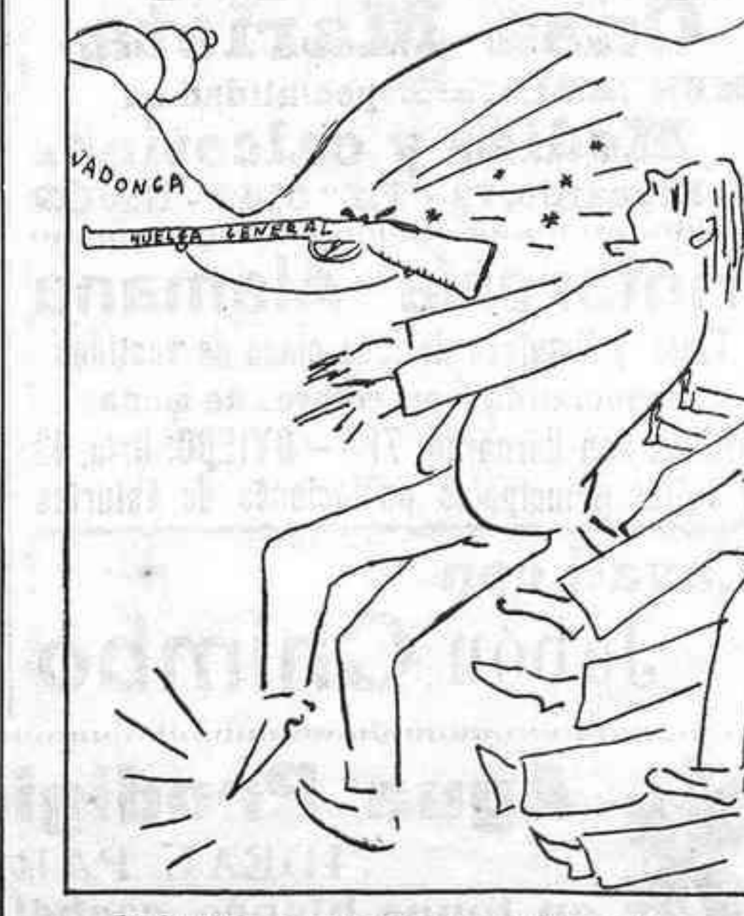
La huelga convocada por el comité de Pravia, les ha salido el tiro por la culata.