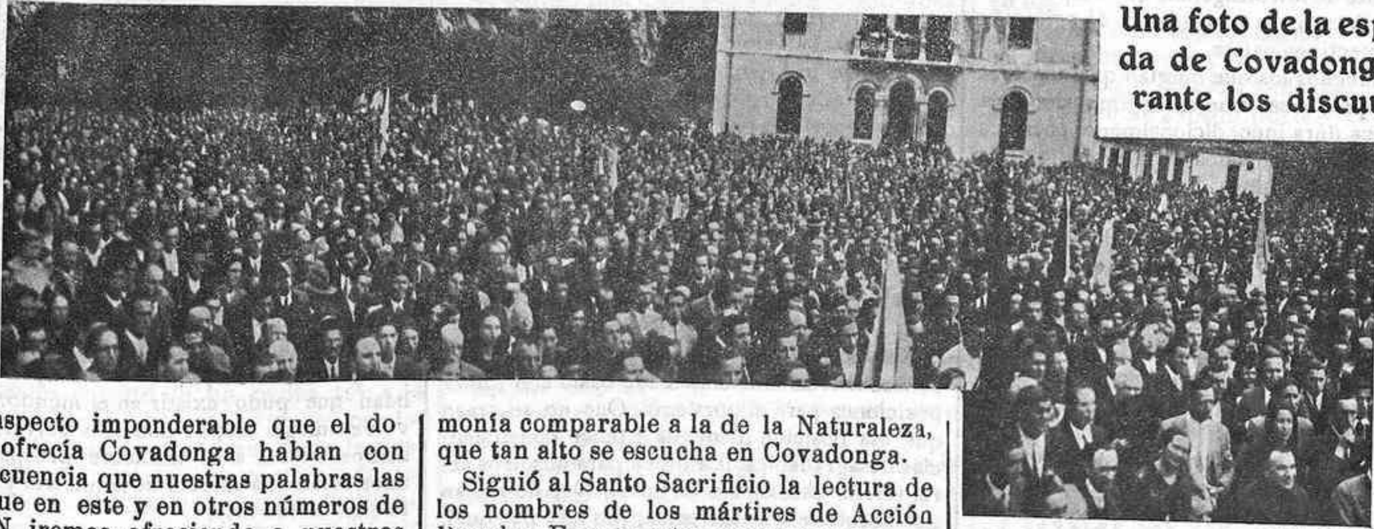
Una foto de la esplanada de Covadonga, durante los discursos.

Del aspecto imponderable que el domingo ofrecía Covadonga hablan con más elocuencia que nuestras palabras las fotos que en este y en otros números de ACCION iremos ofreciendo a nuestros lectores.